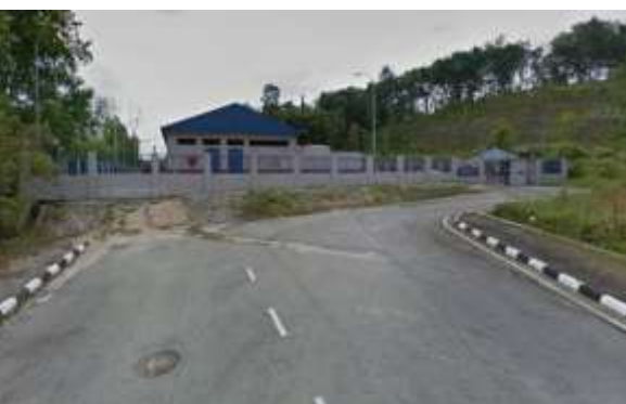
6.PPU Meru Raya 1 sedia ada