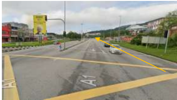
5.Cadangan laluan HDD