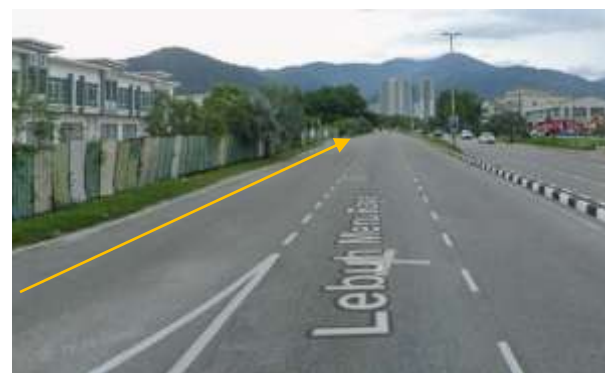
3.Cadangan laluan HDD