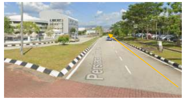
7.Cadangan laluan HDD