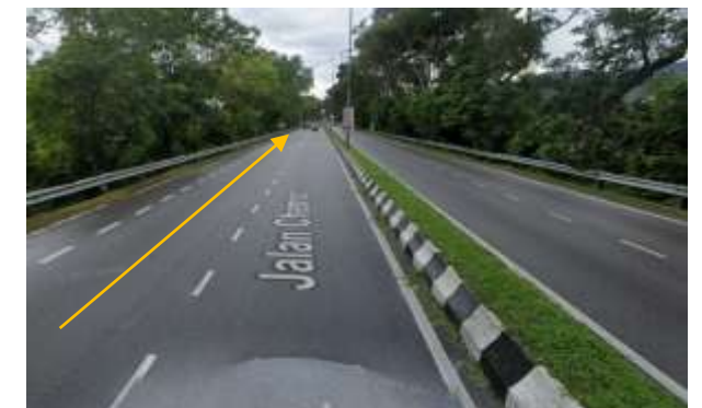
9.Cadangan laluan HDD