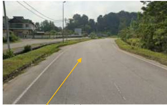
13. Cadangan laluan HDD