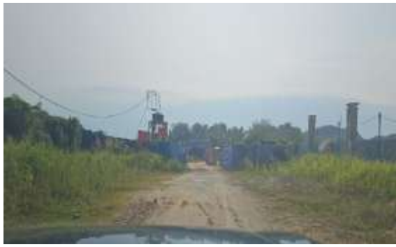
15. Laluan akhir ke tapak