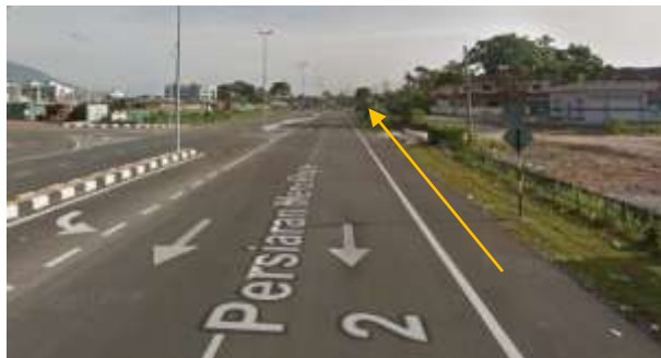
2.Cadangan laluan HDD