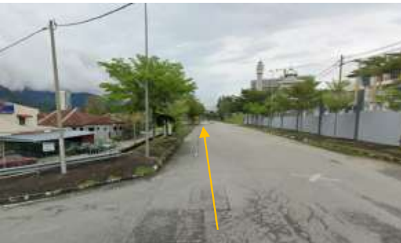
12. Cadangan laluan HDD