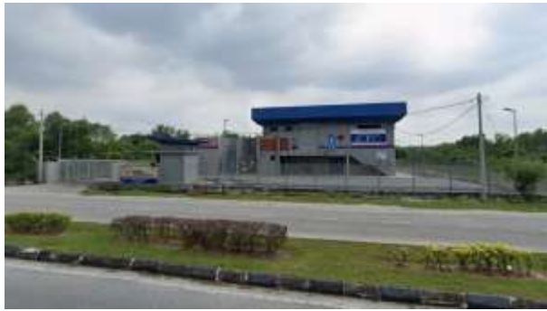
1.PPU Meru Raya 2 sedia ada

Cadangan laluan kerja-kerja HDD bagi bekalan elektrik ke Projek Jati Residensi Meru Raya ,Ipoh Perak dari PPU 1 dan PPU 2.