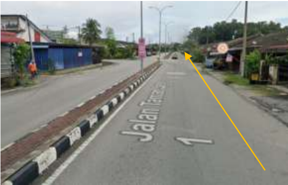
11. Cadangan laluan HDD