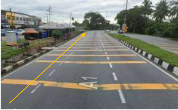
10. Cadangan laluan HDD

Cadangan laluan kerja-kerja HDD bagi bekalan elektrik ke Projek Jati Residensi Meru Raya ,Ipoh Perak dari PPU 1 dan PPU 2.