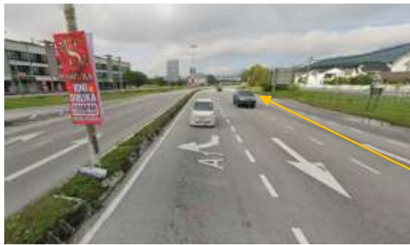
4. Cadangan laluan HDD