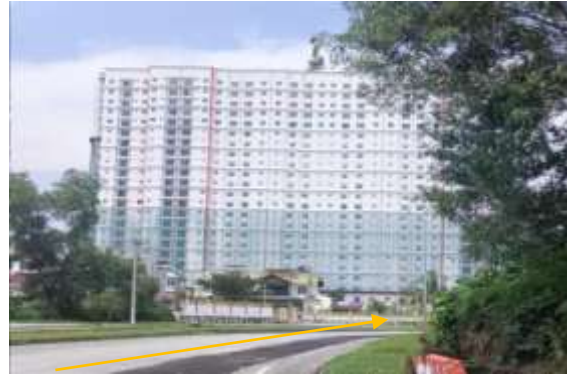
14. Cadangan laluan HDD