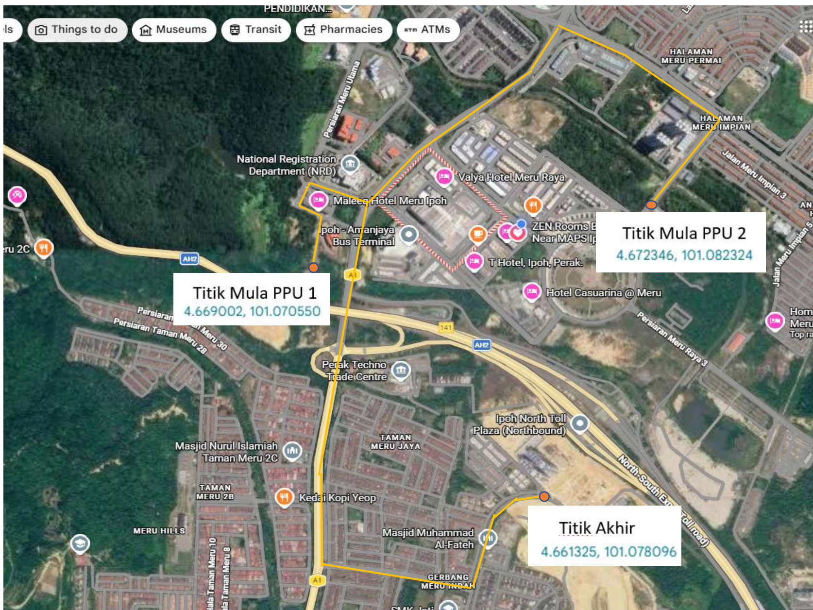
— Cadangan HDD dari PPU 1 sejauh 2792m dan PPU 2 sejauh 4232m

Cadangan laluan kerja-kerja HDD bagi bekalan elektrik ke Projek Jati Residensi Meru Raya ,Ipoh Perak dari PPU 1 dan PPU 2.