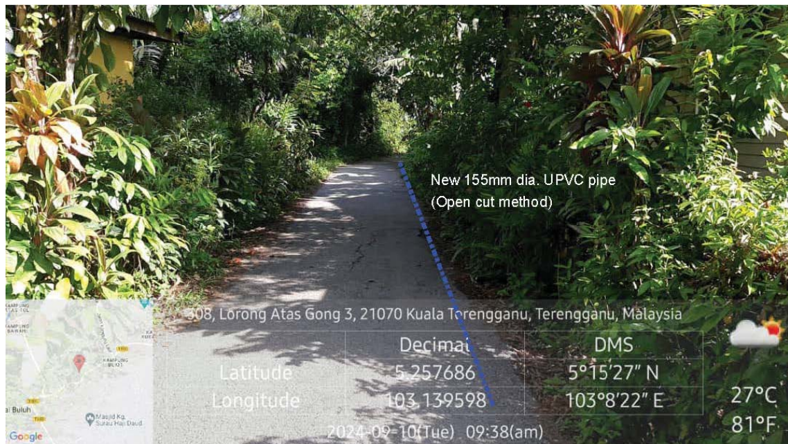
GAMBAR 3 : Kawasan cadangan laluan paip baru pada laluan jalan.