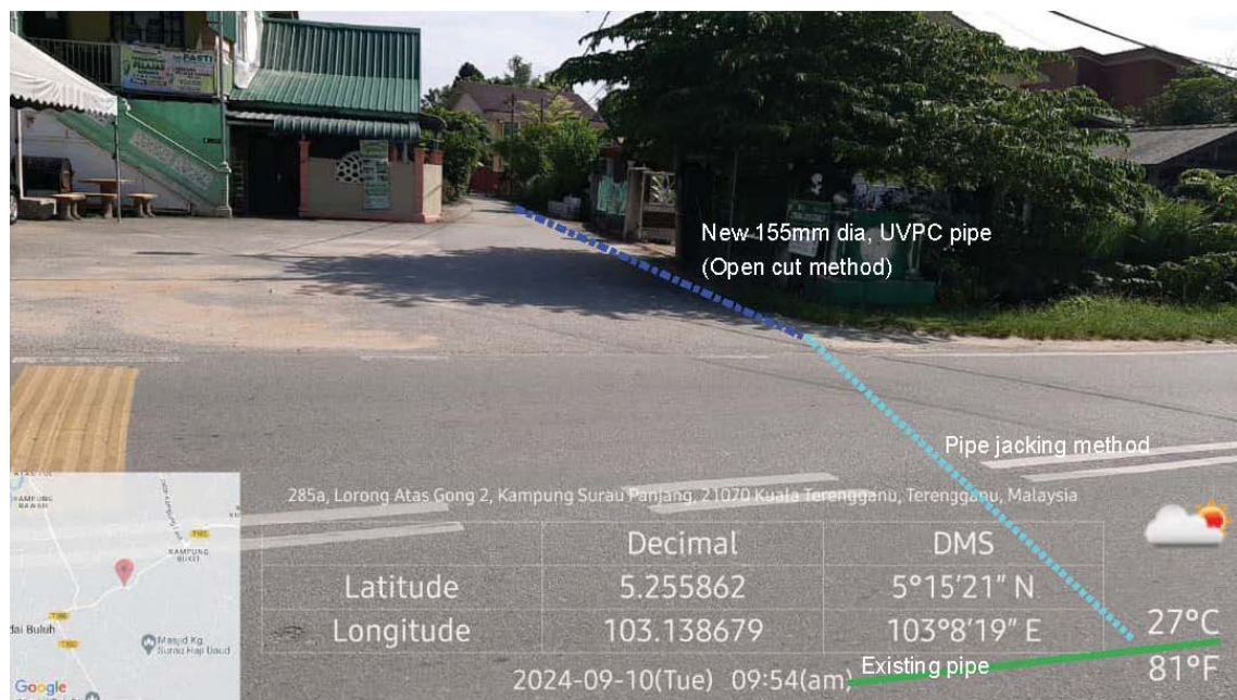
GAMBAR 4 : Kawasan cadangan laluan paip baru dan sambungan ke paip sedia ada.