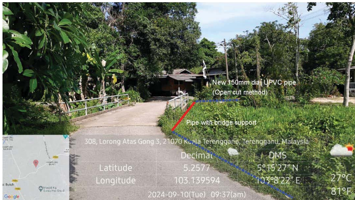
GAMBAR 2 : Kawasan cadangan laluan paip baru dan lintasan parit (jambatan laluan paip dibina).