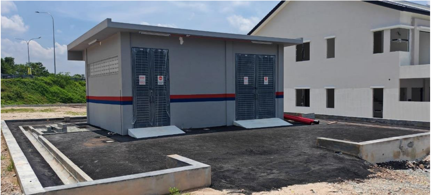
GAMBAR 1 : PENCAWANG SEDIADA

CADANGAN MEMBINA SKIM PERUMAHAN FASA 1 YANG MENGANDUNGI : 1) 81 UNIT RUMAH TERAS 2 TINGKAT DI ATAS PLOT 122 HINGGA PLOT 202 2) 1 UNIT PENCAWANG ELEKT DI ATAS PLOT 204 DI ATAS LOT 17486 (GRN 40830), LOT17488 (GRN 40831), LOT 17503 (GRN 40832), DAN LOT 330829 (GRN 141032), BERSEBELAHAN HALAMAN MERU PERMAI, MUKIM HULU KINTA, DAERAH KINTA PERAK DARUL RIDZUAN UNTUK TETUAN ANGSAR BINA SDN. BHD.