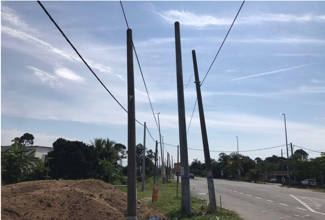
Gambar Lokasi (LAP)