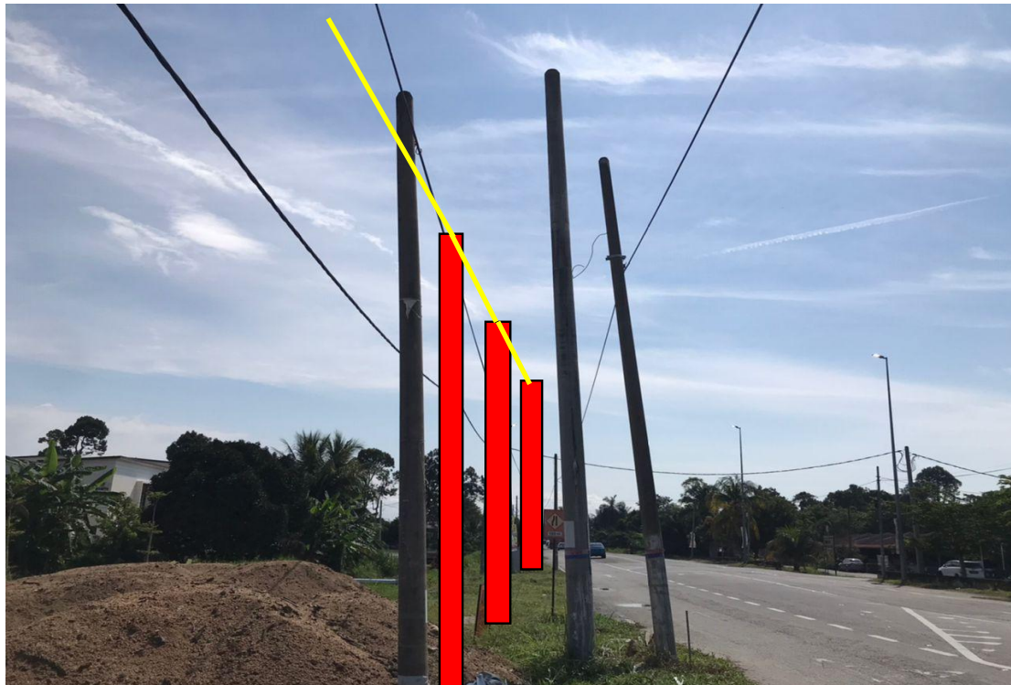
Gambar Lokasi (TNB)