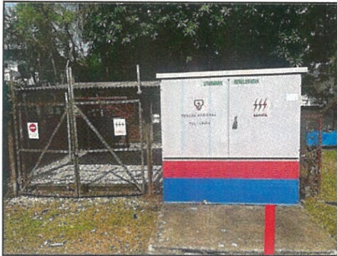
PENCAWANG ELEKTRIK JLN IBRAHIM