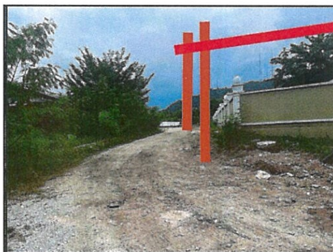
CADANGAN MENANAM TIANG BARU DAN MERENTANG TALIAN ATAS