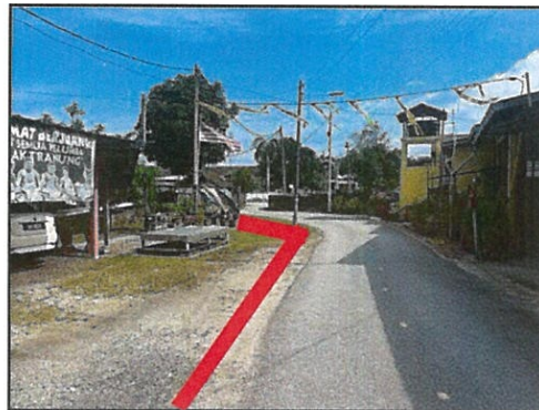
CADANGAN OPEN CUT TANAH SEJAUH 50 METER