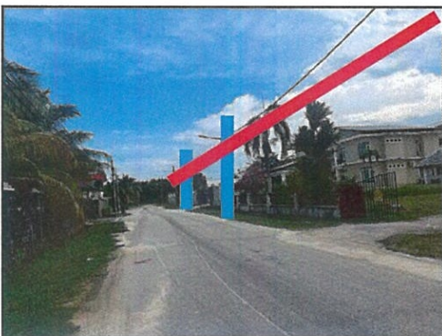
CADANGAN MERENTANG TALIAN ATAS PADA TIANG SEDIADA