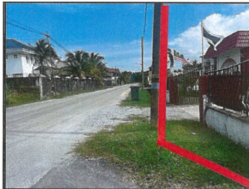
CADANGAN MERENTANG TALIAN ATAS PADA TIANG SEDIADA