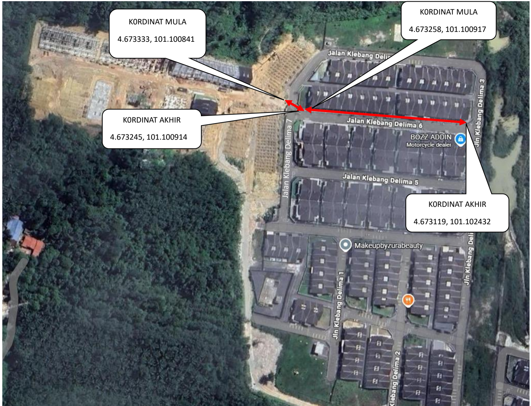
JALAN KLEBANG DELIMA 6 & 7 - Cadangan 100mm \varnothing PVC Conduit Telekom Cable