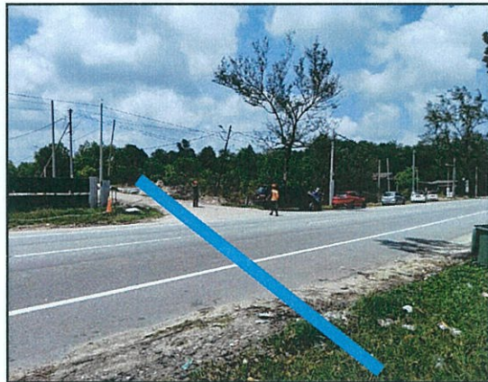
CADANGAN HDD SEJAUH 70 METER