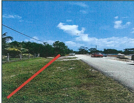
CADANGAN OPEN CUT TANAH