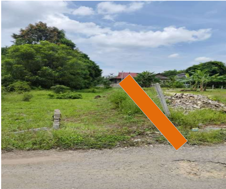
KAWASAN KERJA MELIBATKAN OPEN CUT DI ATAS TANAH BIASA