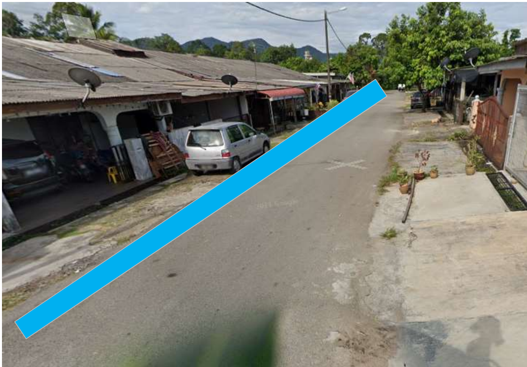
KAWASAN KERJA MELIBATKAN OPEN CUT DI ATAS JALAN TAR