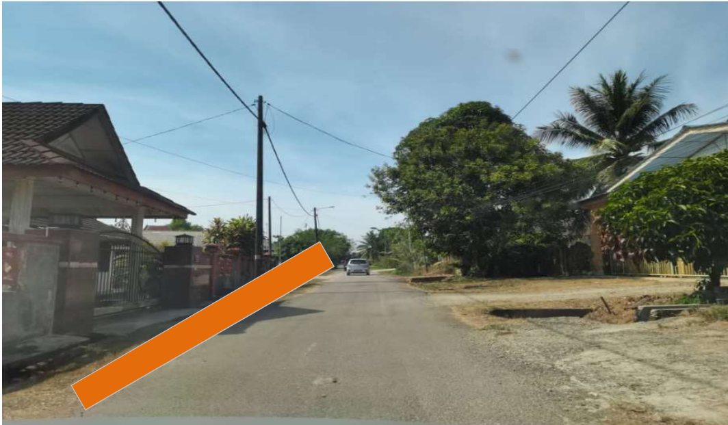
KAWASAN KERJA MELIBATKAN OPEN CUT DI ATAS TANAH BIASA