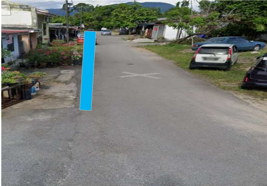
KAWASAN KERJA MELIBATKAN OPEN CUT DI ATAS JALAN TAR