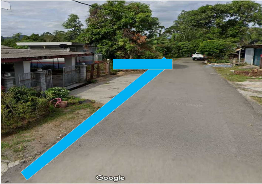
KAWASAN KERJA MELIBATKAN OPEN CUT DI ATAS JALAN TAR