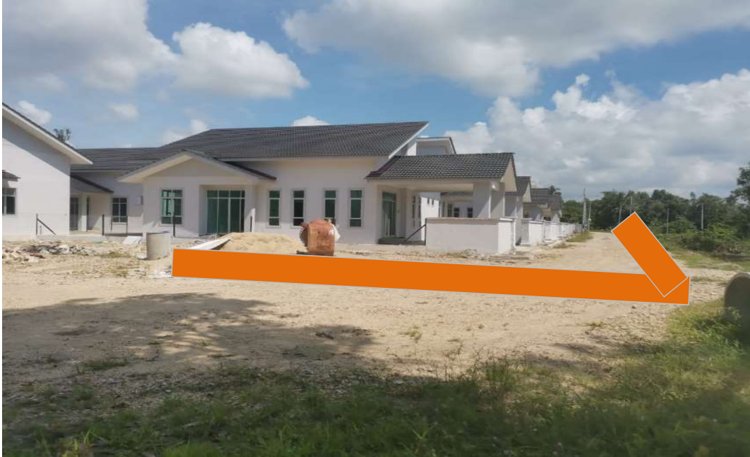
KAWASAN KERJA MELIBATKAN OPEN CUT DI ATAS TANAH BIASA