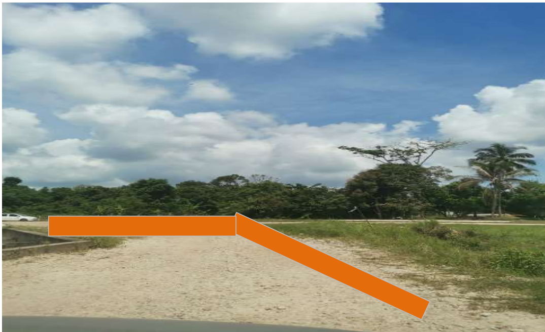
KAWASAN KERJA MELIBATKAN OPEN CUT DI ATAS TANAH BIASA