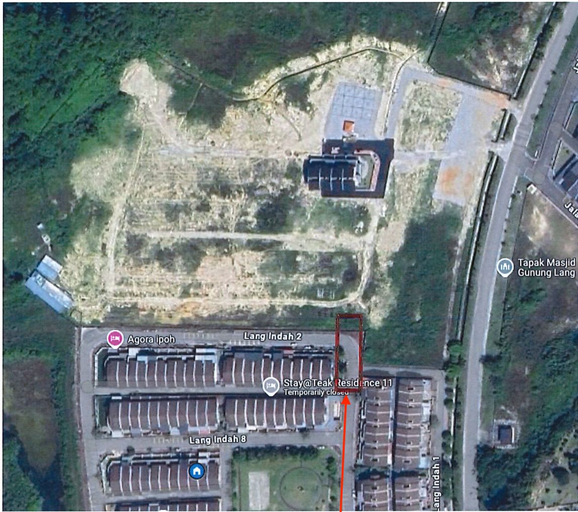
Kawasan yang terlibat bagi pengorekkan jalan