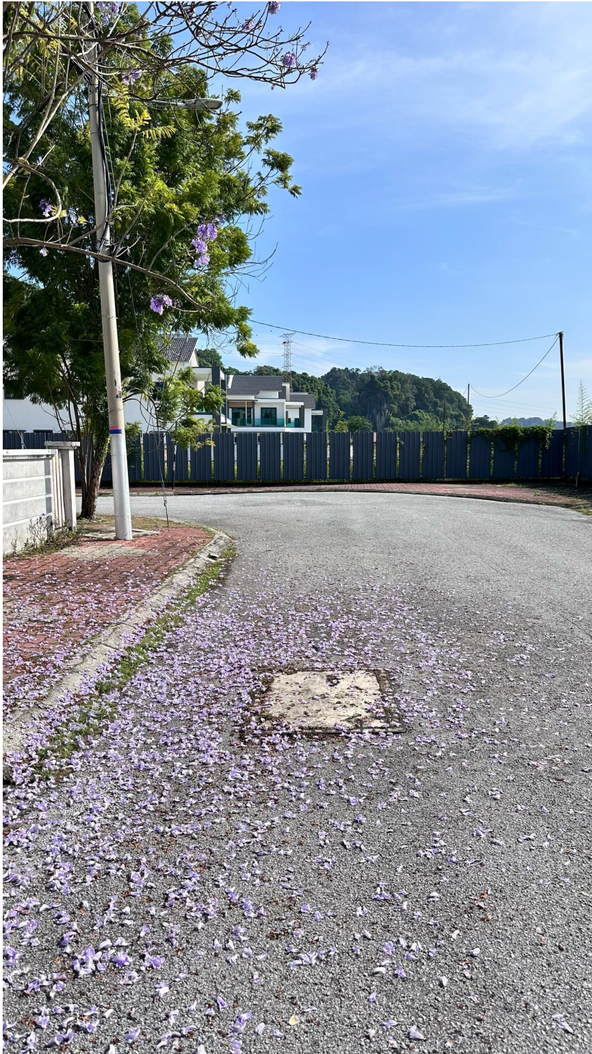
Kawasan kerja melibatkan kerja-kerja pengorekkan bagi pemasangan kabel Telekom