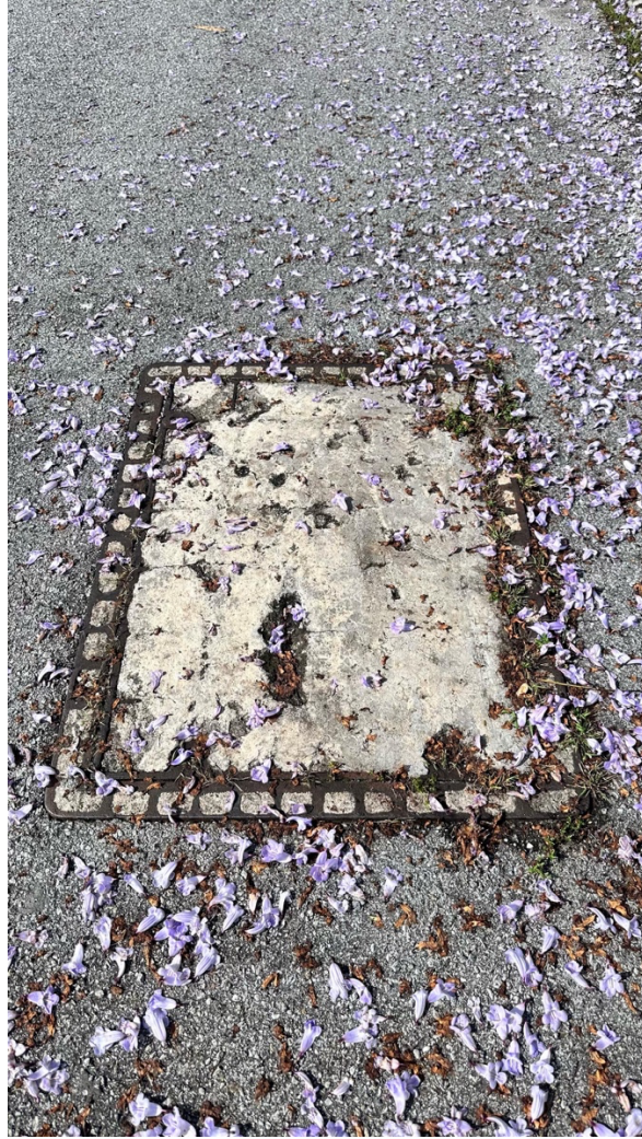
Gambar 1: Manhole telekom sedia ada