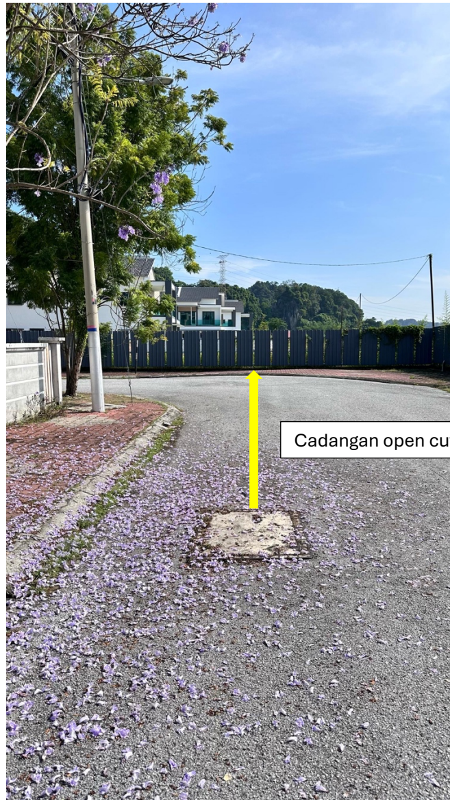
Gambar 2: Kawasan kerja yang melibatkan pemotongan jalan (open cut)