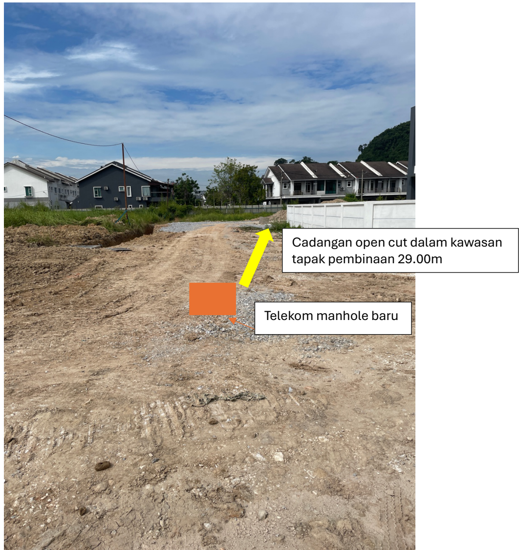
Gambar 4: Kawasan kerja yang melibatkan pemotongan jalan dalam kawasan tapak pembinaan (open cut)