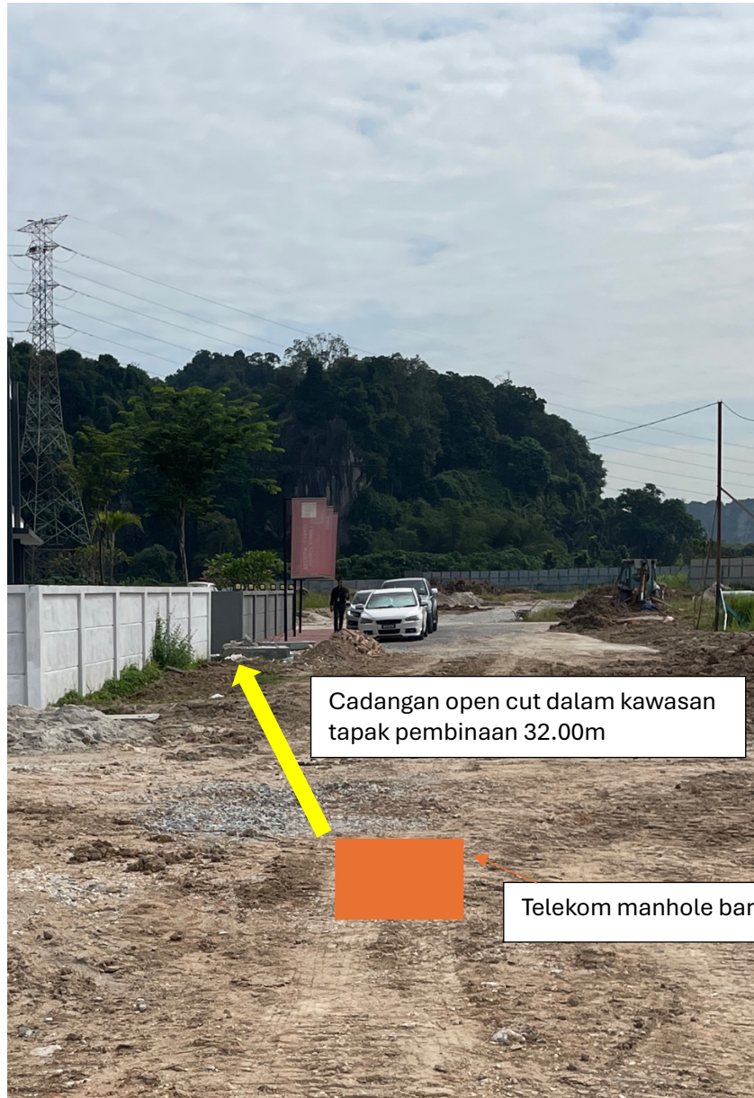
Gambar 5: Kawasan kerja yang melibatkan pemotongan jalan dalam kawasan tapak pembinaan (open cut)