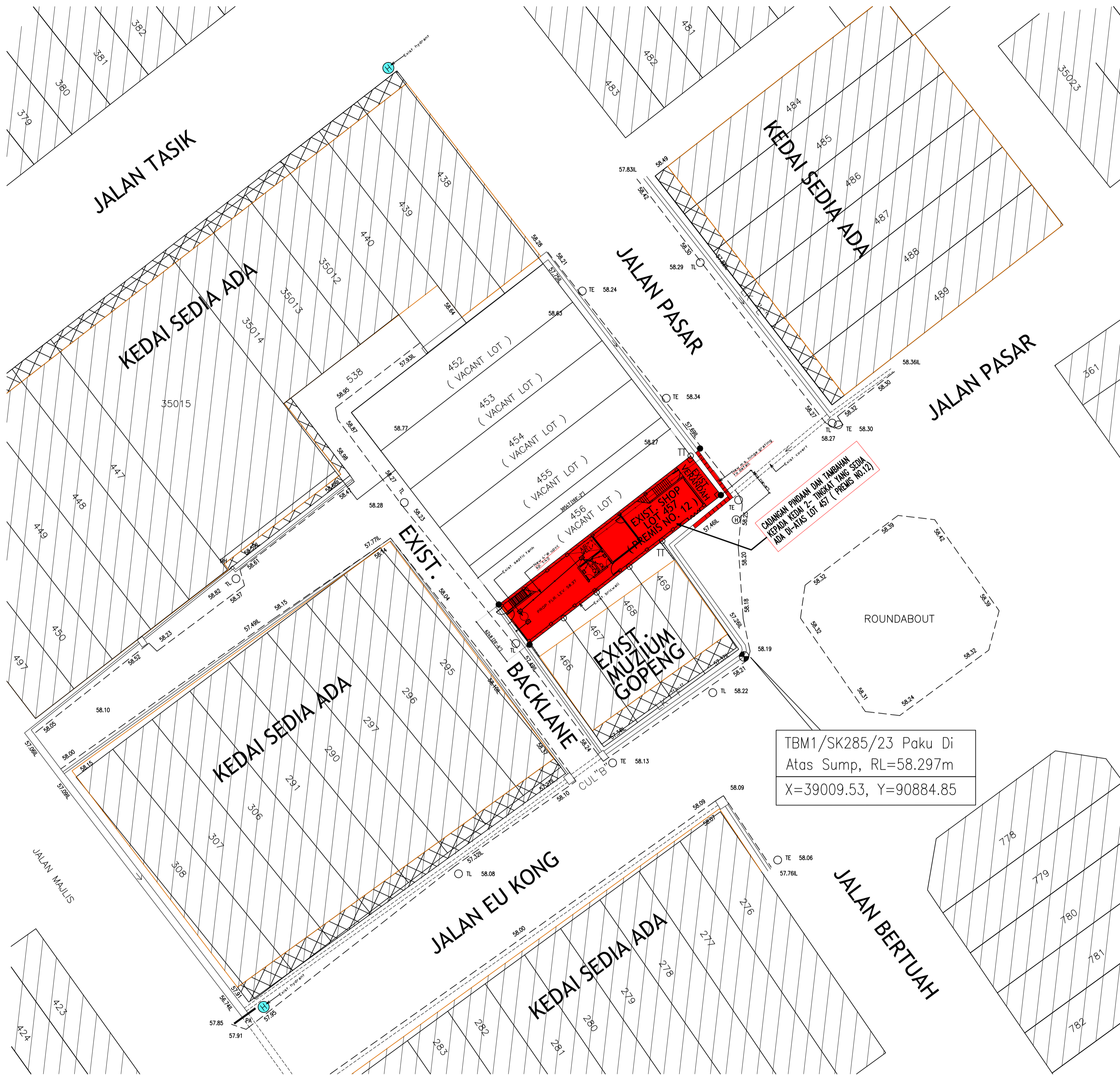
PELAN TAPAK SKALA 1 : 750 BANDAR GOPENG DAERAH KAMPAR, SYIT PIWAI : 681