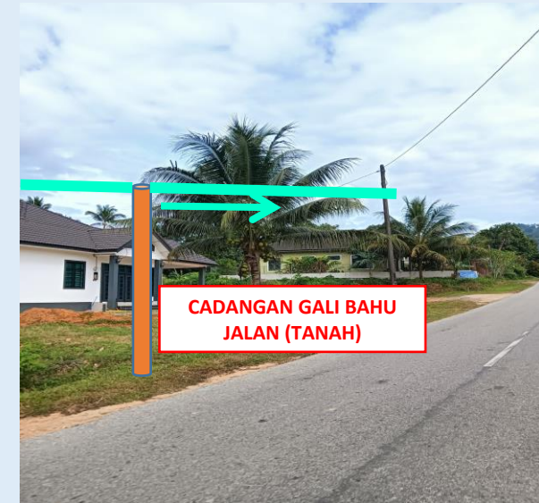
GAMBAR 16 : KAWASAN KERJA MELIBATKAN TANAM TIANG 9M (BERTANAH)