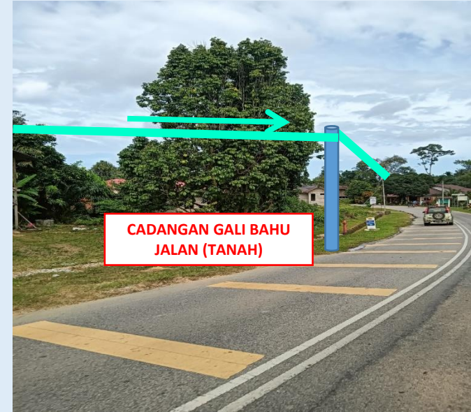
GAMBAR 10 : KAWASAN KERJA MELIBATKAN TANAM TIANG 7.5M (BERTANAH)