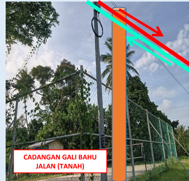
GAMBAR 14 : KAWASAN KERJA MELIBATKAN TANAM TIANG 9M (BERTANAH)