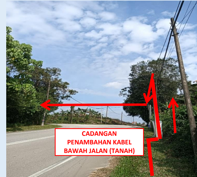
GAMBAR 4 : KAWASAN KERJA MELIBATKAN PENAMBAHAN KABEL (BERTANAH)