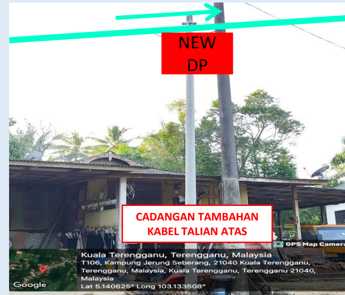
GAMBAR 20 : KAWASAN KERJA MELIBATKAN PENAMBAHAN KABEL TALIAN ATAS