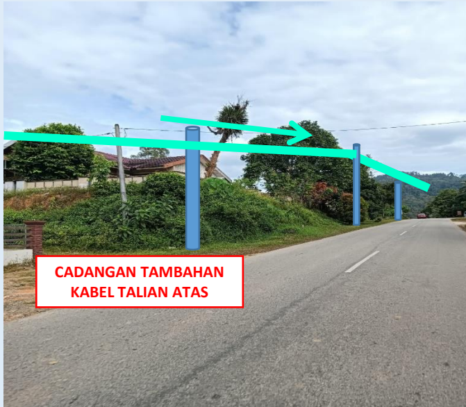
GAMBAR 17 : KAWASAN KERJA MELIBATKAN PENAMBAHAN KABEL TALIAN ATAS