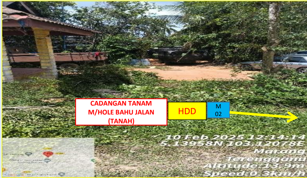
GAMBAR 2 : KAWASAN KERJA MELIBATKAN GALI DAN TANAM BAHU JALAN (BERTANAH)