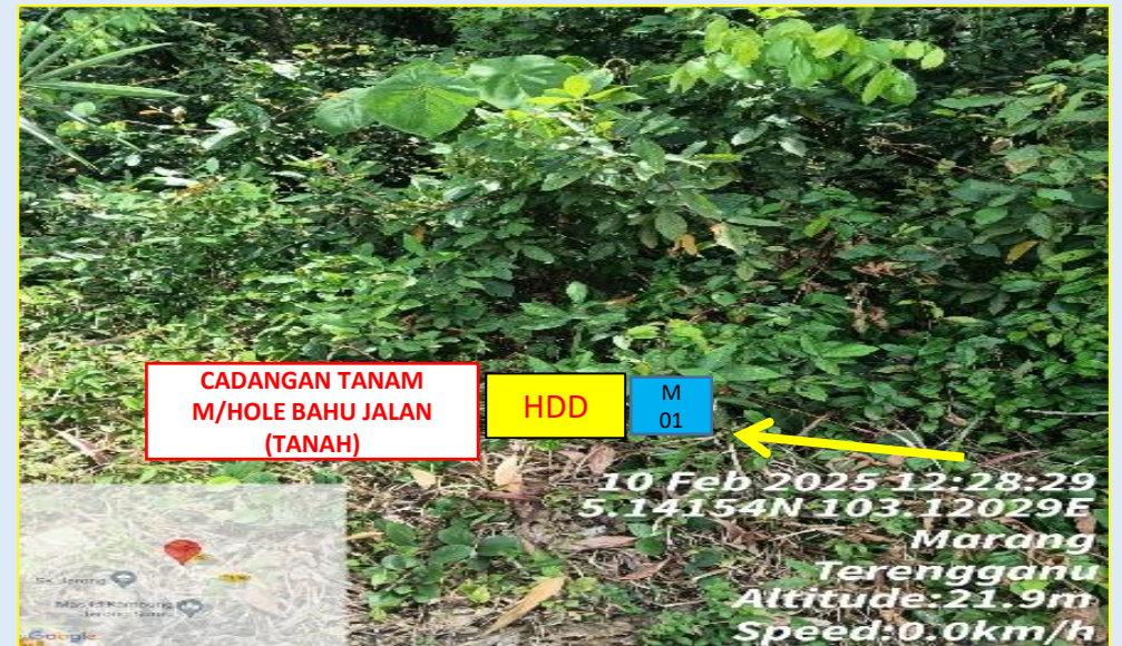
GAMBAR 1 : KAWASAN KERJA MELIBATKAN GALI DAN TANAM BAHU JALAN (BERTANAH)