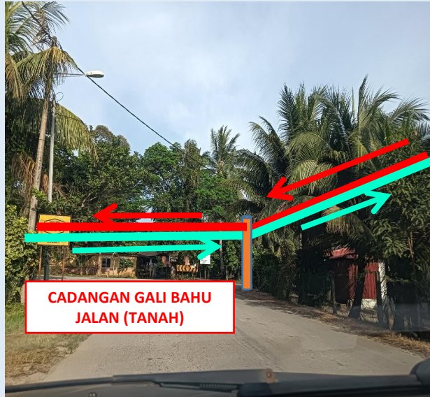
GAMBAR 13 : KAWASAN KERJA MELIBATKAN TANAM TIANG 9M (BERTANAH)