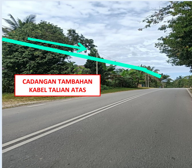
GAMBAR 19 : KAWASAN KERJA MELIBATKAN PENAMBAHAN KABEL TALIAN ATAS