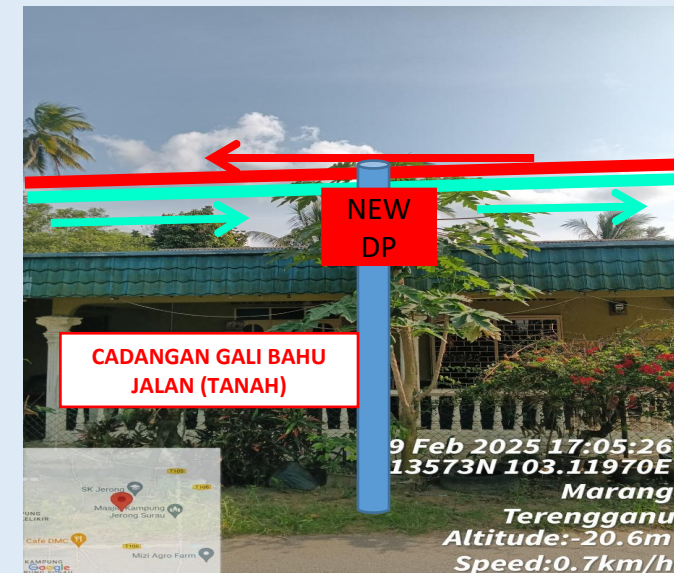
GAMBAR 12 : KAWASAN KERJA MELIBATKAN TANAM TIANG 7.5M (BERTANAH)