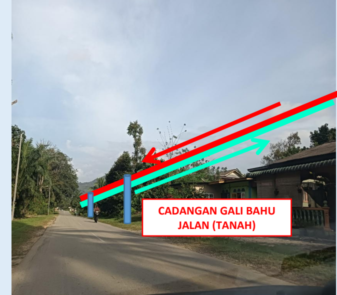
GAMBAR 6 : KAWASAN KERJA MELIBATKAN TANAM TIANG 7.5M (BERTANAH)