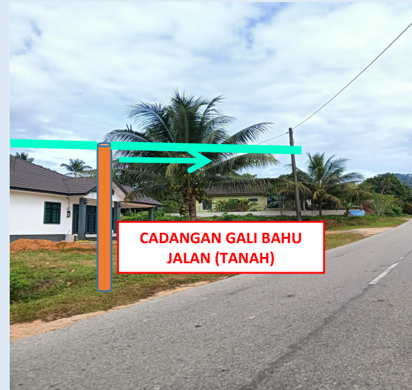
GAMBAR 16 : KAWASAN KERJA MELIBATKAN TANAM TIANG 9M (BERTANAH)