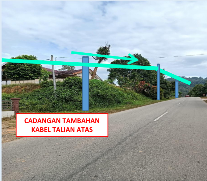
GAMBAR 17 : KAWASAN KERJA MELIBATKAN PENAMBAHAN KABEL TALIAN ATAS