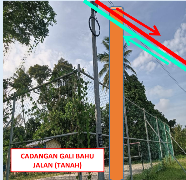
GAMBAR 14 : KAWASAN KERJA MELIBATKAN TANAM TIANG 9M (BERTANAH)