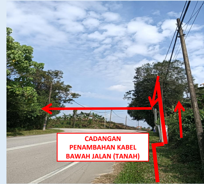
GAMBAR 4 : KAWASAN KERJA MELIBATKAN PENAMBAHAN KABEL (BERTANAH)