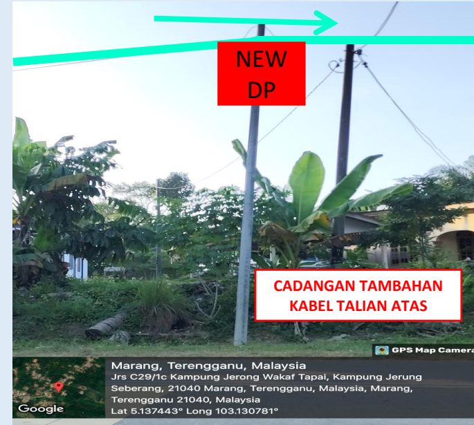
GAMBAR 18 : KAWASAN KERJA MELIBATKAN PENAMBAHAN KABEL TALIAN ATAS