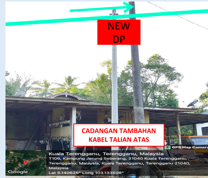
GAMBAR 20 : KAWASAN KERJA MELIBATKAN PENAMBAHAN KABEL TALIAN ATAS