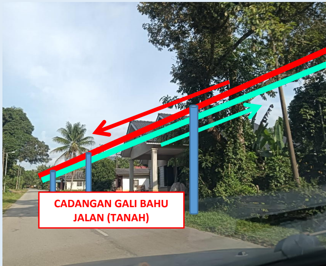
GAMBAR 11 : KAWASAN KERJA MELIBATKAN TANAM TIANG 7.5M (BERTANAH)