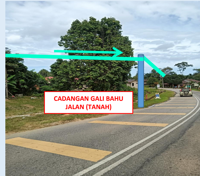
GAMBAR 10 : KAWASAN KERJA MELIBATKAN TANAM TIANG 7.5M (BERTANAH)