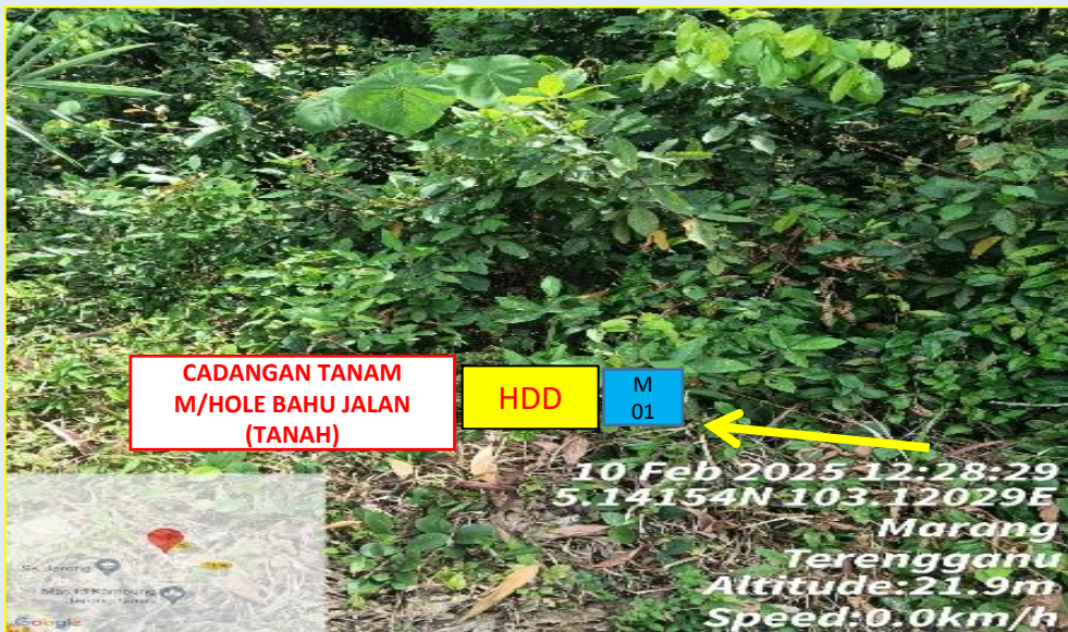
GAMBAR 1 : KAWASAN KERJA MELIBATKAN GALI DAN TANAM BAHU JALAN (BERTANAH)