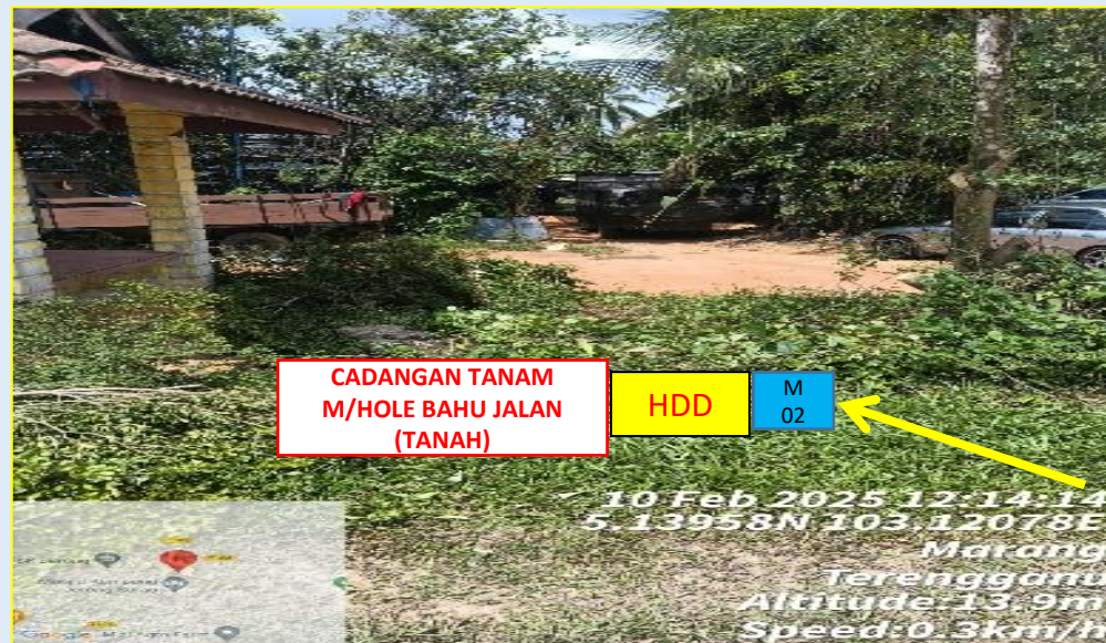
GAMBAR 2 : KAWASAN KERJA MELIBATKAN GALI DAN TANAM BAHU JALAN (BERTANAH)