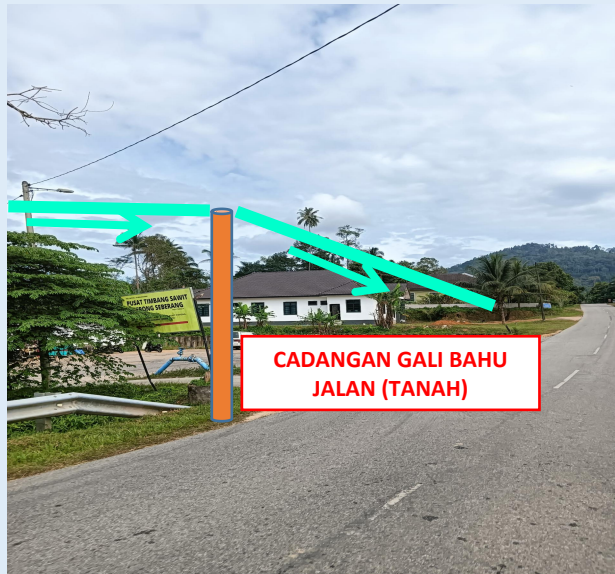
GAMBAR 15 : KAWASAN KERJA MELIBATKAN TANAM TIANG 9M (BERTANAH)