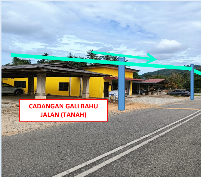
GAMBAR 9 : KAWASAN KERJA MELIBATKAN TANAM TIANG 7.5M (BERTANAH)