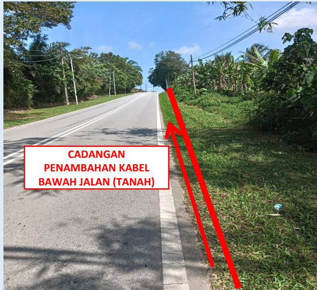
GAMBAR 3 : KAWASAN KERJA MELIBATKAN PENAMBAHAN KABEL (BERTANAH)