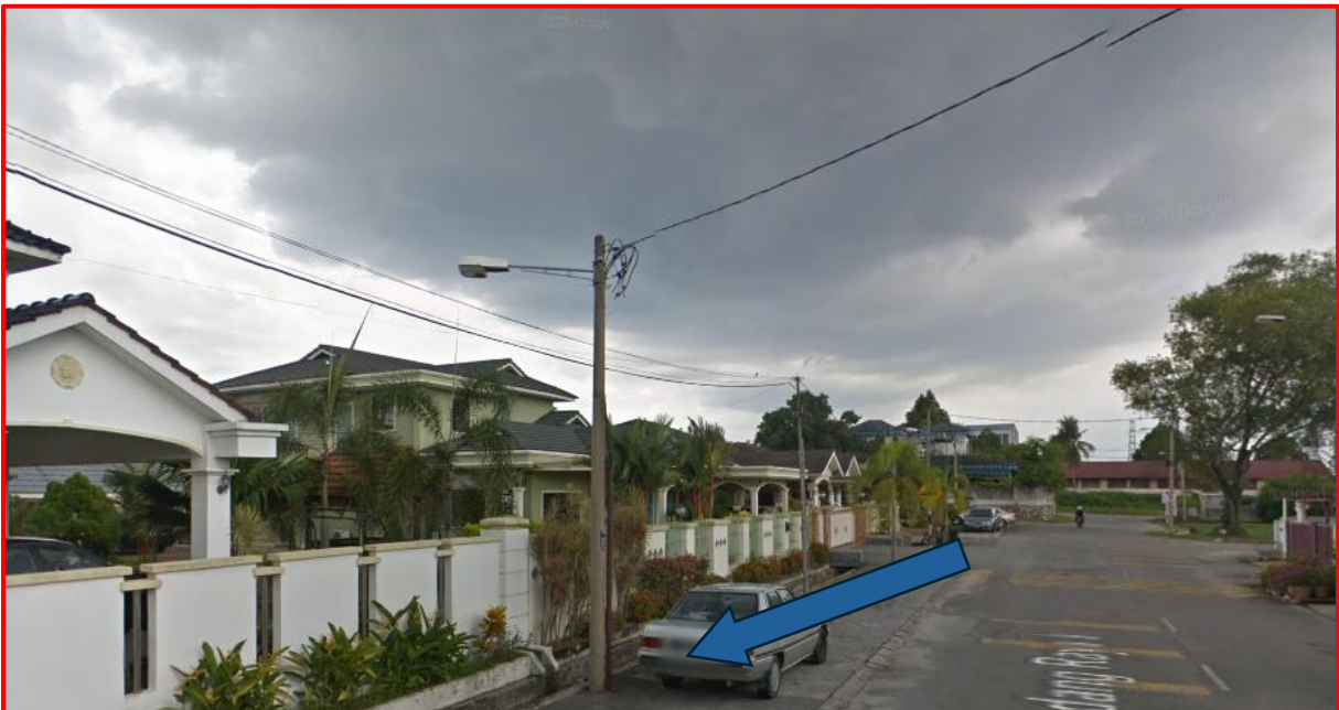
Gambar 4: Kawasan jalan melibatkan pemotongan ke tiang rumah pengguna