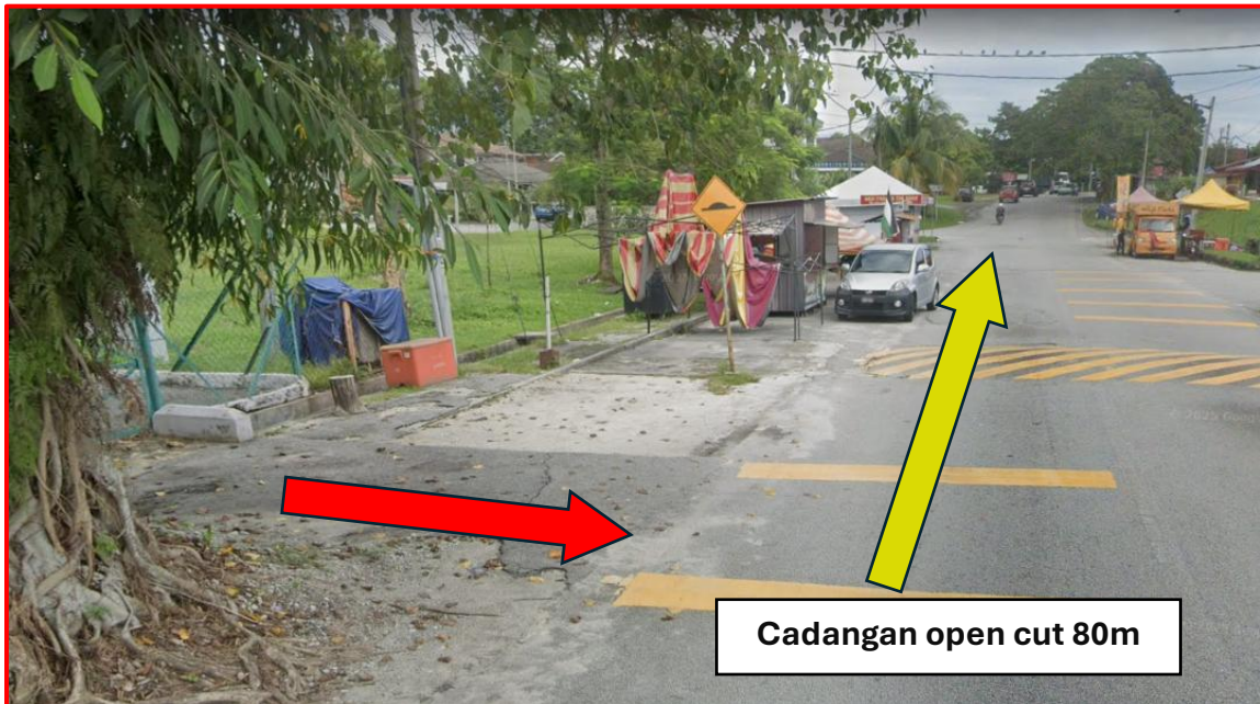
Gambar 2: Kawasan jalan melibatkan pemotongan