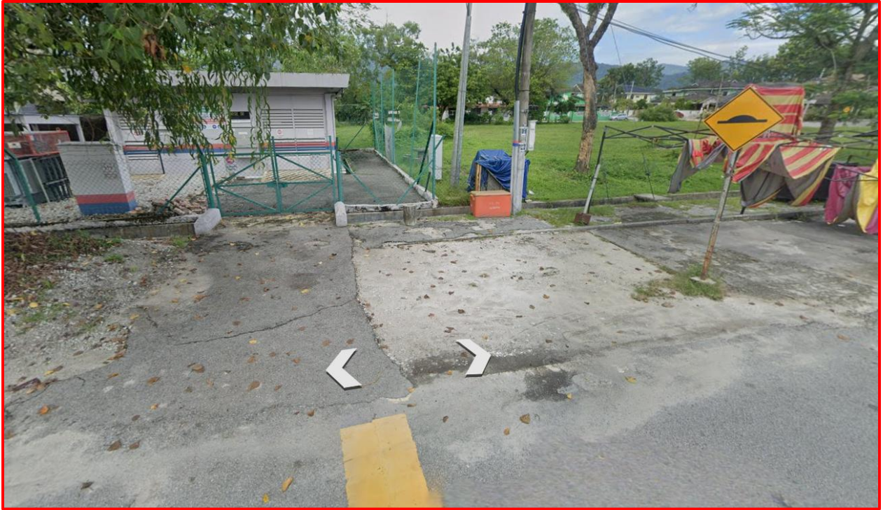
Gambar 1: Pencawang sedia ada (Pencawang Taman Malkof 2)