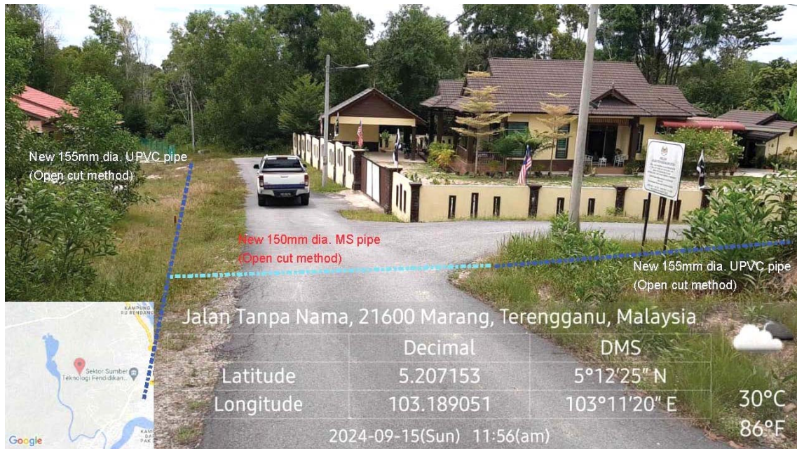
GAMBAR 4 : Kawasan cadangan laluan paip baru pada laluan jalan.