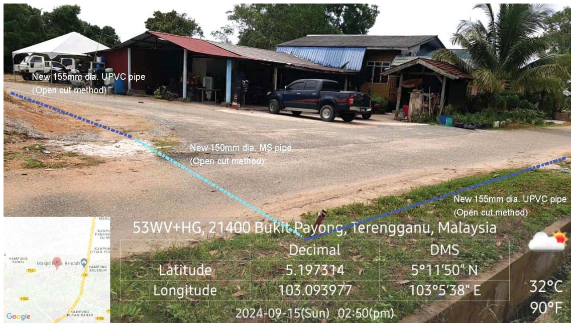
GAMBAR 2 : Kawasan cadangan laluan paip baru pada laluan tepi jalan.