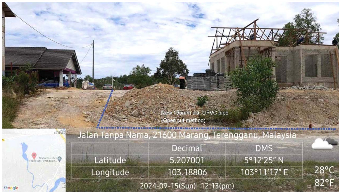
GAMBAR 5 : Kawasan cadangan laluan paip baru pada laluan tepi jalan.