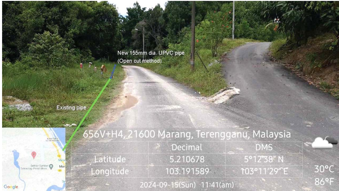
GAMBAR 1 : Kawasan cadangan laluan paip baru dan sambungan ke paip sedia ada.