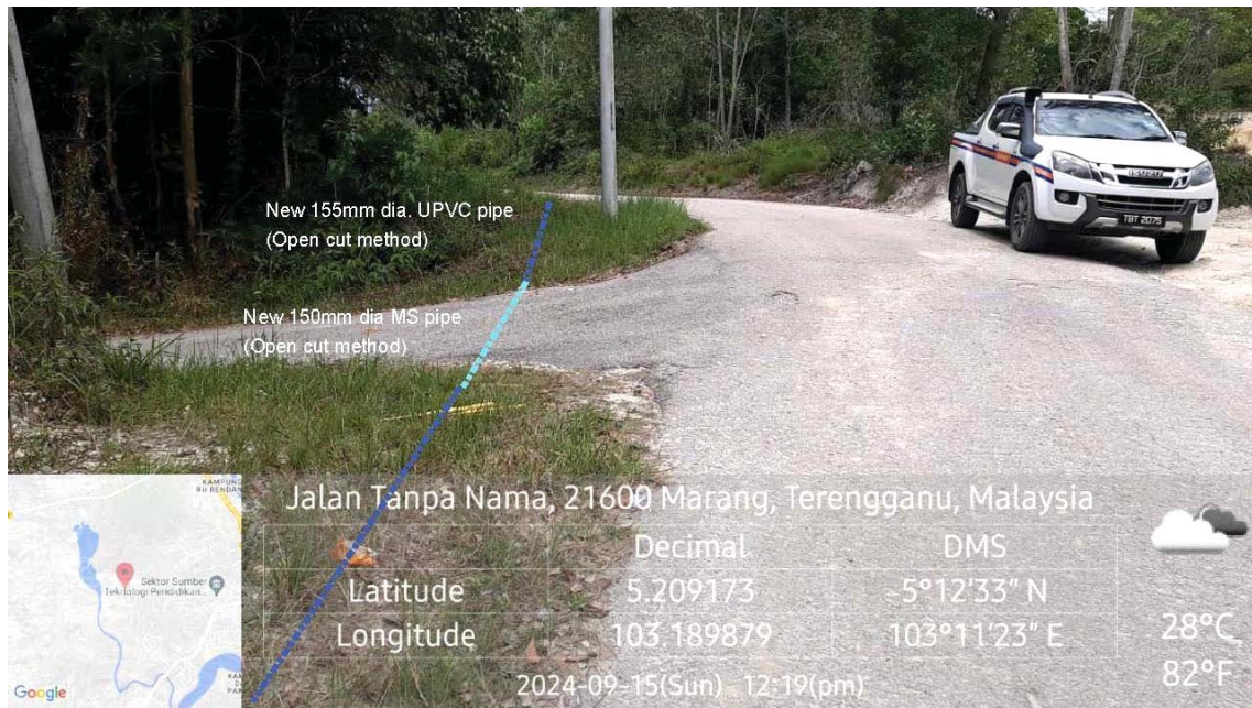
GAMBAR 3 : Kawasan cadangan laluan paip baru pada laluan tepi jalan.