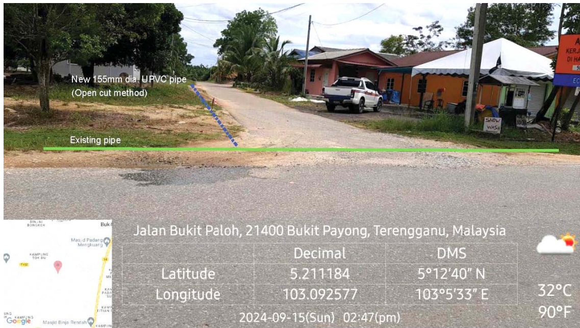
GAMBAR 1 : Kawasan cadangan laluan paip baru dan sambungan ke paip sedia ada.