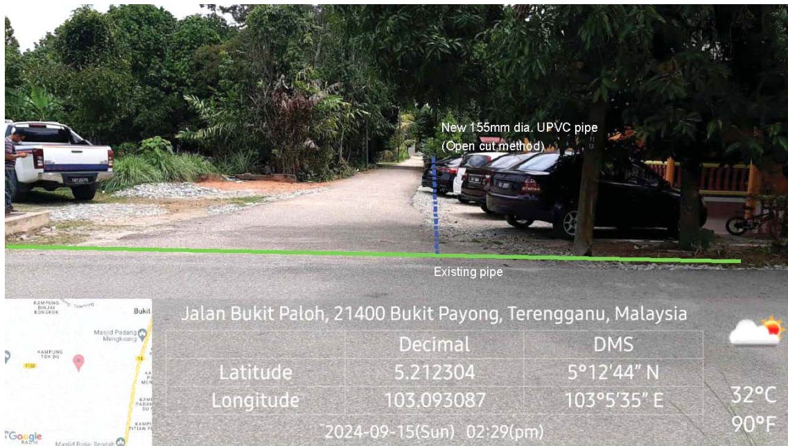
GAMBAR 1 : Kawasan cadangan laluan paip baru dan sambungan ke paip sedia ada.