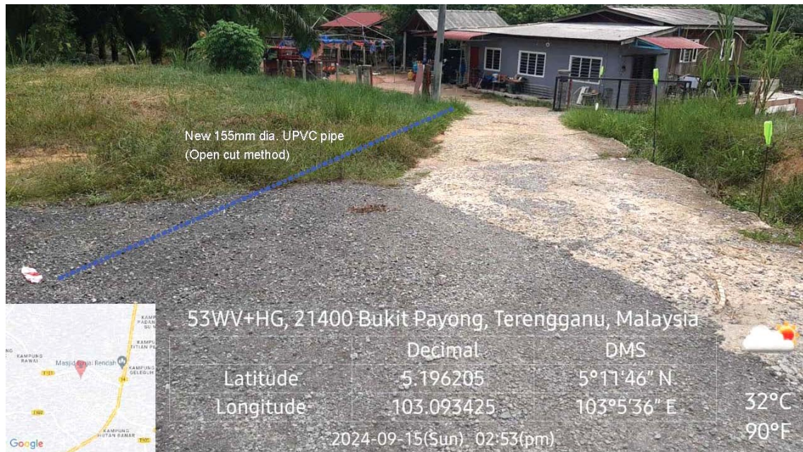
GAMBAR 3 : Kawasan cadangan laluan paip baru pada laluan tepi jalan.