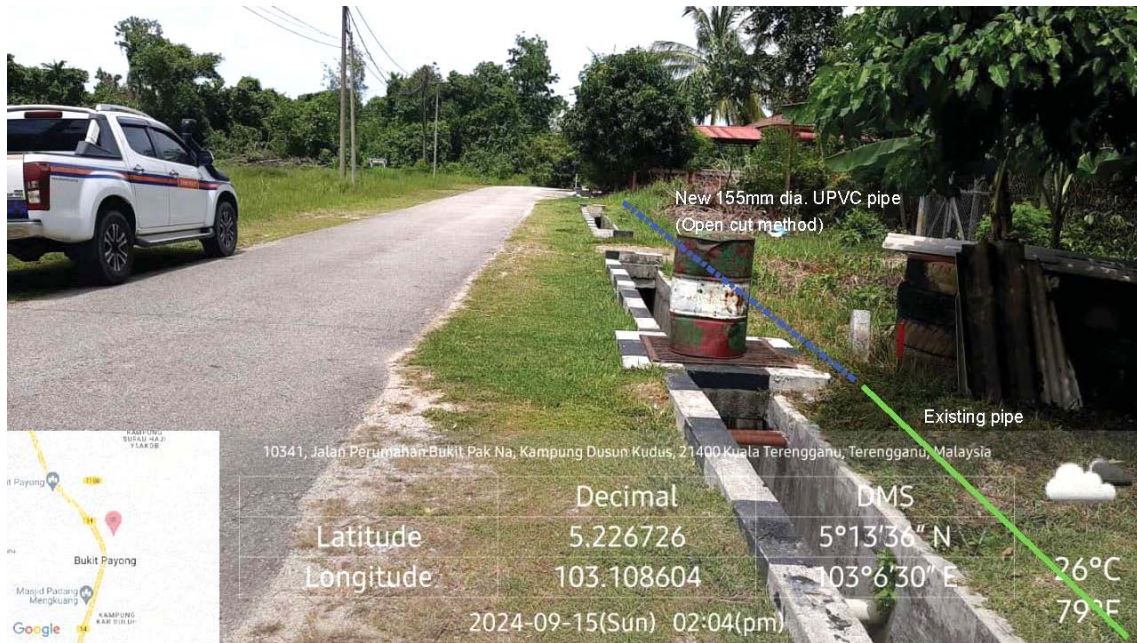
GAMBAR 1 : Kawasan cadangan laluan paip baru dan sambungan ke paip sedia ada.