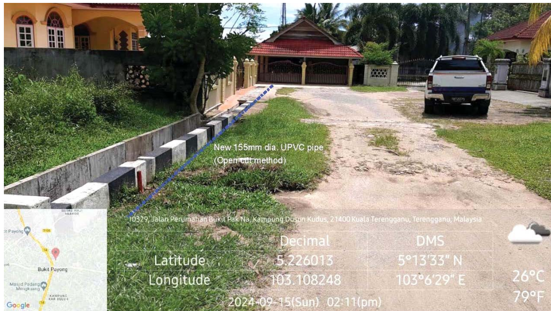
GAMBAR 3 : Kawasan cadangan laluan paip baru pada laluan tepi jalan.