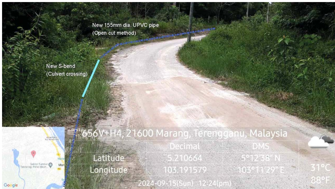
GAMBAR 2 : Kawasan cadangan laluan paip baru pada laluan tepi jalan.