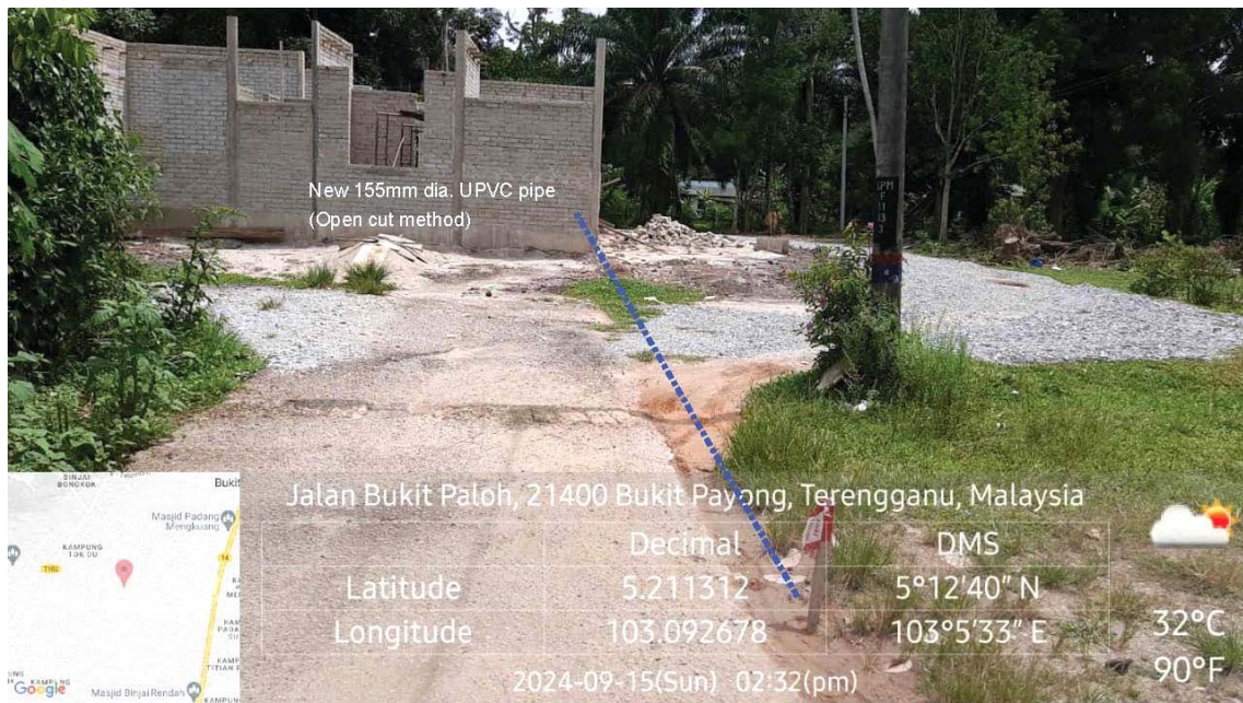
GAMBAR 2 : Kawasan cadangan laluan paip baru pada laluan tepi jalan.