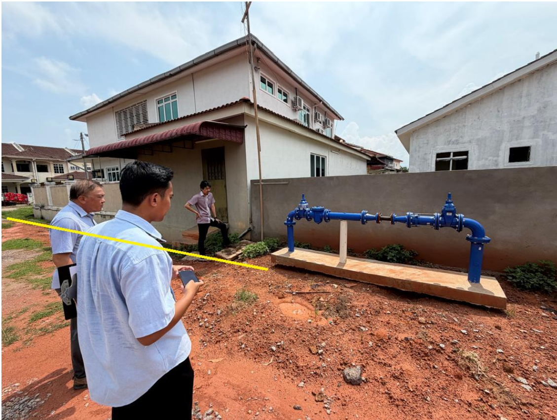
Gambar 2: Jarak Sambungan Ke Paip Bekalan Air Sedia Ada