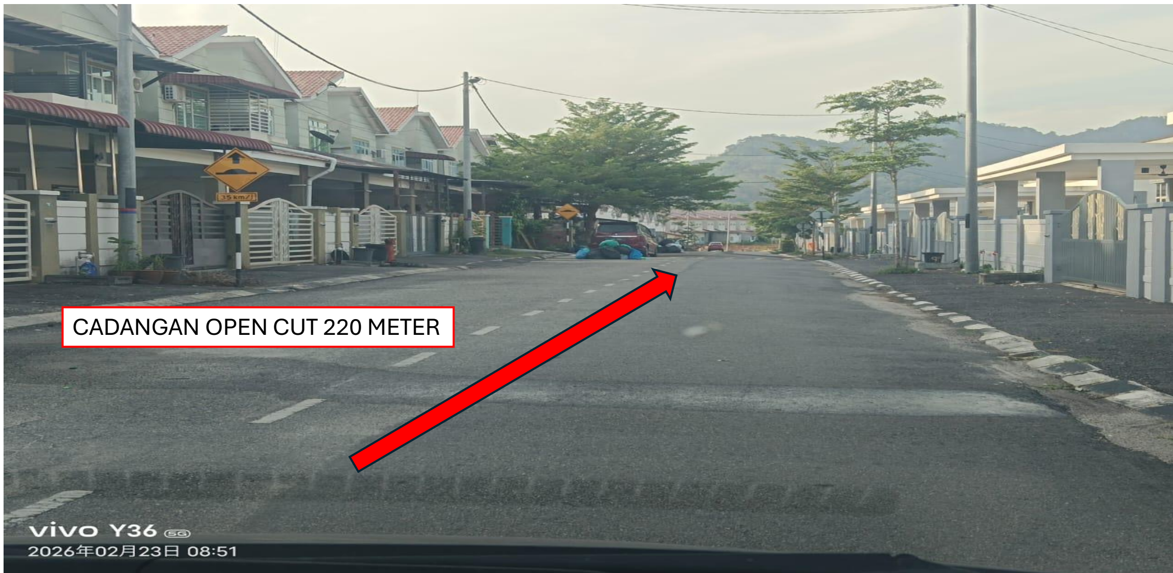
GAMBAR 5: KAWASAN KERJA MELIBATKAN PEMOTONGAN JALAN (OPEN CUT)