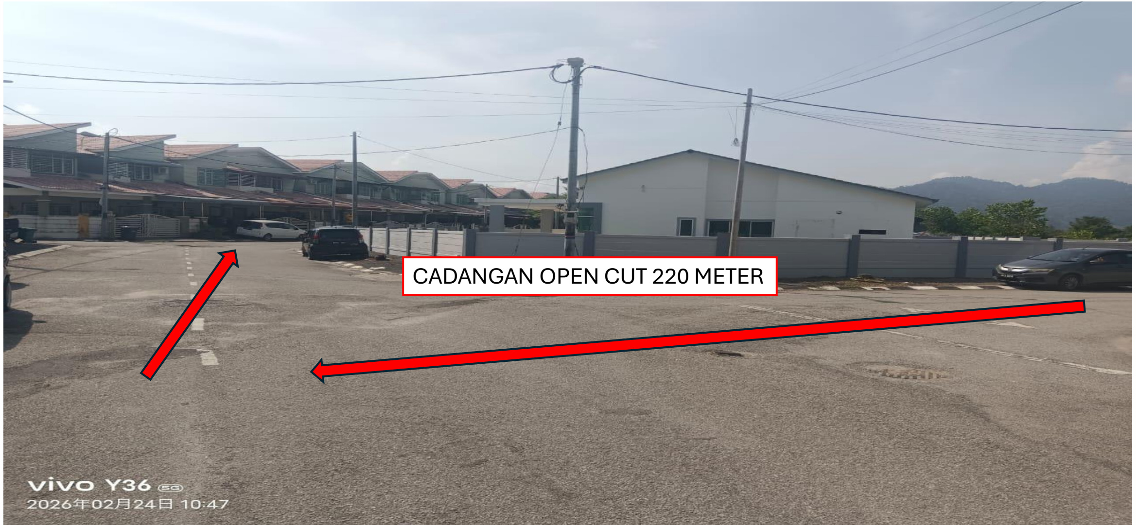
GAMBAR 4 : KAWASAN KERJA MELIBATKAN PEMOTONGAN JALAN (OPEN CUT)