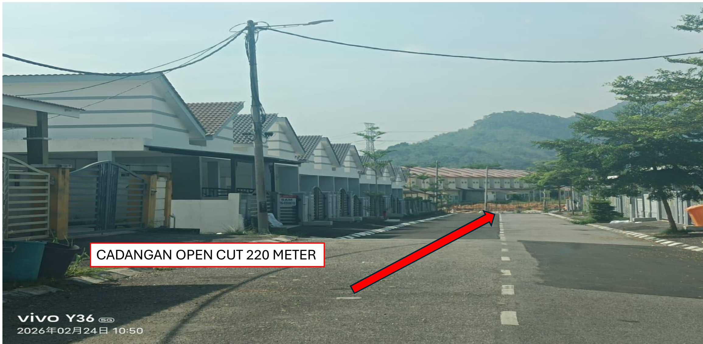
GAMBAR 6 : KAWASAN KERJA MELIBATKAN PEMOTONGAN JALAN (OPEN CUT)