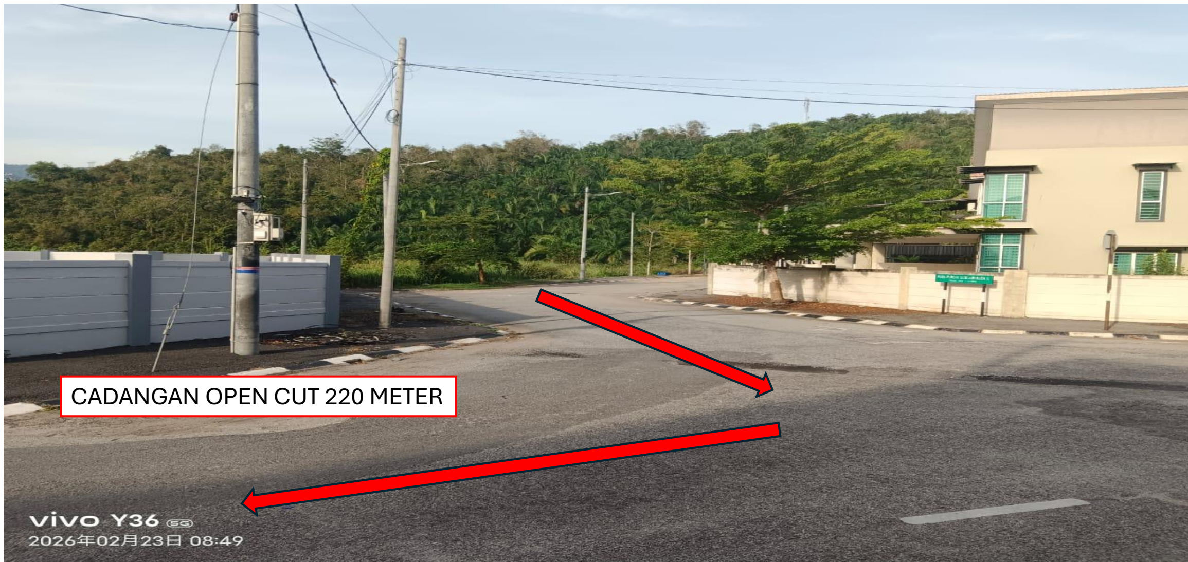
GAMBAR 3 : KAWASAN KERJA MELIBATKAN PEMOTONGAN JALAN (OPEN CUT)