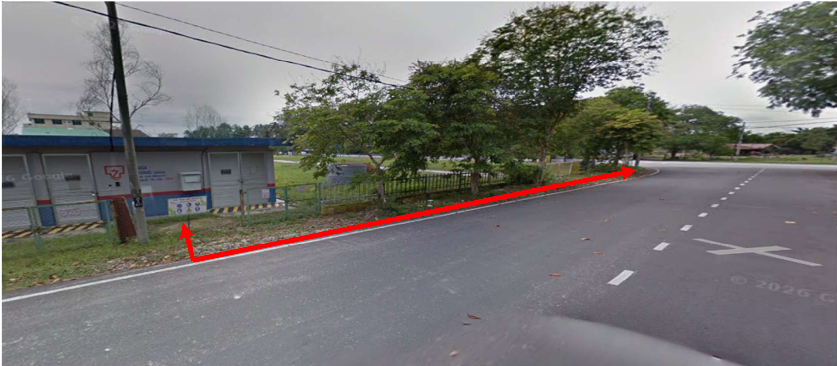
PE TAN LAN INDUSTRI-KAEDAH OPEN CUT