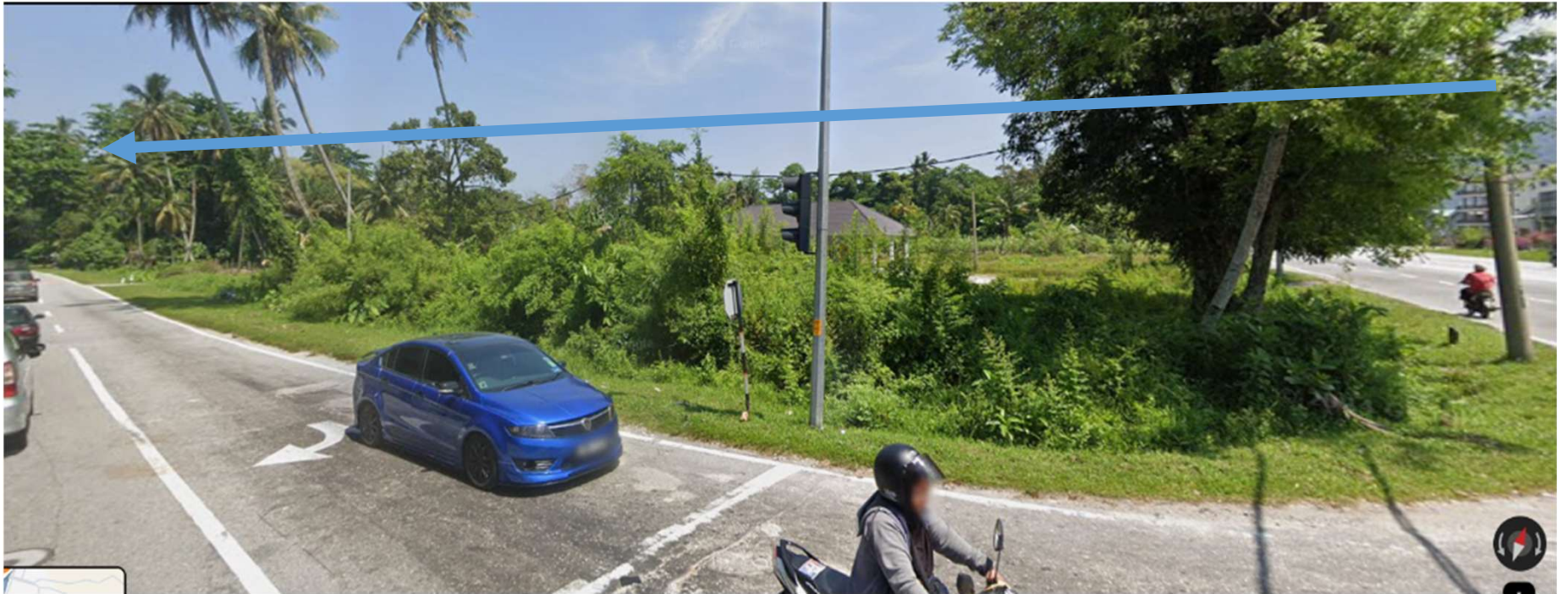
JALAN JKR A180-KAEDAH PENANAMAN TIANG BARU( JARAK SELAAN SETIAP 25M)