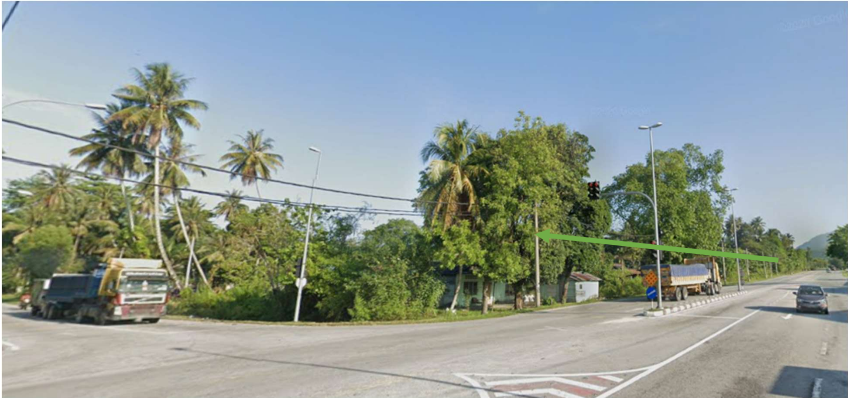
JALAN IPOH KAMPAR 70-KAEDAH TUMPANG TIANG SEHINGGA KE TIANG 13K5/170