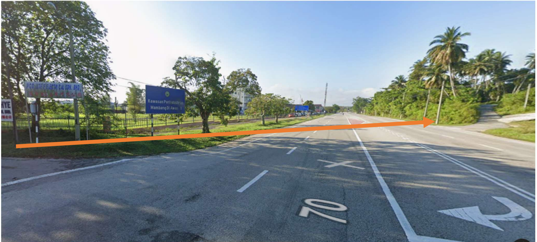
JALAN IPOH KAMPAR 70-KAEDAH HDD KE TIANG 13K5/160