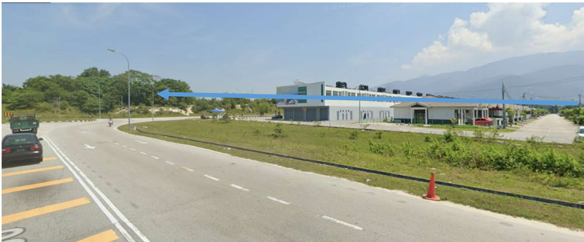
JALAN JKR A180-KAEDAH PENANAMAN TIANG BARU( JARAK SELAAN SETIAP 25M)