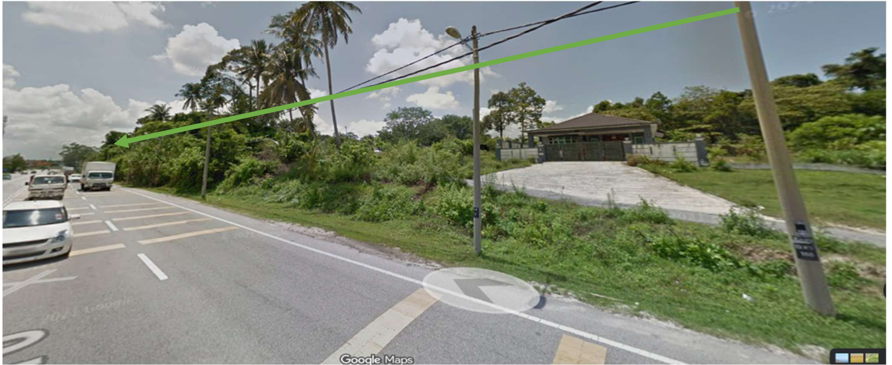
JALAN IPOH KAMPAR 70-KAEDAH TUMPANG TIANG SEHINGGA KE TIANG 13K5/170