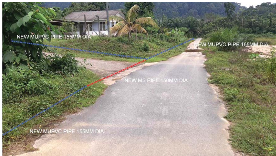
GAMBAR 4 : Kawasan cadangan laluan paip baru pada laluan tepi jalan.