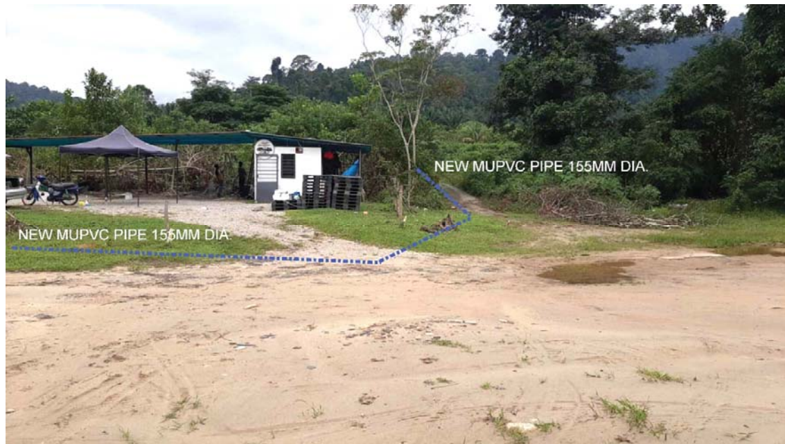
GAMBAR 7 : Kawasan cadangan laluan paip baru pada laluan tepi jalan.