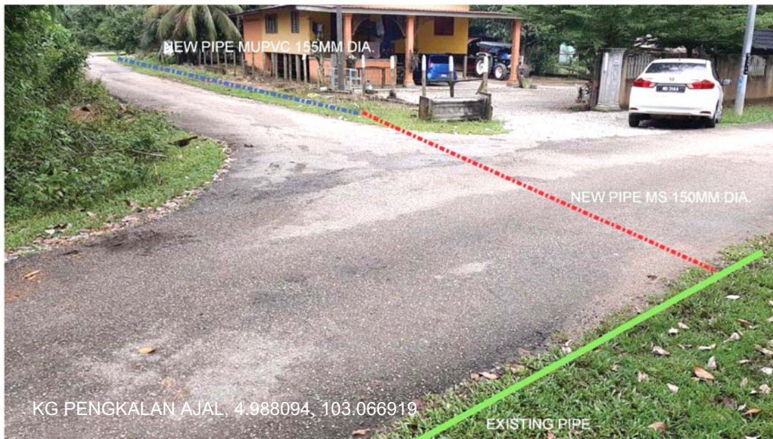
GAMBAR 1 : Kawasan cadangan laluan paip baru dan sambungan ke paip sedia ada.