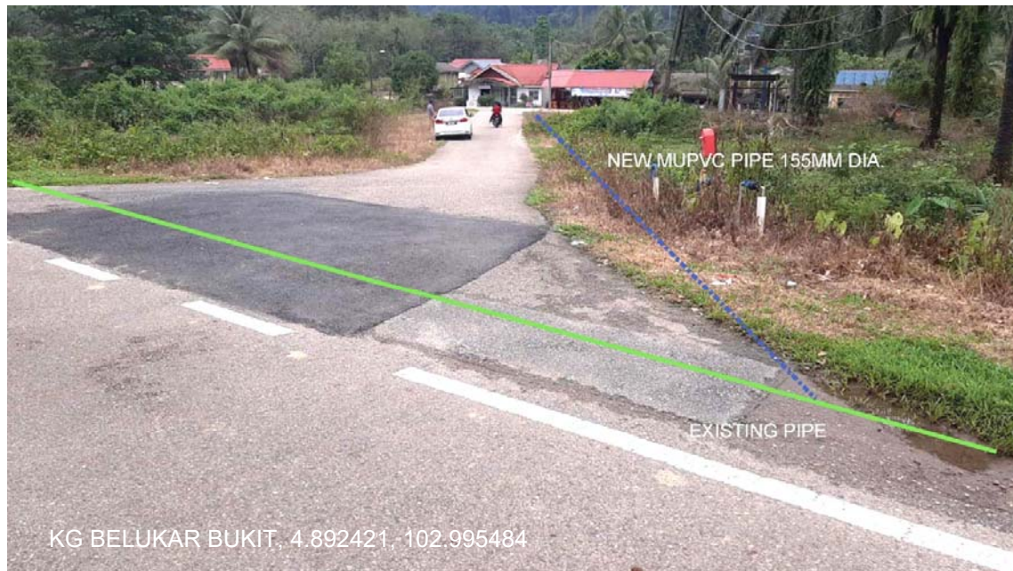
GAMBAR 1 : Kawasan cadangan laluan paip baru dan sambungan ke paip sedia ada.