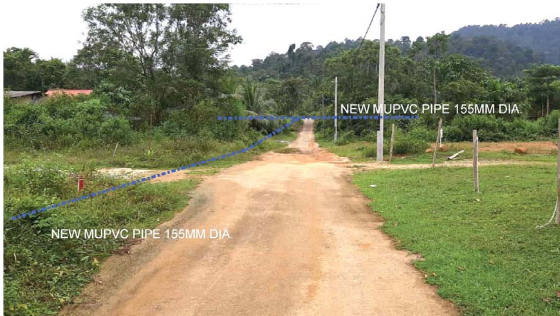
GAMBAR 6 : Kawasan cadangan laluan paip baru pada laluan tepi jalan.