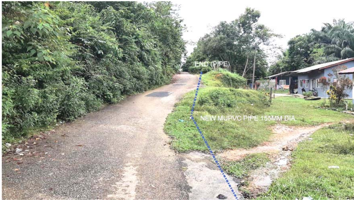
GAMBAR 3 : Kawasan cadangan laluan paip baru pada laluan tepi jalan.