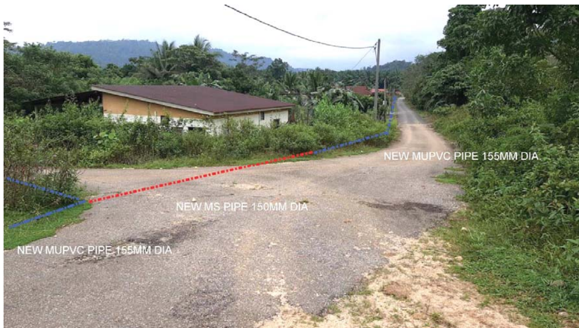
GAMBAR 10 : Kawasan cadangan laluan paip baru pada laluan tepi jalan.