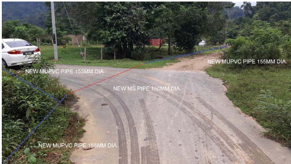
GAMBAR 5 : Kawasan cadangan laluan paip baru pada laluan tepi jalan.