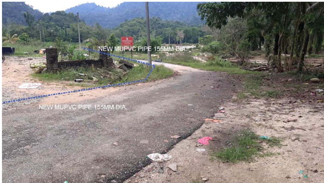
GAMBAR 3 : Kawasan cadangan laluan paip baru pada laluan tepi jalan.