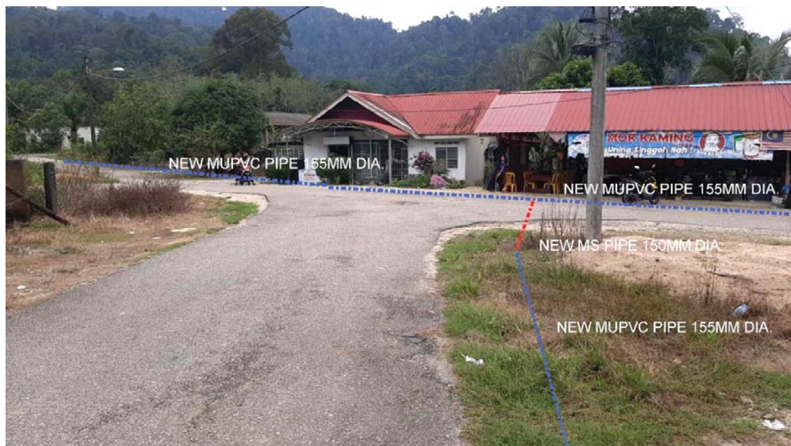
GAMBAR 2 : Kawasan cadangan laluan paip baru pada laluan tepi jalan.