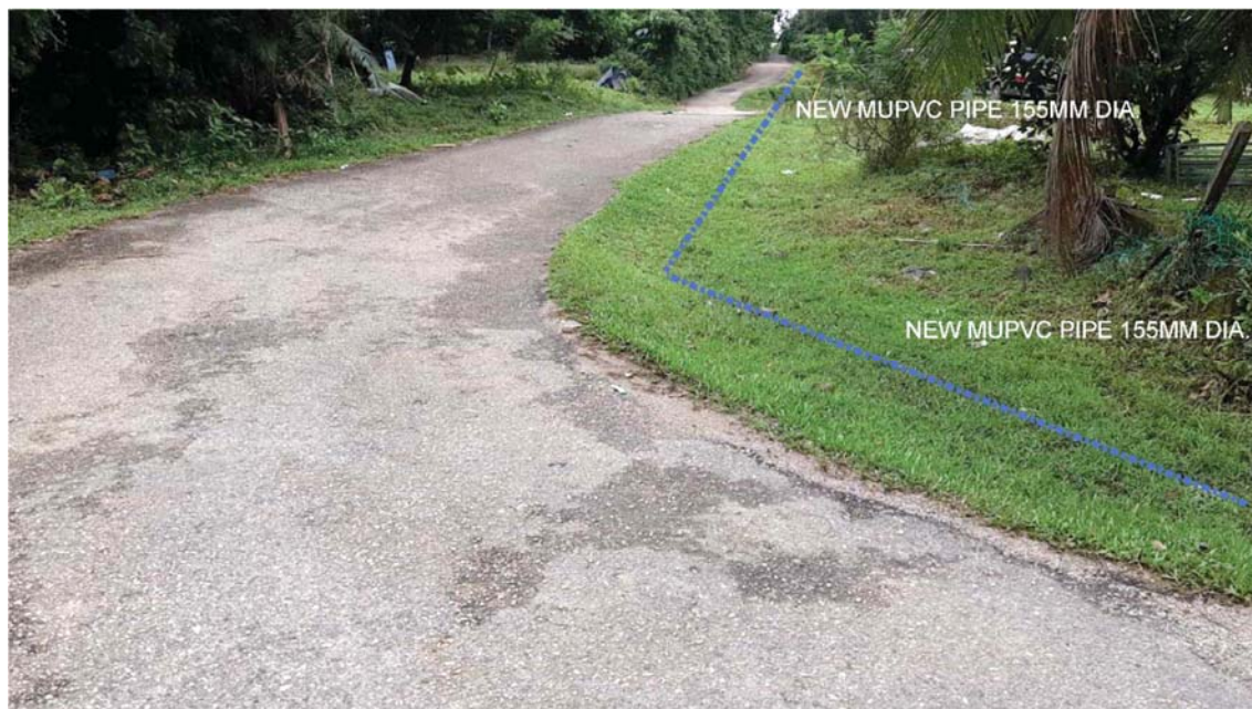
GAMBAR 2 : Kawasan cadangan laluan paip baru pada laluan tepi jalan.