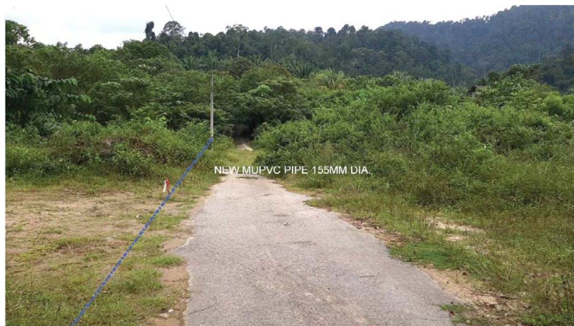
GAMBAR 8 : Kawasan cadangan laluan paip baru pada laluan tepi jalan.