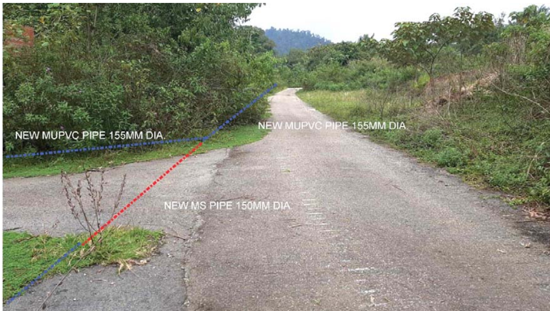
GAMBAR 9 : Kawasan cadangan laluan paip baru pada laluan tepi jalan.