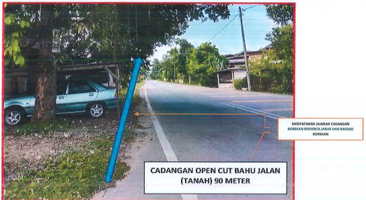
GAMBAR 4 : KAWASAN KERJA MELIBATKAN PEMOTONGAN BAHU JALAN (TIDAK BERTAR)