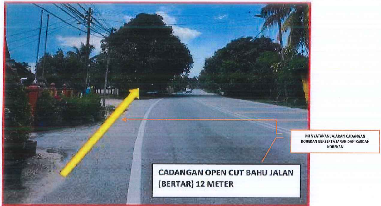
GAMBAR 3 : KAWASAN KERJA MELIBATKAN PEMOTONGAN BAHU JALAN (BERTAR)