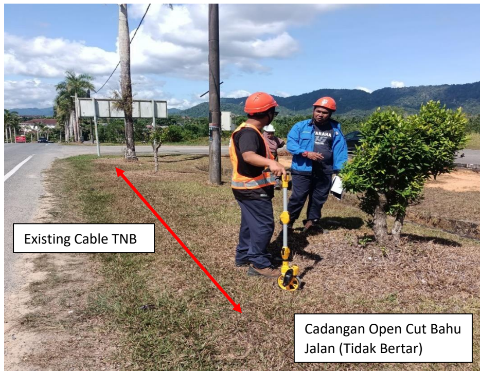
KAWASAN KERJA YANG MELIBATKAN PEMOTONGAN BAHU JALAN (Existing Cable)