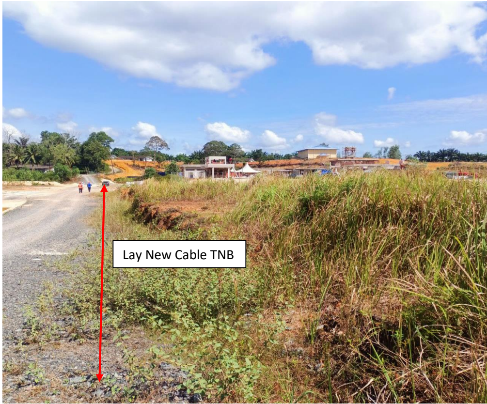
KAWASAN KERJA YANG MELIBATKAN PEMOTONGAN BAHU JALAN TIDAK BERTAR DI KAWASAN TAPAK PROJEK