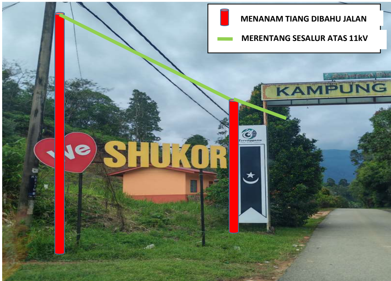
GAMBAR 3 : KAWASAN KERJA MENANAM TIANG 10M(5.0kN) DAN RENTANGAN SAVT.