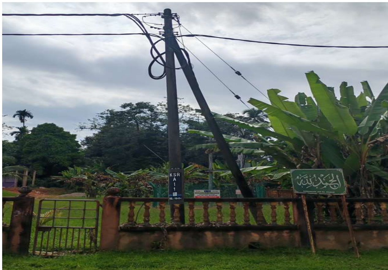
GAMBAR 6 : AKHIR RENTANGAN SAVT KE SEDIADA TIANG 10M(5.0kN). (P/E KG SHUKUR)- AKHIR.