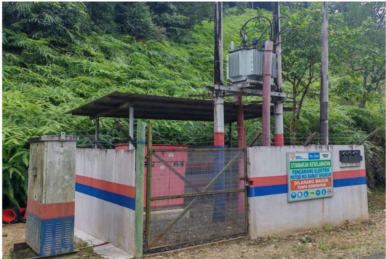
GAMBAR 1 : P/E KG DARAT SHUKUR (PERMULAAN)