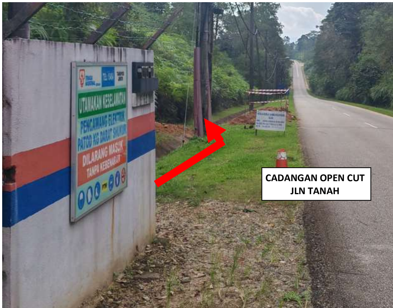
GAMBAR 2 : KAWASAN KERJA MELIBATKAN OPEN CUT JLN TANAH.