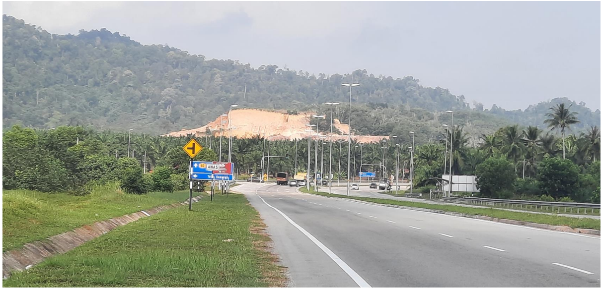
SRKJ (C) Pei Min