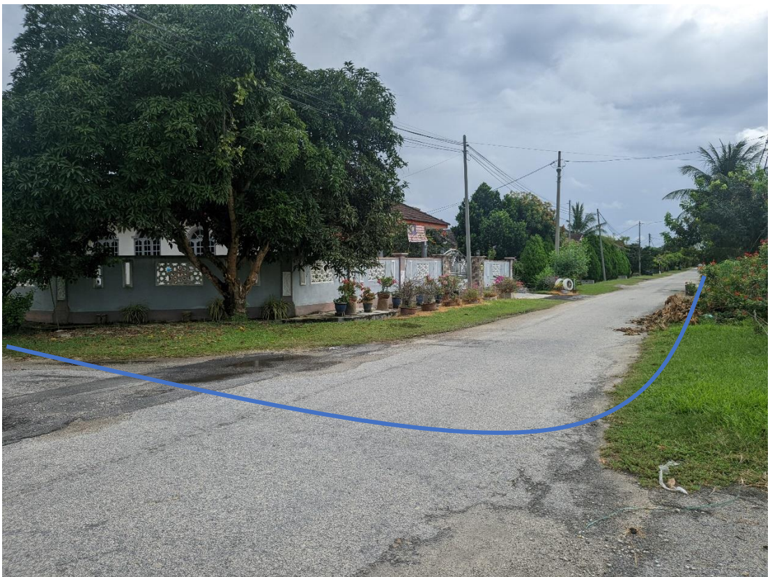
GAMBAR 4: KAWASAN KERJA MELIBATKAN PEMOTONGAN JALAN (OPEN CUT)