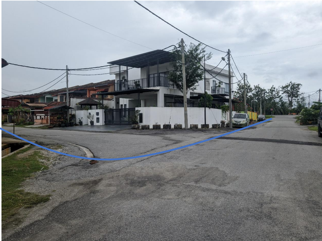
GAMBAR 13: KAWASAN KERJA MELIBATKAN PEMOTONGAN JALAN (OPEN CUT)