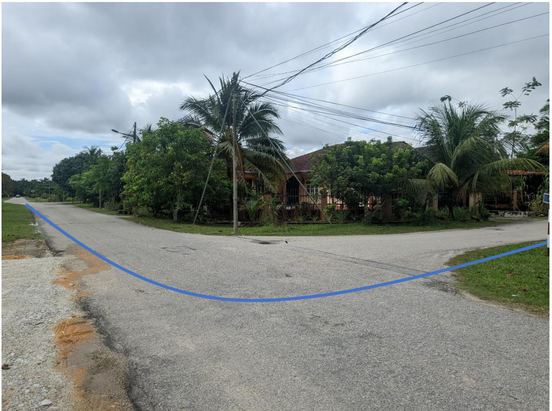
GAMBAR 8: KAWASAN KERJA MELIBATKAN PEMOTONGAN JALAN (OPEN CUT)