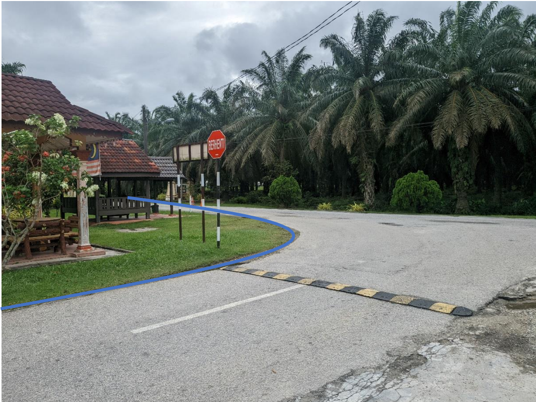
GAMBAR 9: KAWASAN KERJA MELIBATKAN PEMOTONGAN JALAN (OPEN CUT)