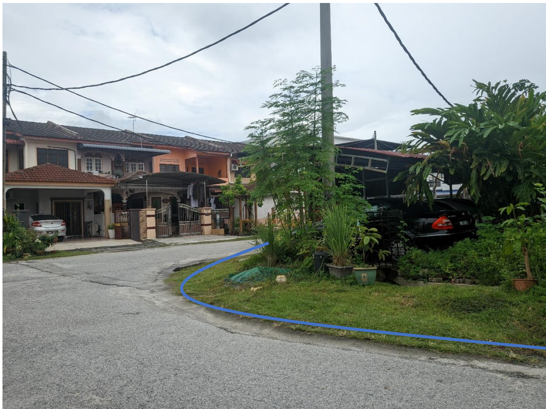
GAMBAR 14: KAWASAN KERJA MELIBATKAN PEMOTONGAN JALAN (OPEN CUT)