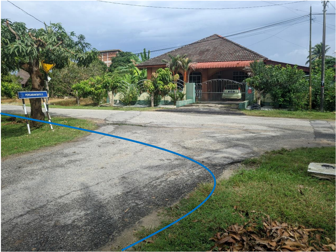
GAMBAR 3: KAWASAN KERJA MELIBATKAN PEMOTONGAN JALAN (OPEN CUT)