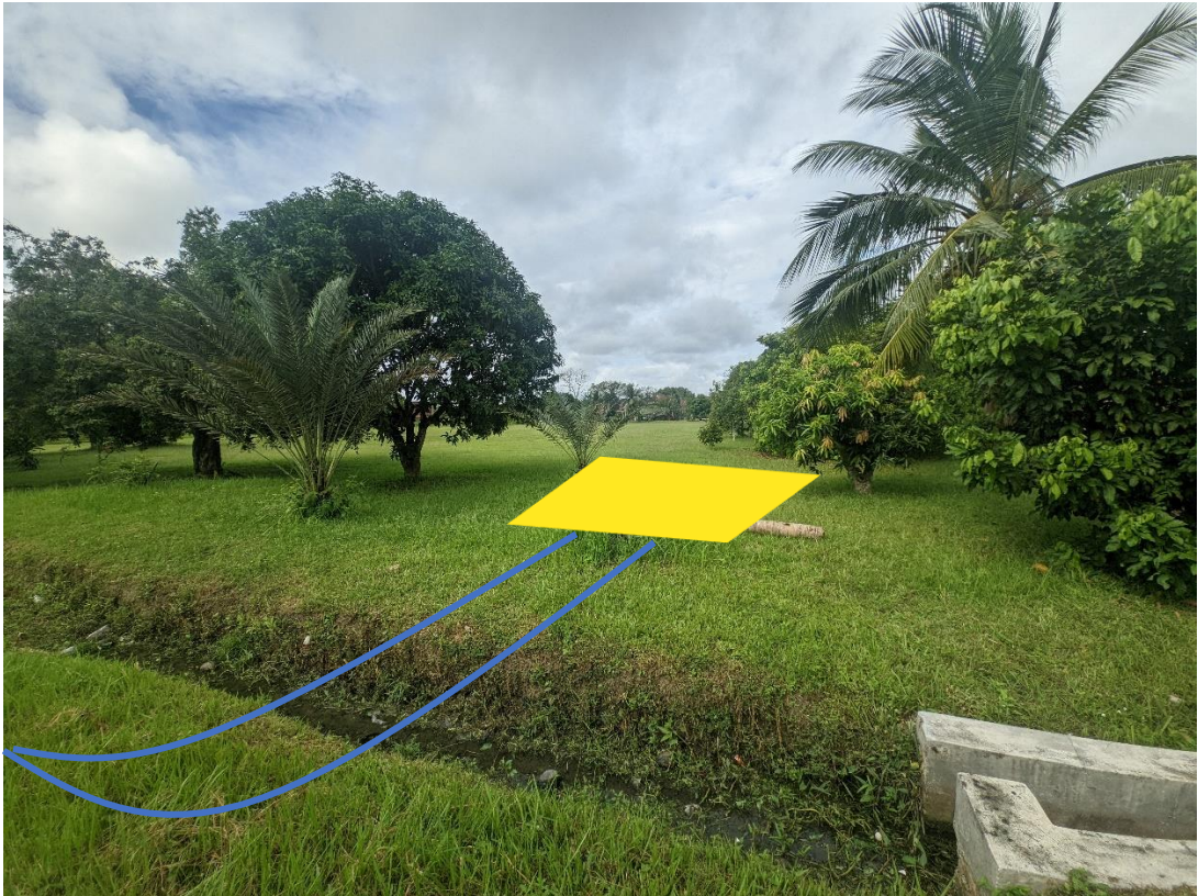
GAMBAR 7: KAWASAN CADANGAN PENCAWANG BAHARU