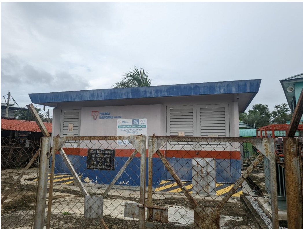
GAMBAR 16: PENCAWANG SEDIADA (PENCAWANG TAMAN INDERA)