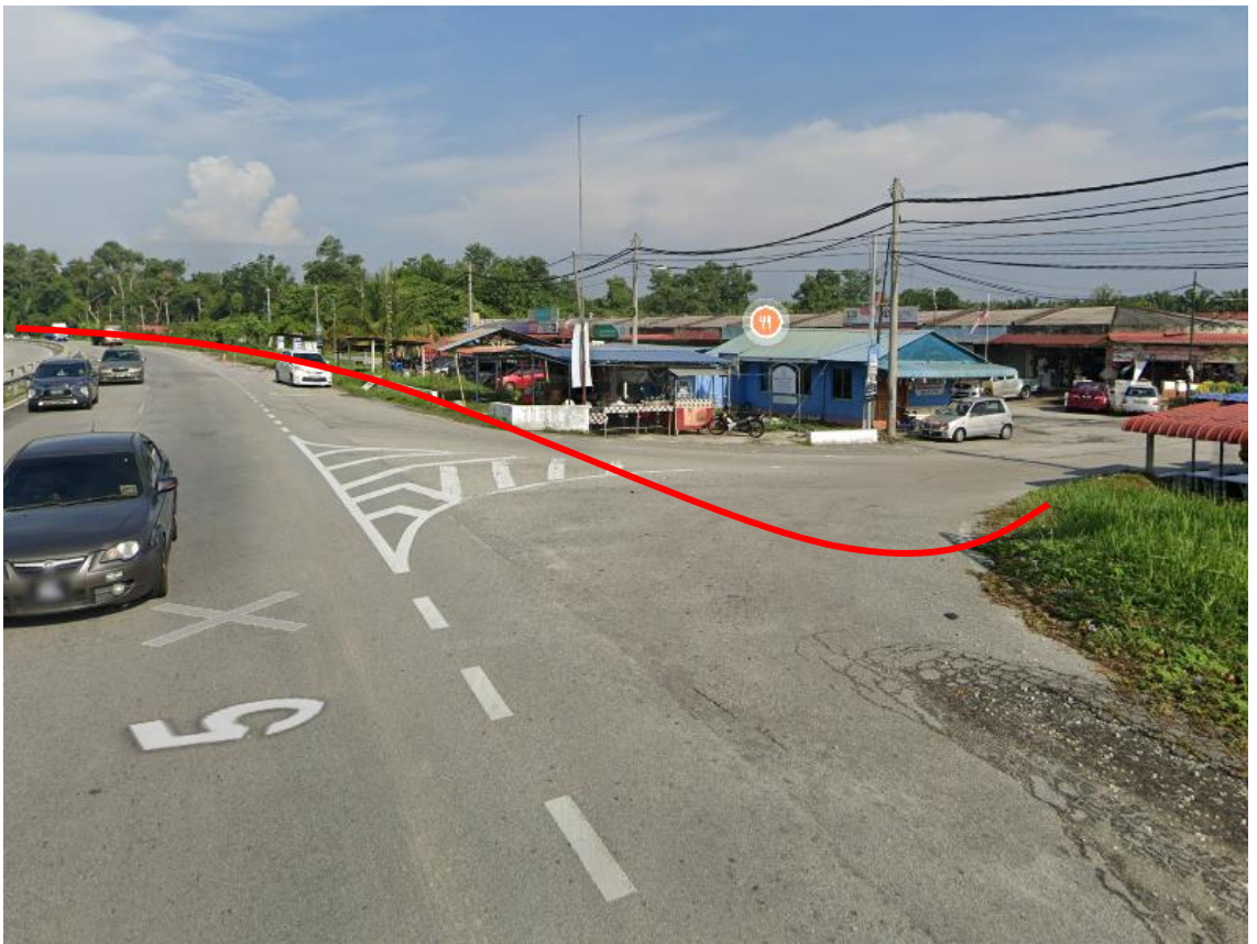
GAMBAR 12: KAWASAN KERJA MELIBATKAN 'HORIZONTAL DIRECTIONAL DRILLING'