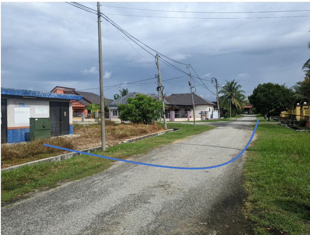
GAMBAR 2: KAWASAN KERJA MELIBATKAN PEMOTONGAN JALAN (OPEN CUT)