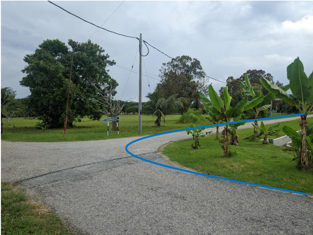
GAMBAR 5: KAWASAN KERJA MELIBATKAN PEMOTONGAN JALAN (OPEN CUT)