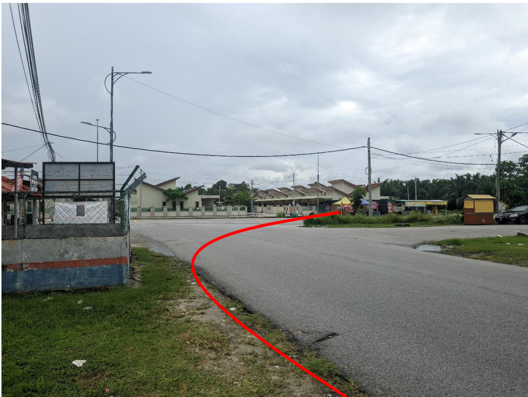
GAMBAR 10: KAWASAN KERJA MELIBATKAN 'HORIZONTAL DIRECTIONAL DRILLING'