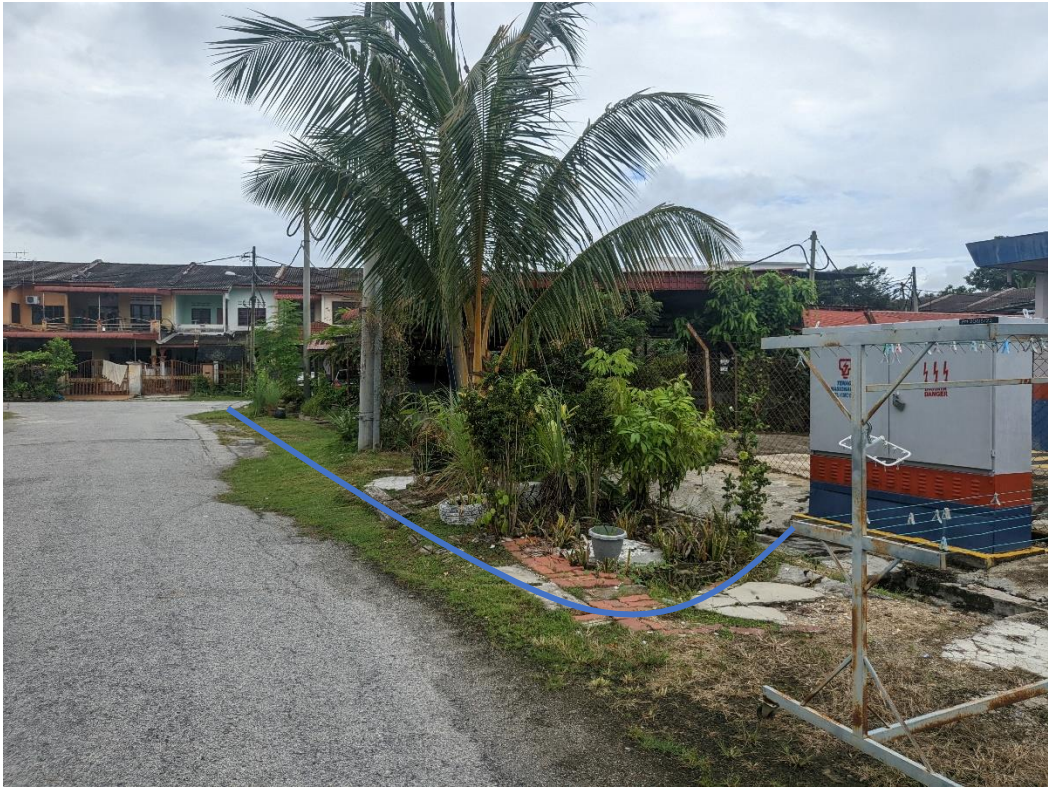
GAMBAR 15: KAWASAN KERJA MELIBATKAN PEMOTONGAN JALAN (OPEN CUT)