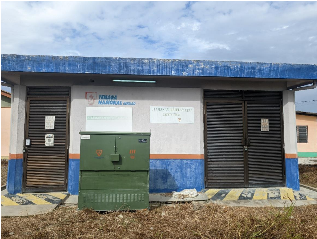
GAMBAR 1: PENCAWANG SEDIADA (PENCAWANG GELUNG PEPUYU RPT FASA 2)