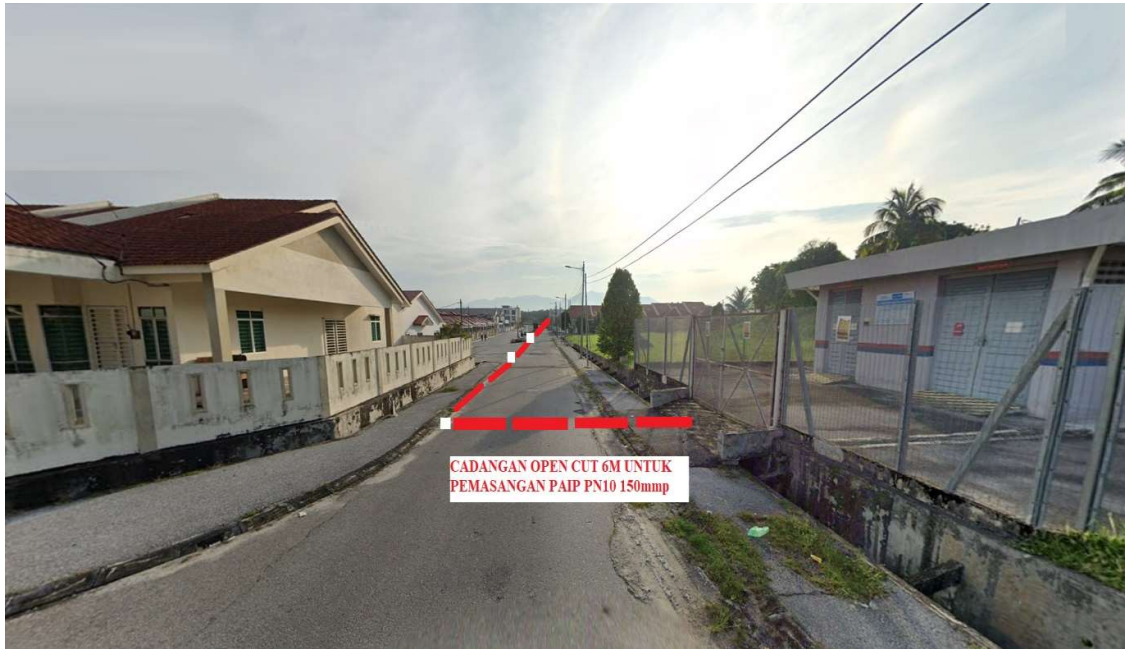
Gambar 1 : Pencawang Sediada (Pencawang Sentral Sungkai Perdana)