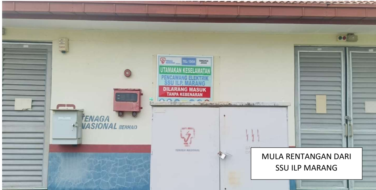
GAMBAR 1: CADANGAN RENTANGAN KABEL 11KV