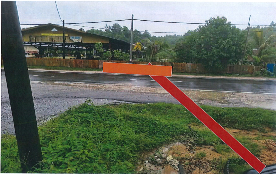
KAWASAN KERJA MELIBATKAN KAEDAH HDD