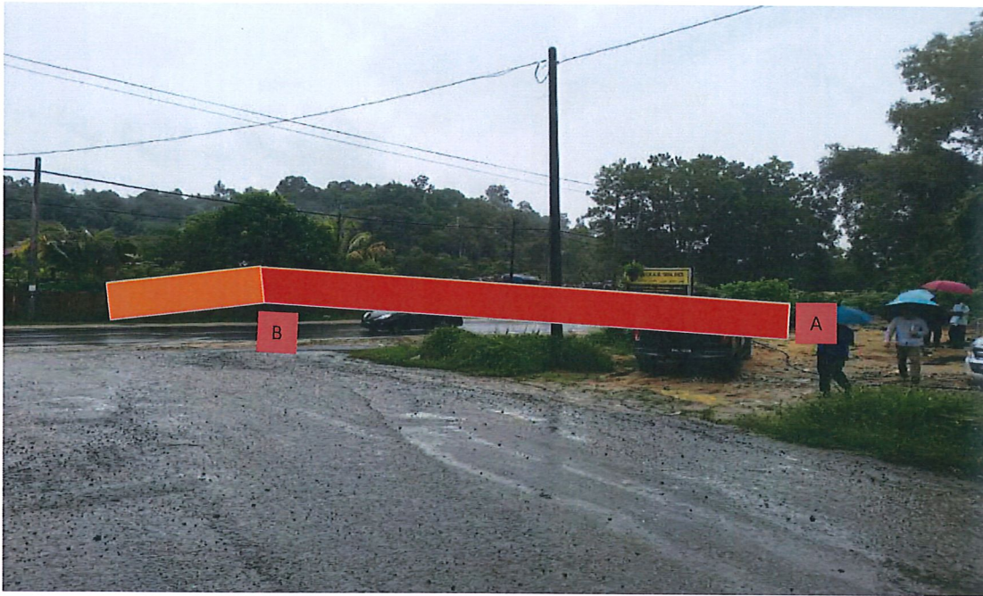
KAWASAN KERJA MELIBATKAN OPEN CUT DI ATAS TANAH BIASA