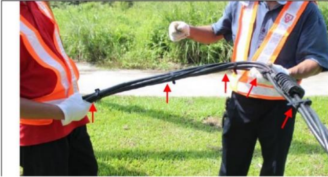
3.7 Buka dawai penyimpai dan keluarkan pencerut kabel dari kabel bertejabat. Pilih dawai neutral dan ukur jarak 1m dari hujung kabel bertejabat untuk memasang penetap tamatan. Kemaskan pemasangan penetap tamatan dengan pengikat nylon.