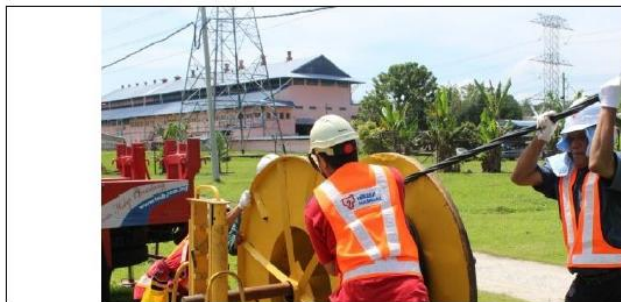
4.1 Gulung kembali drum kabel supaya kabel bertejabat kelihatan tegang. Kabel bertejabat kelihatan tegang setelah proses menggulung kembali kabel dilakukan. Pasang come along