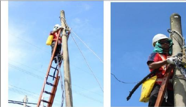
3.8 Naikkan kabel bertejabat yang telah dipasang penetap tamatan ke atas tiang. Dengan bantuan pekerja di bawah, masukkan ekor penetap tamatan pada Penyangkuk Universal. Kemaskan pemasangan dengan mengikat hujung kabel bertejabat pada tiang menggunakan pengikat nylon.