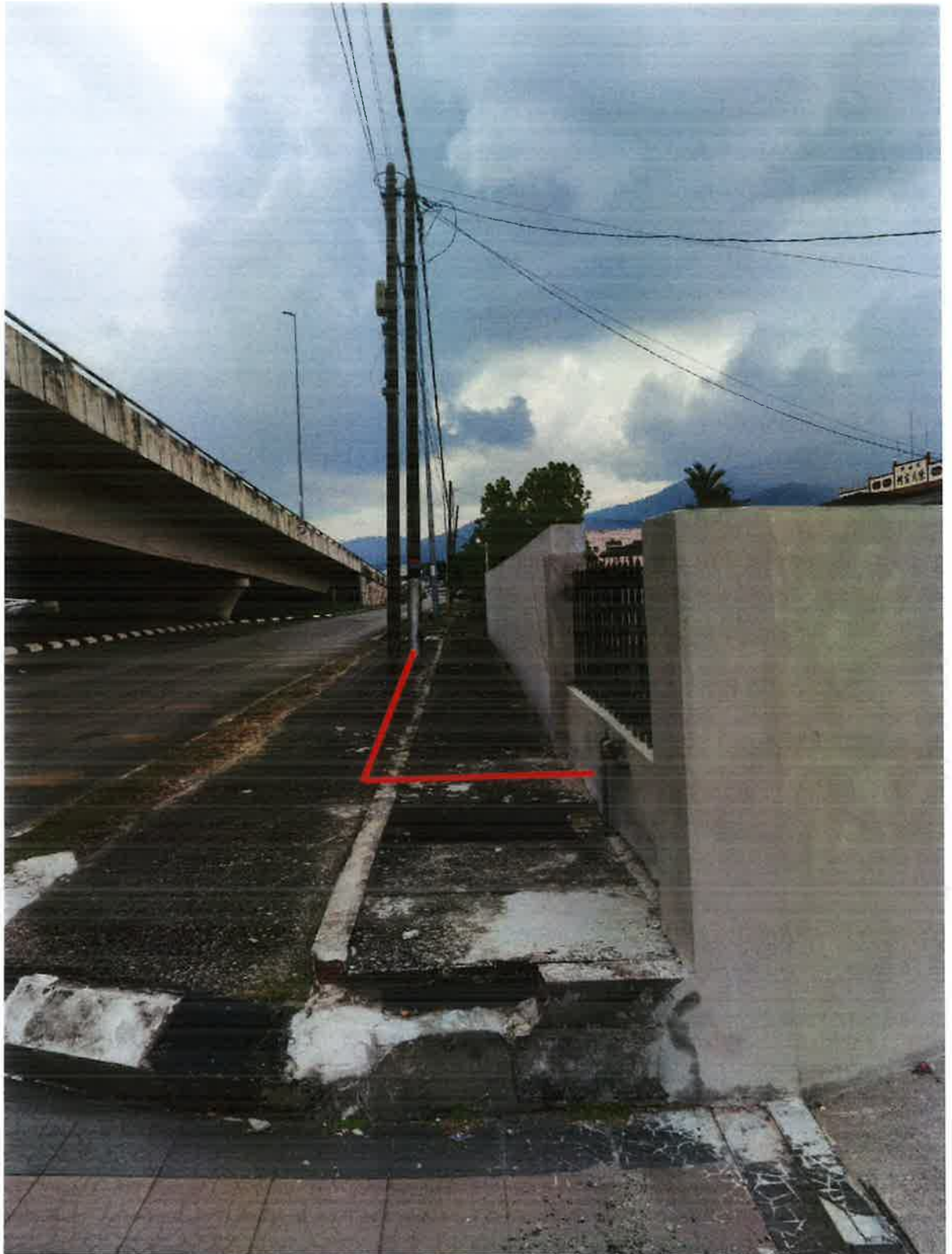
Rentang kabel bawah tanah sepanjang (30 meter)