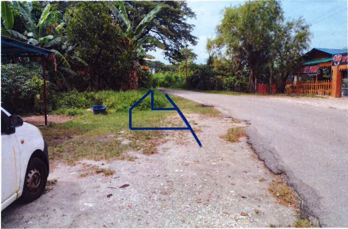
JALAN DESA PENGKALAN, TMN. DESA PENGKALAN.