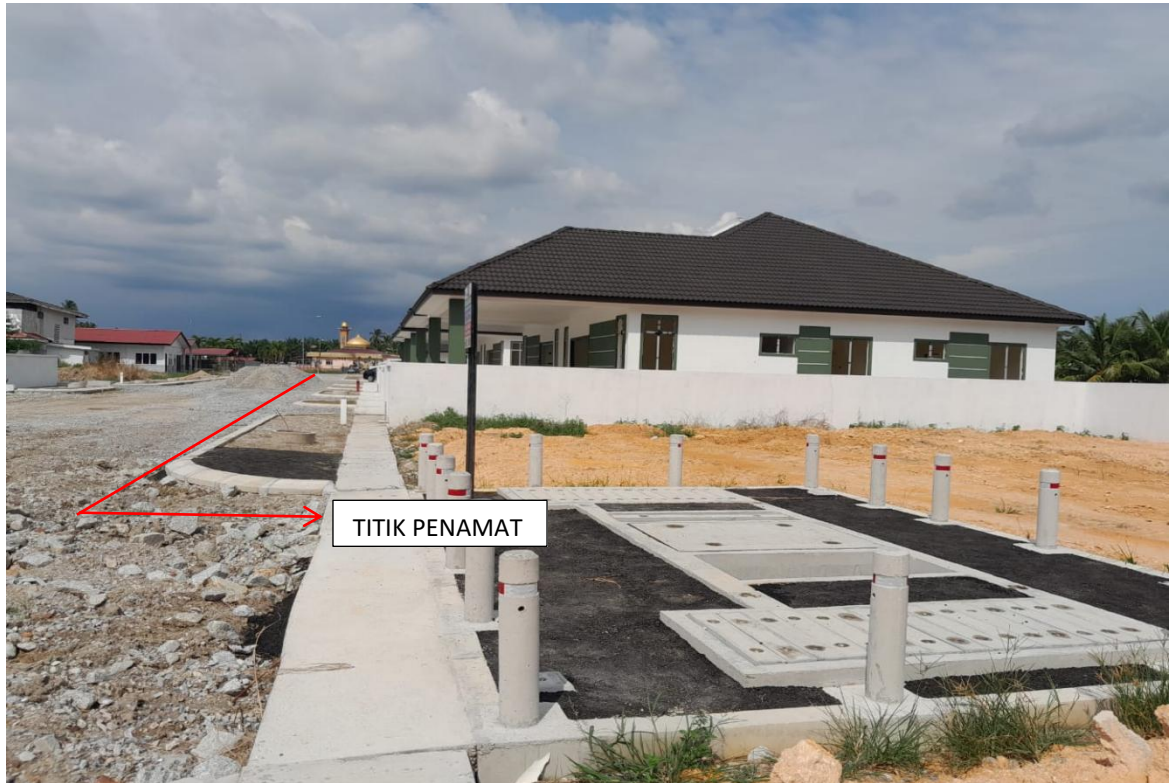
GAMBAR 13 : CADANGAN LALUAN KABEL BAWAH TANAH