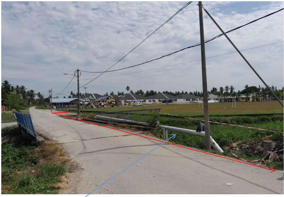
GAMBAR 4 : CADANGAN PEMASANGAN GI PAIP 6Ø SELARI DENGAN KEDUDUKAN PAIP LAP