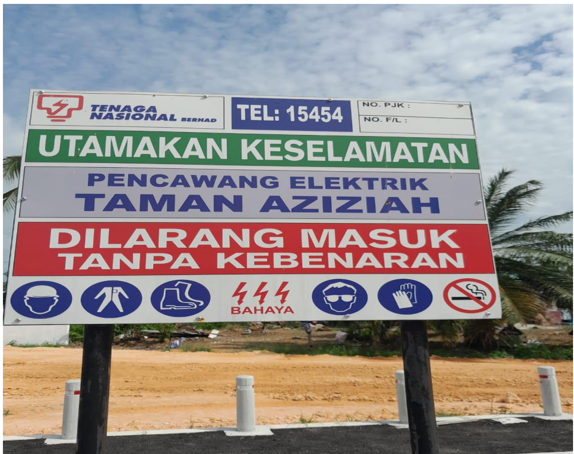
GAMBAR 16 : TAPAK PENCAWANG ELEKTRIK TAMAN AZIZIAH