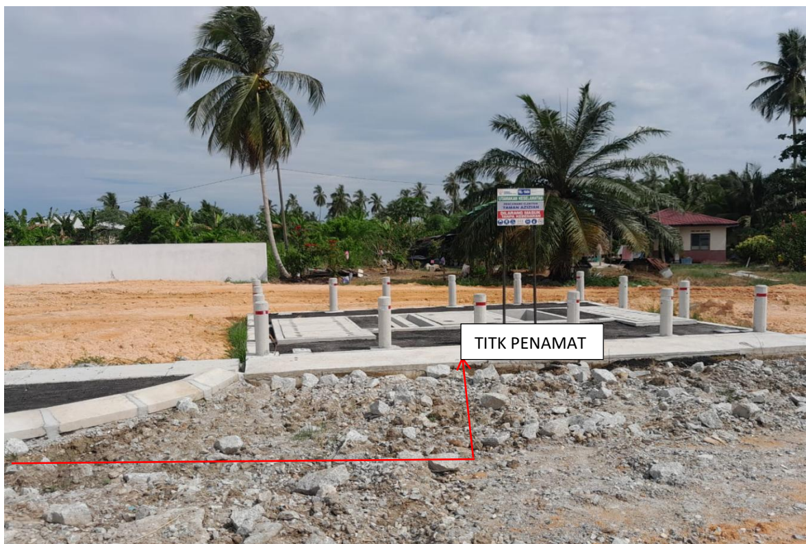
GAMBAR 14 : CADANGAN LALUAN KABEL BAWAH TANAH