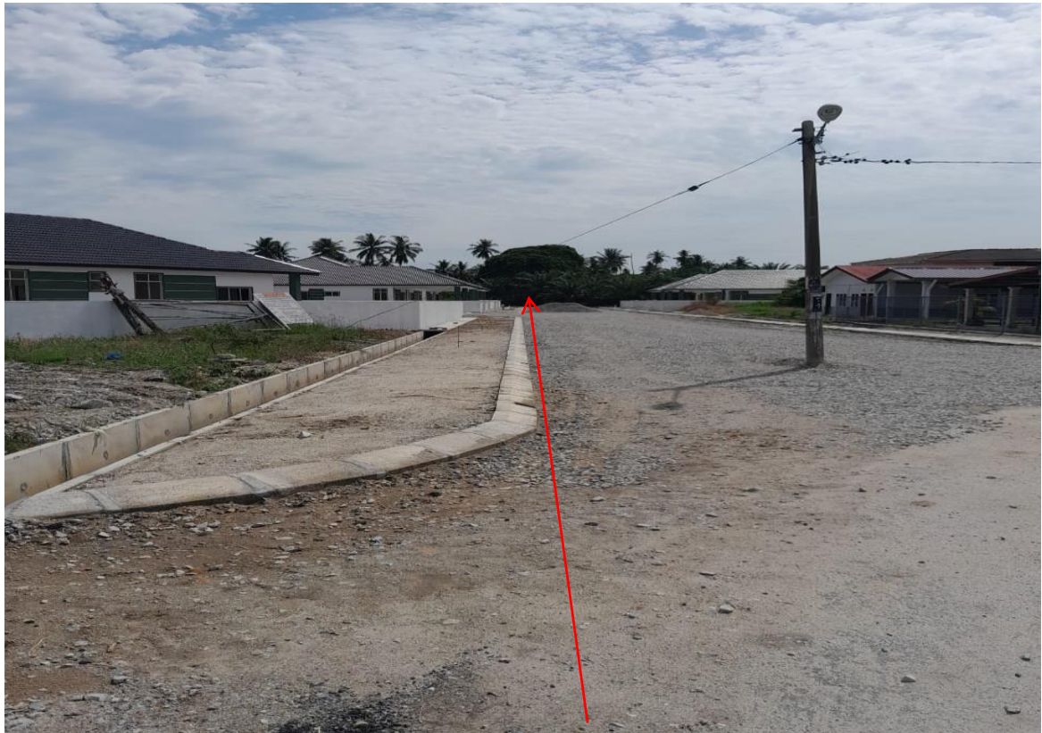
GAMBAR 9 : CADANGAN LALUAN KABEL BAWAH TANAH