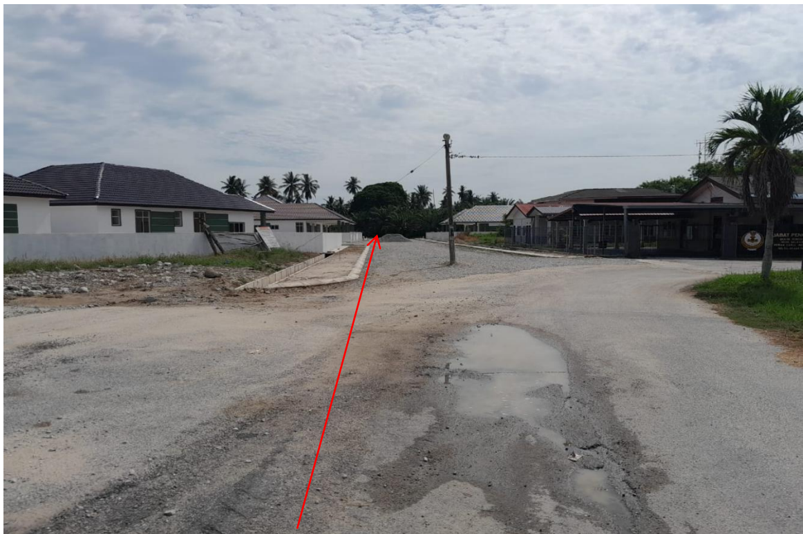
GAMBAR 8 : CADANGAN LALUAN KABEL BAWAH TANAH