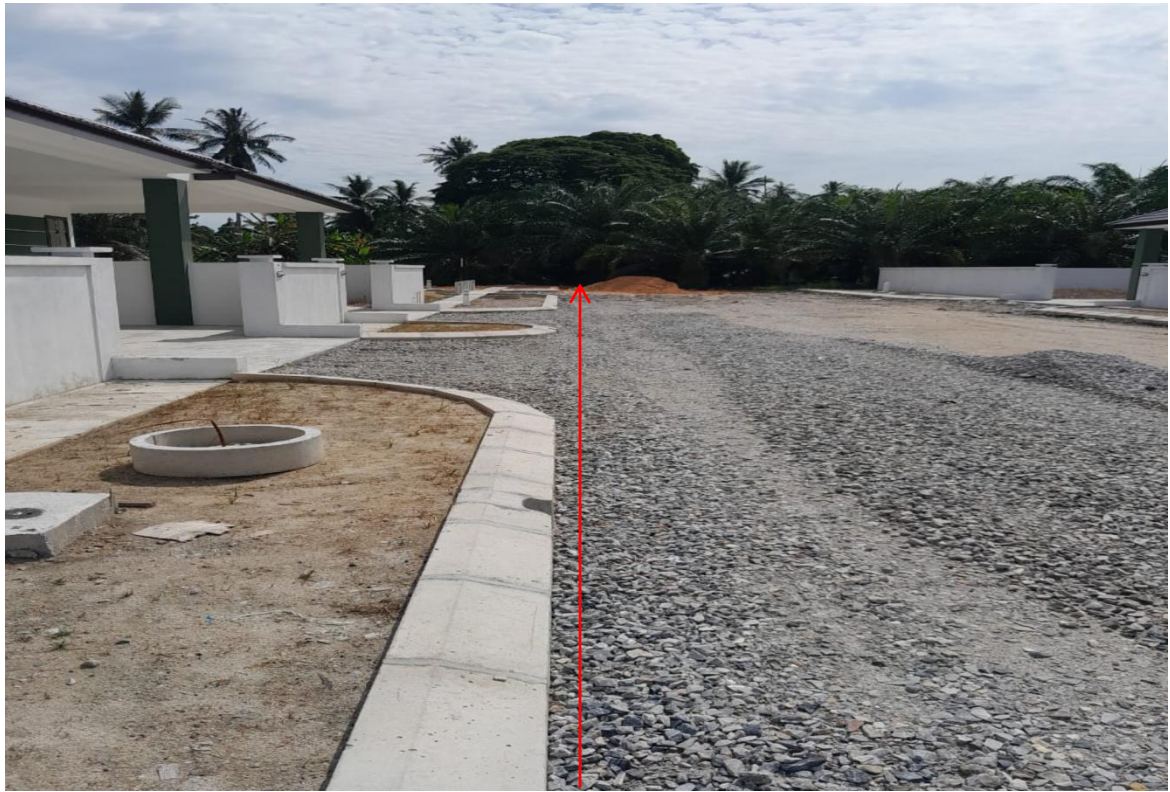
GAMBAR 11 : CADANGAN LALUAN KABEL BAWAH TANAH