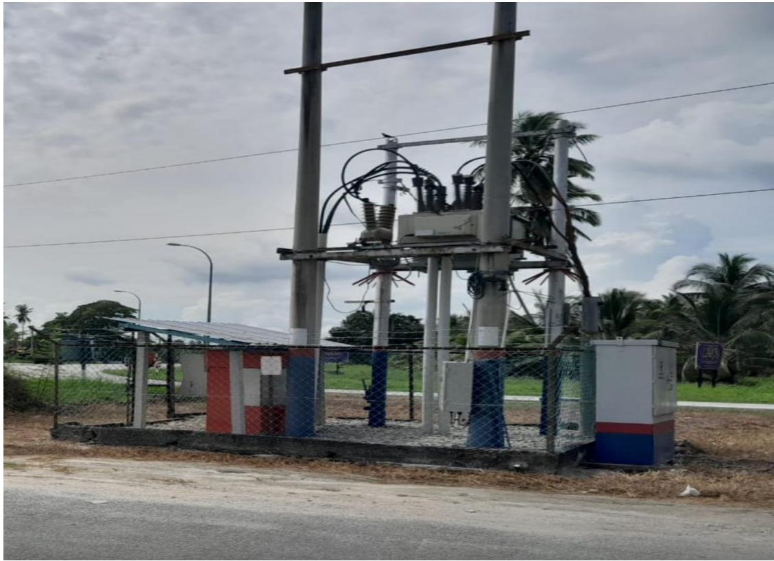
GAMBAR 1 : PENCAWANG SEDIADA