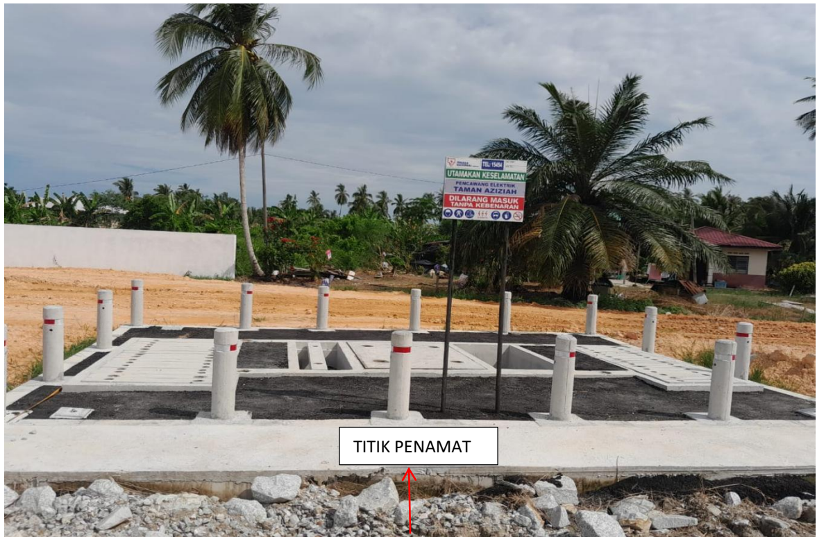
GAMBAR 15 : LALUAN KABEL BAWAH TANAH