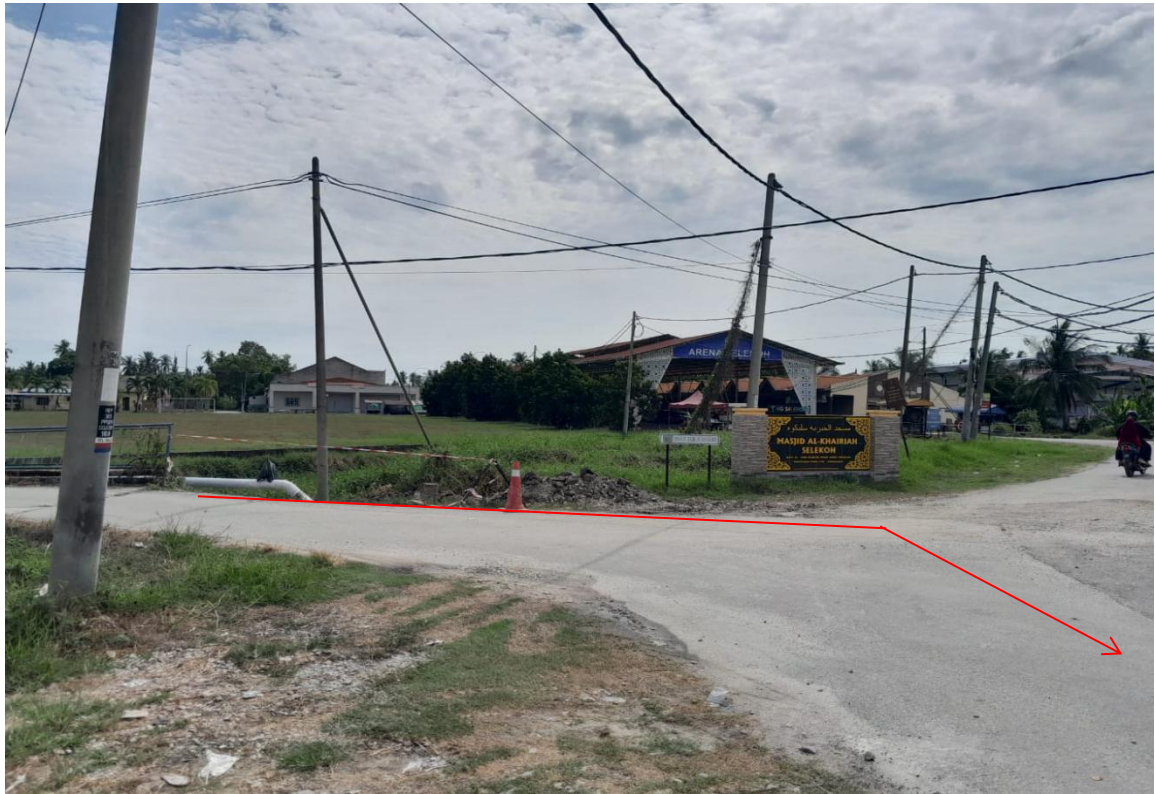
GAMBAR 3 : CADANGAN LALUAN KABEL BAWAH TANAH