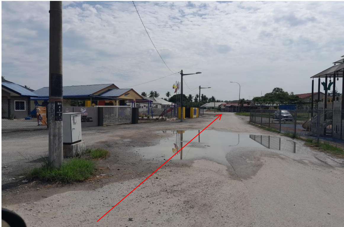
GAMBAR 7 : CADANGAN LALUAN KABEL BAWAH TANAH