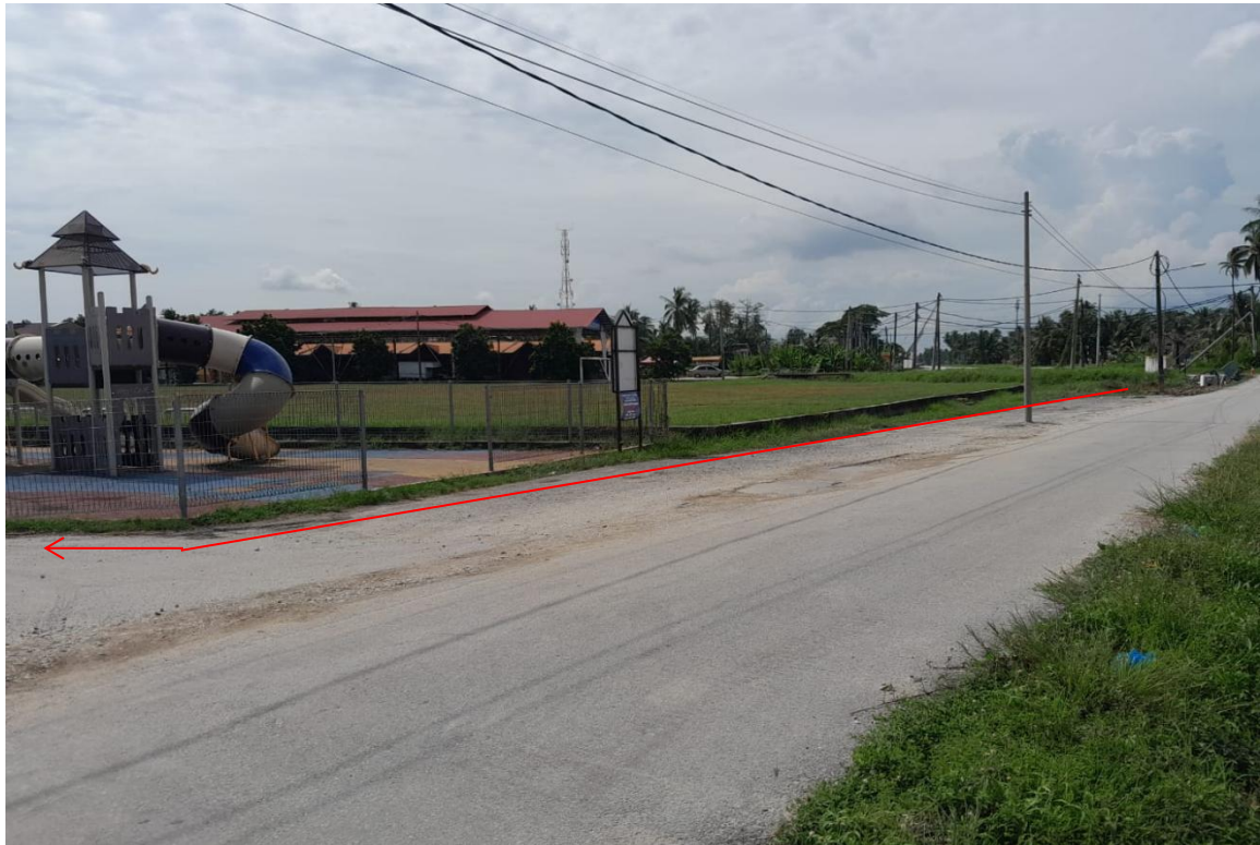
GAMBAR 5 : CADANGAN LALUAN KABEL BAWAH TANAH