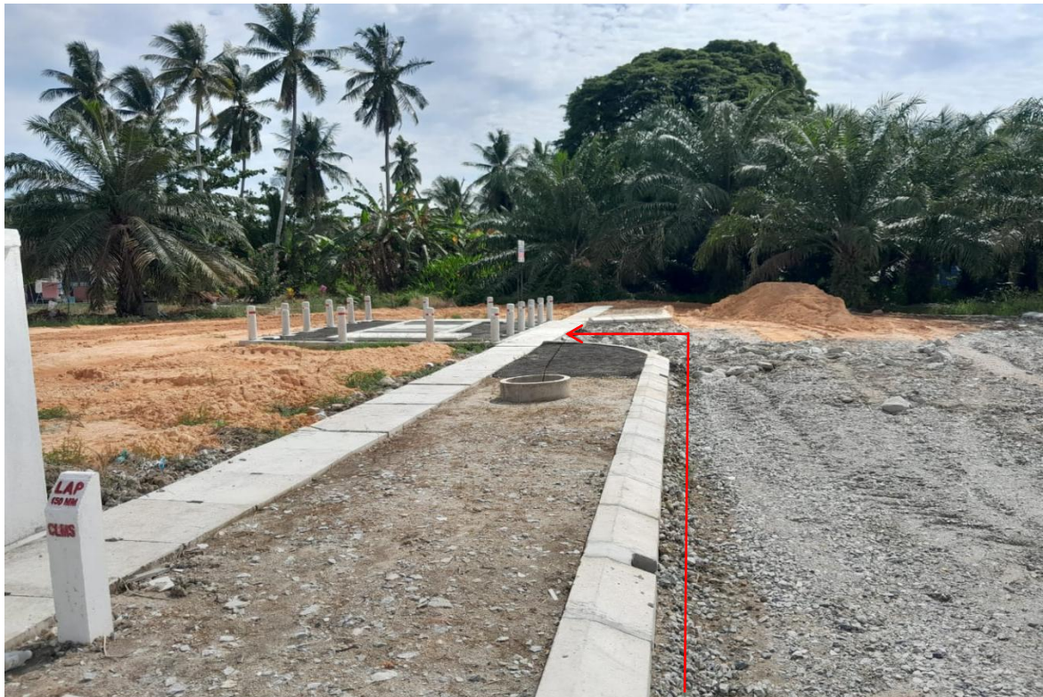
GAMBAR 12 : CADANGAN LALUAN KABEL BAWAH TANAH