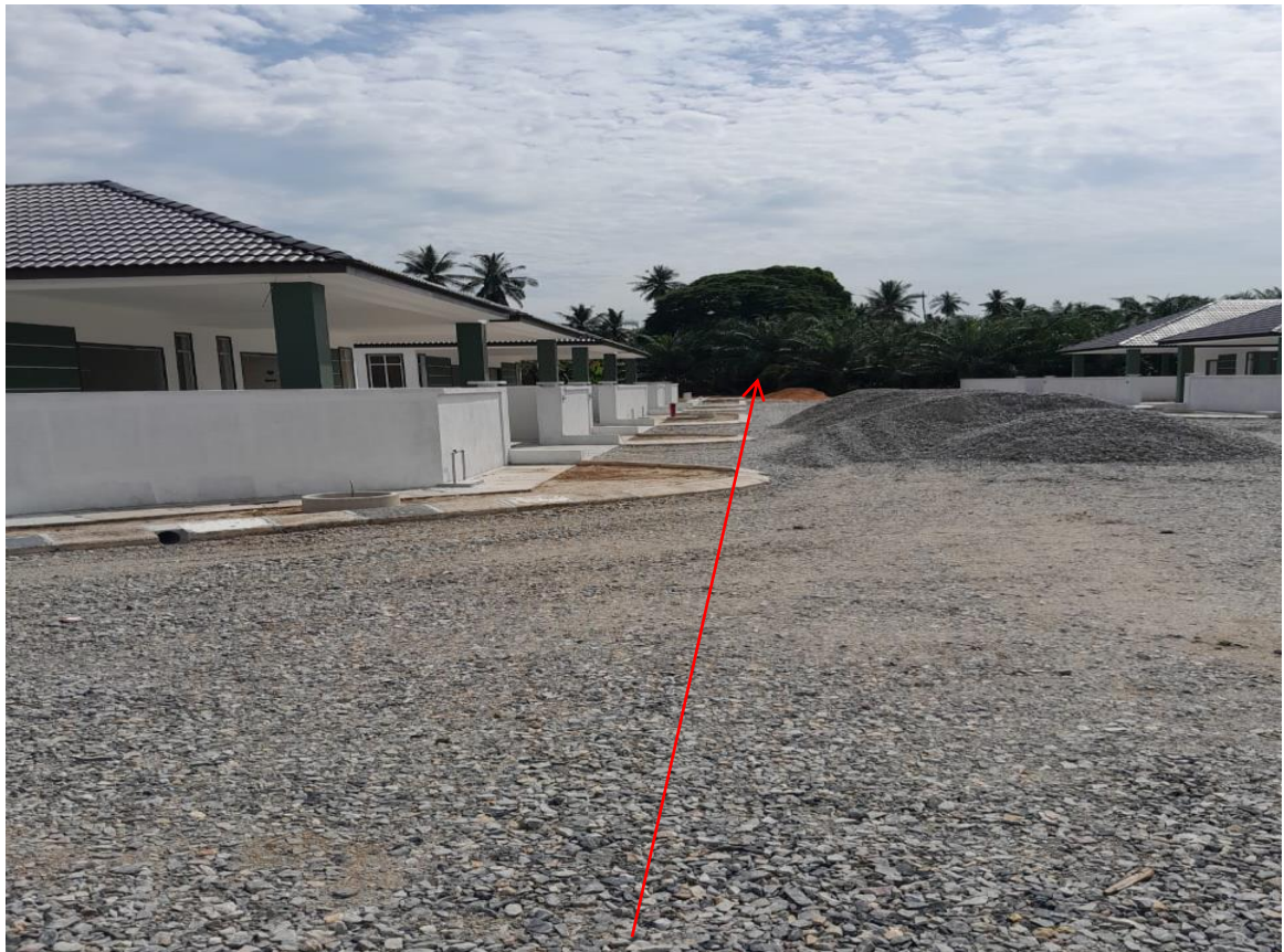
GAMBAR 10 : CADANGAN LALUAN KABEL BAWAH TANAH