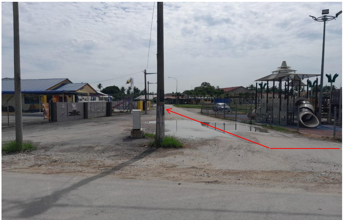
GAMBAR 6 : CADANGAN LALUAN KABEL BAWAH TANAH