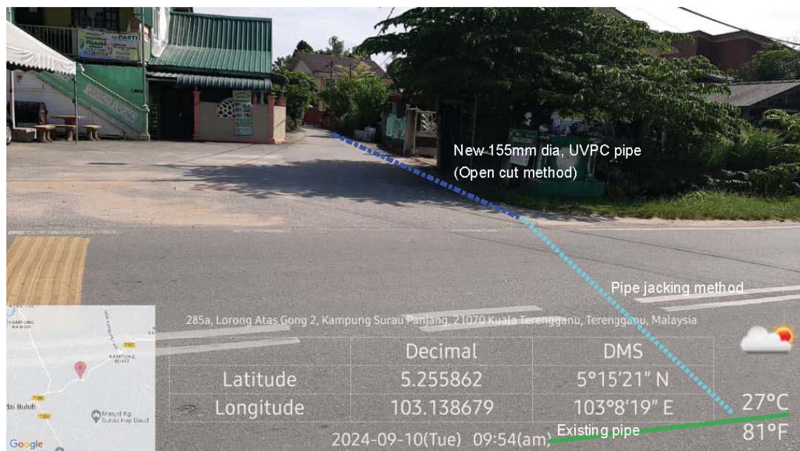
GAMBAR 4 : Kawasan cadangan laluan paip baru dan sambungan ke paip sedia ada.