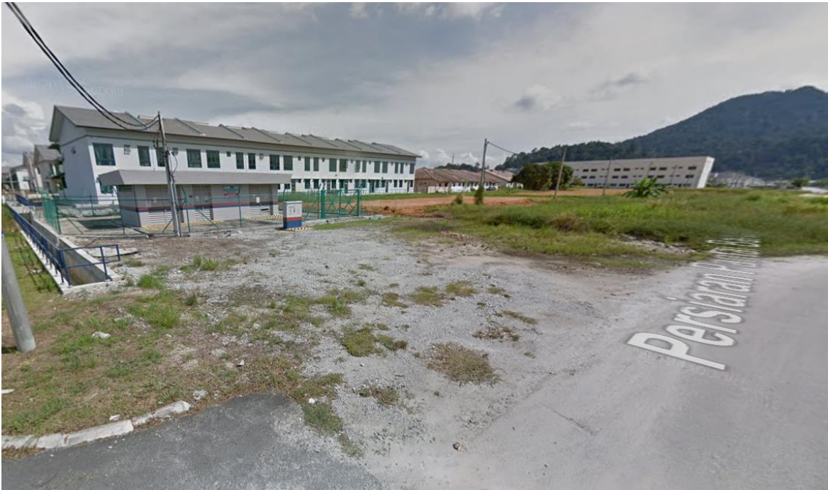
GAMBAR 1: PENCAWANG SEDIADA (PENCAWANG TAMAN DESA PANTAI 2)