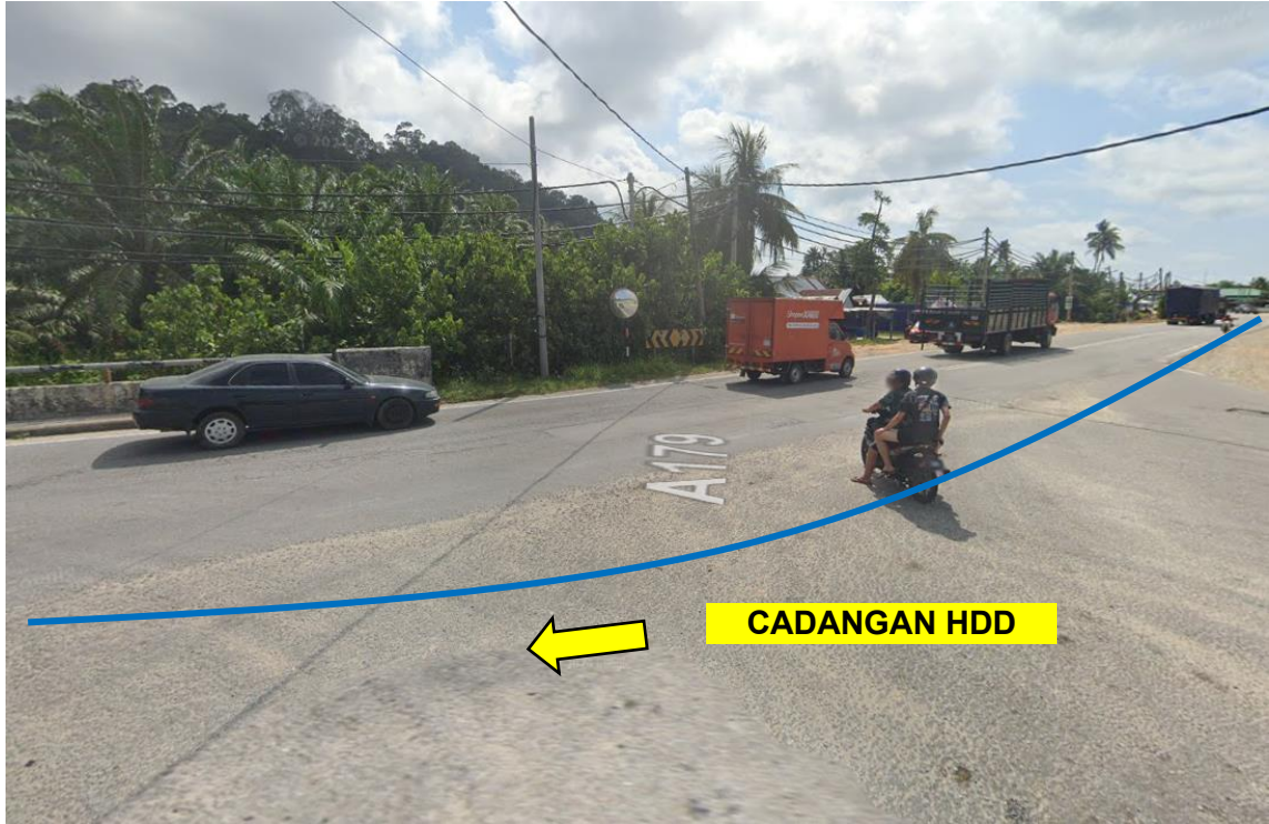
GAMBAR 7: KAWASAN KERJA MELIBATKAN 'HORIZONTAL DIRECTIONAL DRILLING'