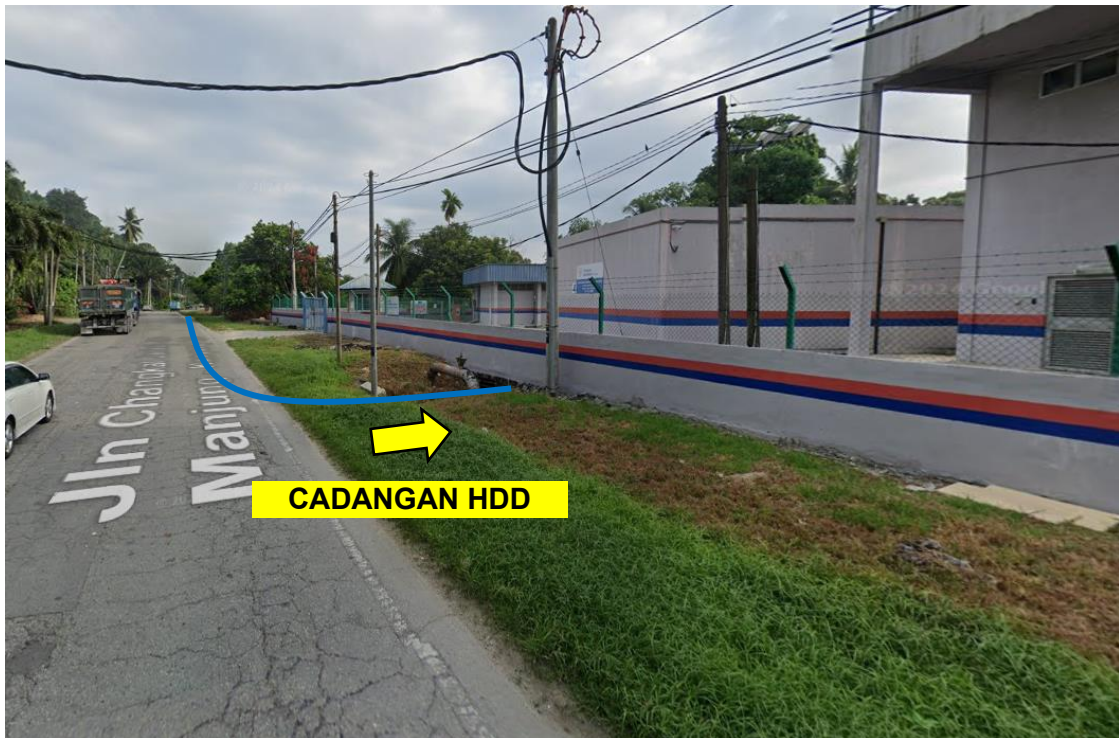
GAMBAR 8: KAWASAN KERJA MELIBATKAN 'HORIZONTAL DIRECTIONAL DRILLING'