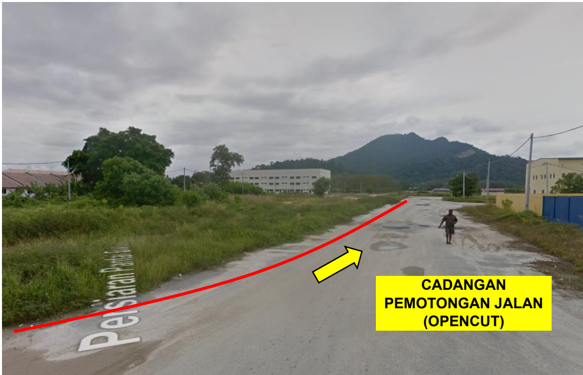
GAMBAR 3: KAWASAN KERJA MELIBATKAN PEMOTONGAN JALAN (OPENCUT)