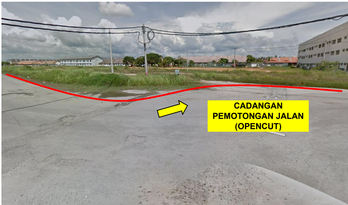
GAMBAR 4: KAWASAN KERJA MELIBATKAN PEMOTONGAN JALAN (OPENCUT)