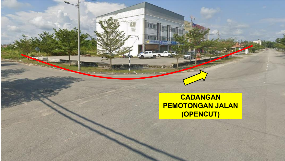
GAMBAR 5: KAWASAN KERJA MELIBATKAN PEMOTONGAN JALAN (OPENCUT)