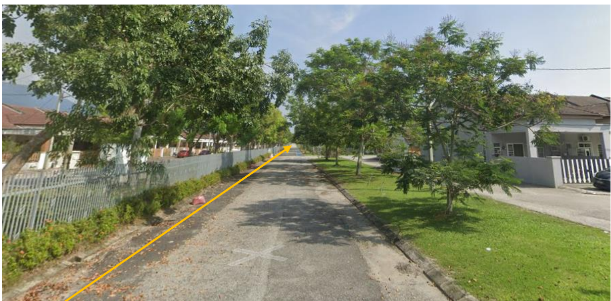
KERJA – KERJA OPEN CUT JALAN BERTURAP (364M) JALAN PUTRA BERLIAN 9 (4.321394, 101.131271, 4.31876, 101.133335)