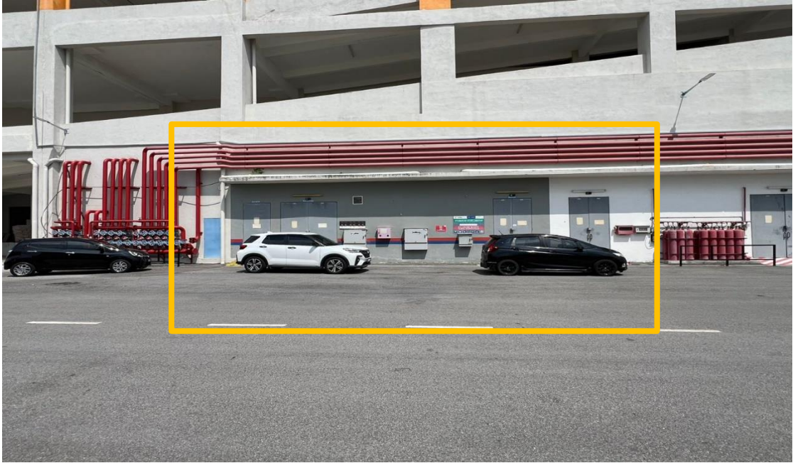
TITIK AKHIR LALUAN KABEL DI JALAN PEMAJU ( 4.317961, 101.131615 )