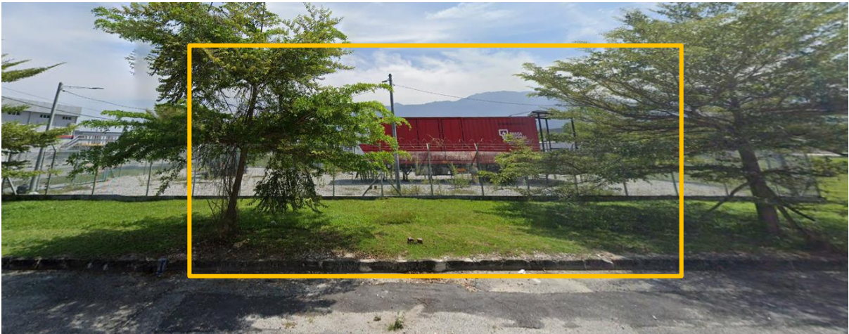
TITIK MULA (4.321717, 101.127662)