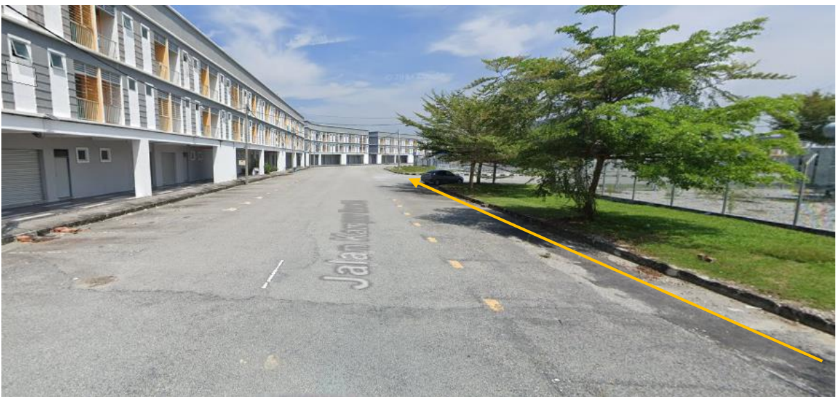
KERJA – KERJA OPEN CUT JALAN BERTURAP (40M) JALAN KAMPAR BARAT 9 (4.321693, 101.127672, 4.321902, 101.127538)