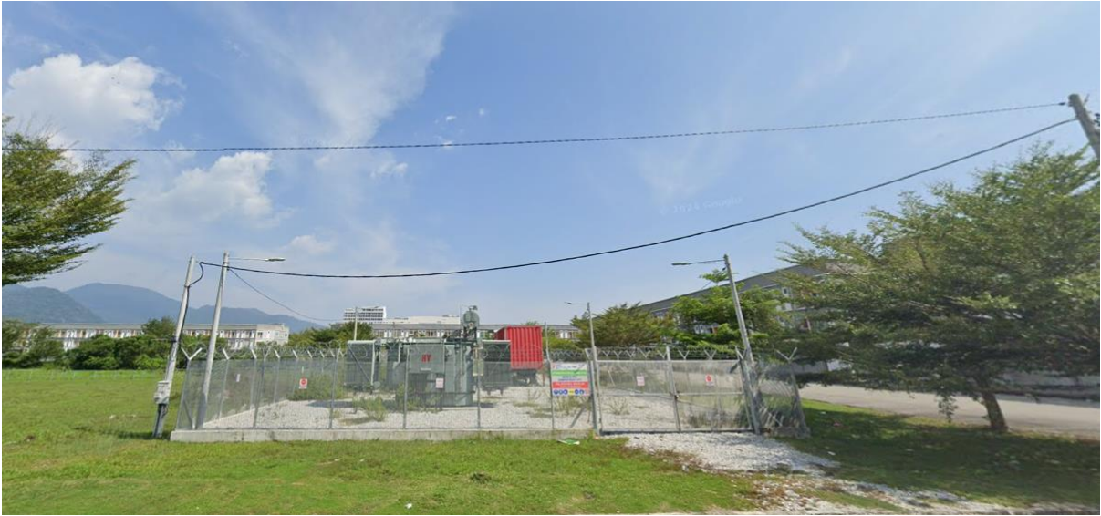
GAMBAR PENCAWANG SEDIA ADA: MOBILE PPU WEST CITY