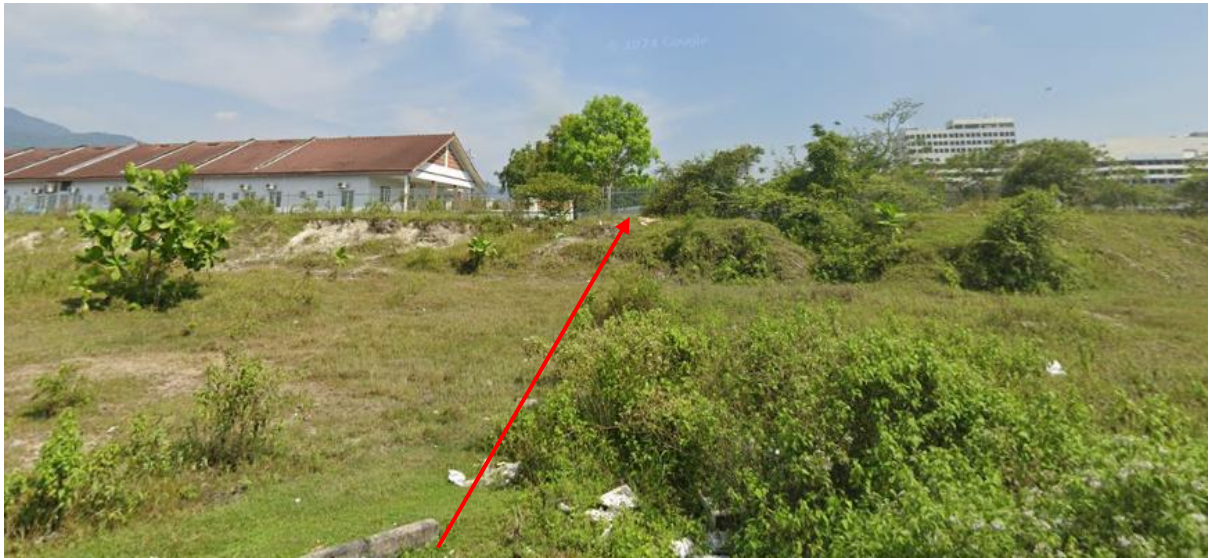
KERJA – KERJA OPEN CUT JALAN TIDAK BERTURAP (44M) JALAN KAMPAR BARAT (4.321905, 101.130823, 4.321576, 101.13086)