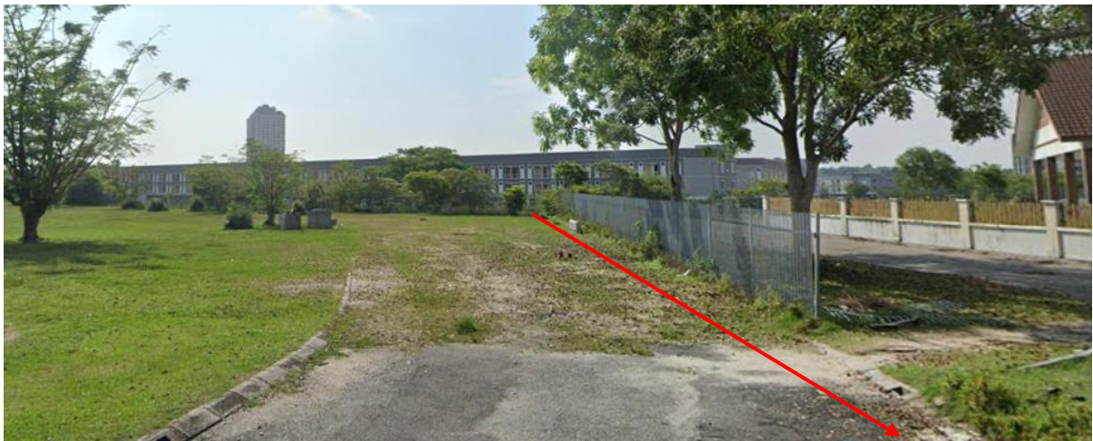
KERJA – KERJA OPEN CUT JALAN TIDAK BERTURAP (58M) JALAN PUTRA BERLIAN (4.321576, 101.13086, 4.321394, 101.131271)