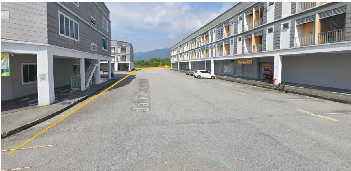
KERJA – KERJA OPEN CUT JALAN BERTURAP (98M) JALAN KAMPAR BARAT 10 (4.322002, 101.129705, 4.322587, 101.130616)