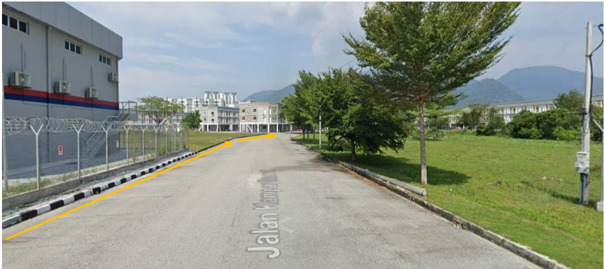
KERJA – KERJA OPEN CUT JALAN BERTURAP (303M) JALAN KAMPAR BARAT 9 (4.321902, 101.127538, 4.322002, 101.129705)