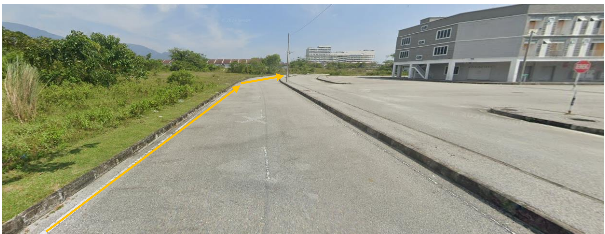
KERJA – KERJA OPEN CUT JALAN BERTURAP (61M) JALAN KAMPAR BARAT (4.322587, 101.130616, 4.321905, 101.130823)