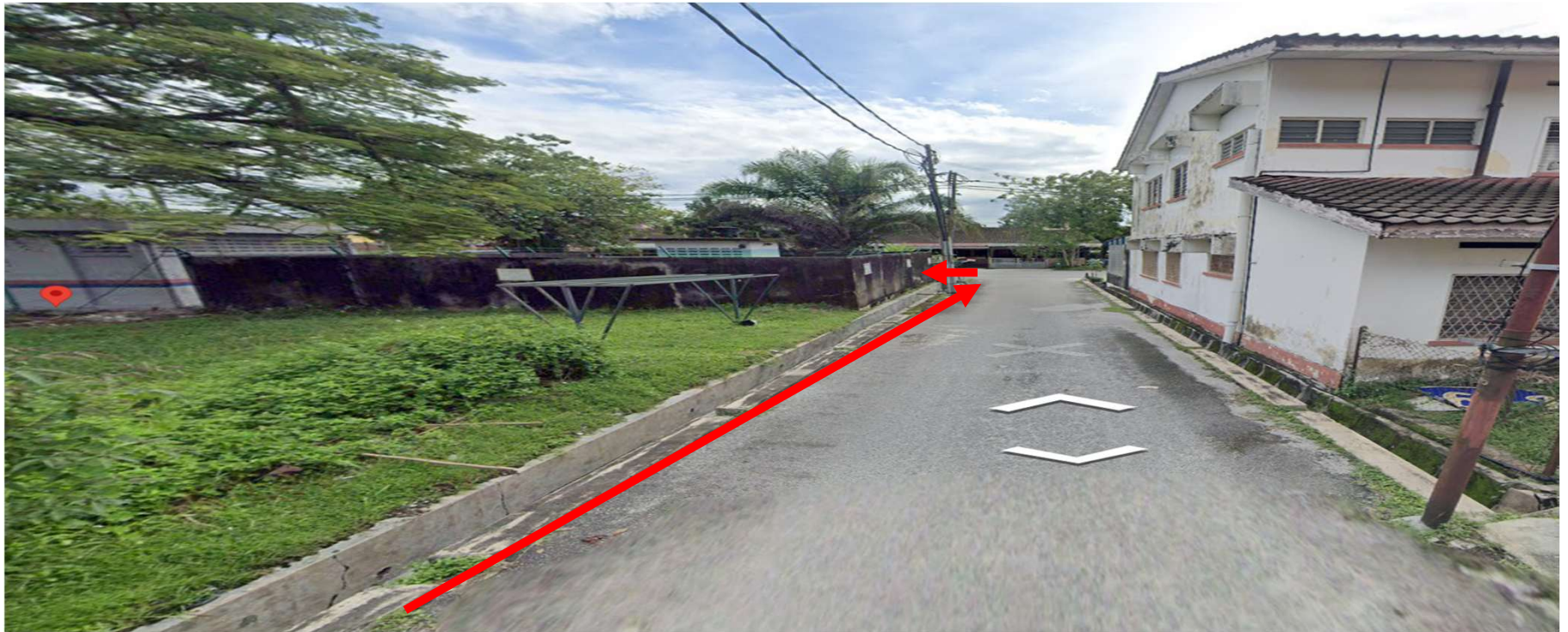
JALAN KLEDANG RAYA 12-KAEDAH OPEN CUT