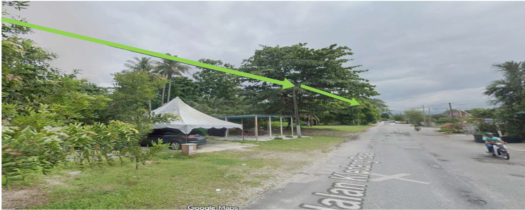
JALAN KLEDANG RAYA 9-KAEDAH TUMPANG TIANG SEDIA ADA