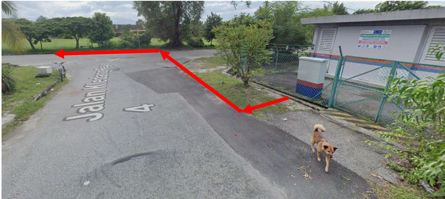
PE TMN KLEDANG JAYA KE JALAN KLEDANG RAYA 4-KAEDAH OPEN CUT