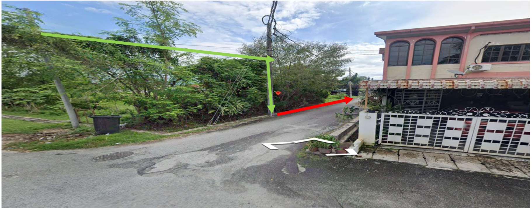
JALAN KLEDANG RAYA 12-KAEDAH TUMPANG TIANG DAN OPEN CUT