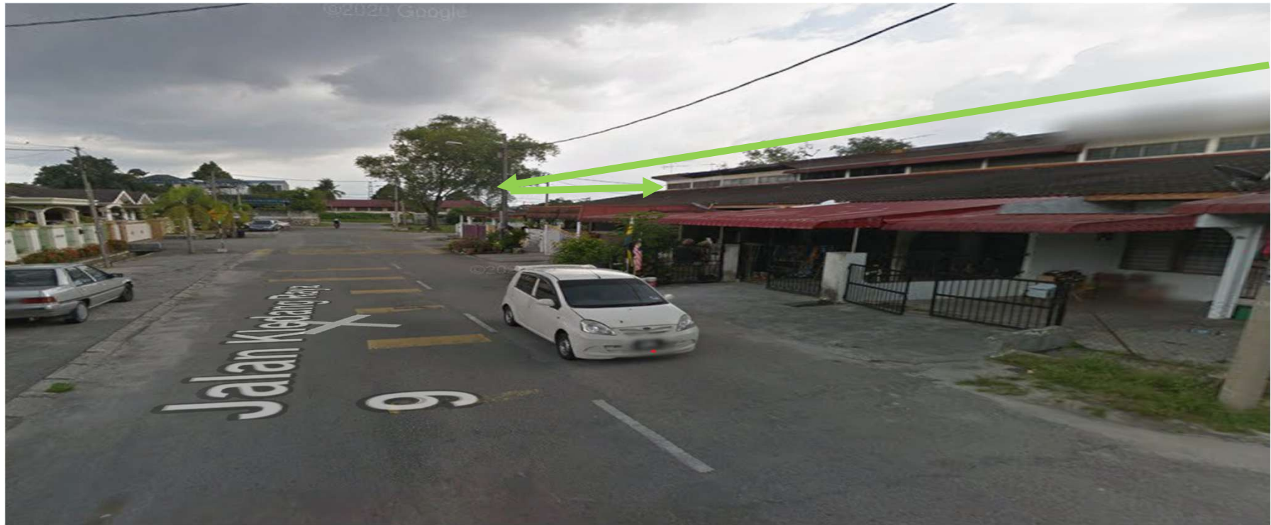
JALAN KLEDANG RAYA 9-KAEDAH TUMPANG TIANG SEDIA DAN MASUK KANAN KE JALAN KLEDANG RAYA 12