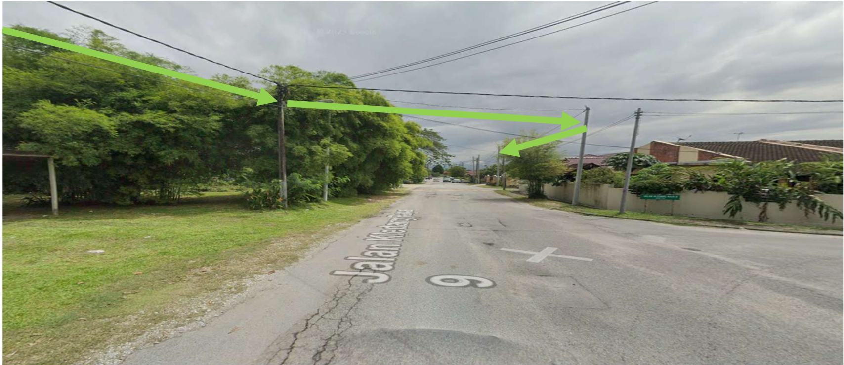
JALAN KLEDANG RAYA 9-KAEDAH TUMPANG TIANG SEDIA ADA CROSS KE SEBERANG