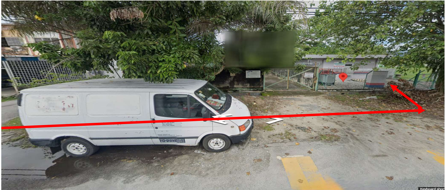
JALAN KLEDANG RAYA 14 KE PE MALKOFF-KAEDAH OPEN CUT