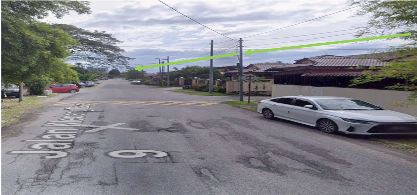
JALAN KLEDANG RAYA 9-KAEDAH TUMPANG TIANG SEDIA