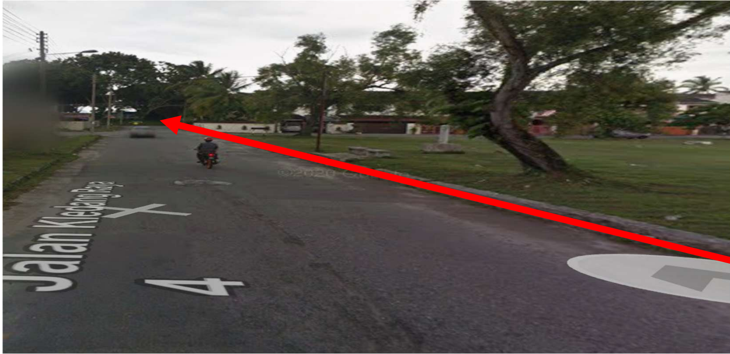
JALAN KLEDANG RAYA 4-KAEDAH OPEN CUT