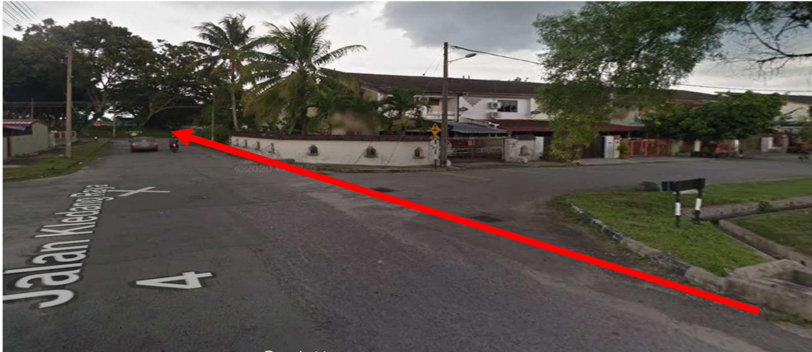
JALAN KLEDANG RAYA 4-KAEDAH OPEN CUT