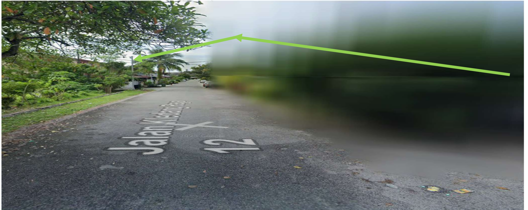
JALAN KLEDANG RAYA 12-KAEDAH TUMPANG TIANG SEDIA ADA DAN CROSS KE KIRI