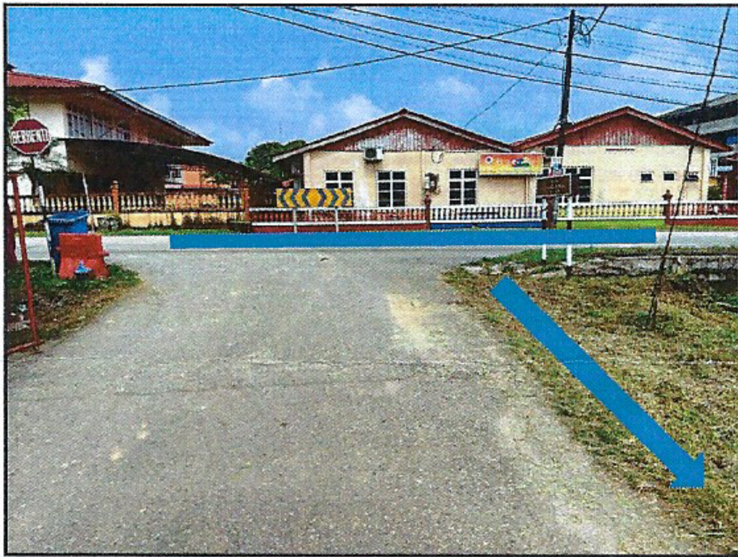
CADANGAN OPEN CUT ATAS TAR DAN TANAH