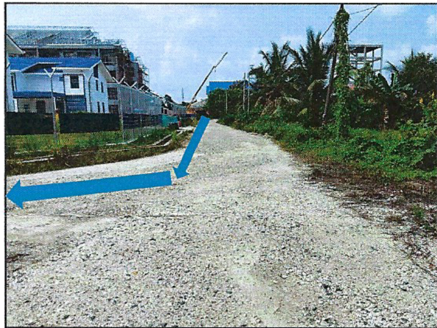
CADANGAN OPEN CUT ATAS TANAH