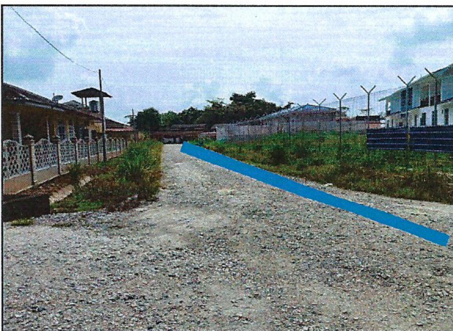
CADANGAN OPEN CUT ATAS TANAH