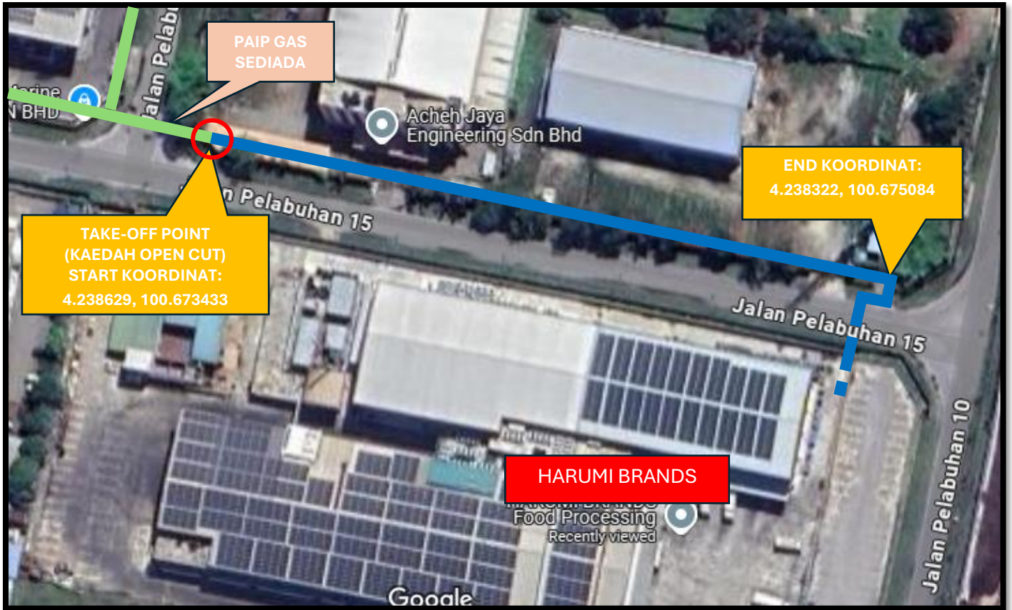
FIGURE 1.1: JALAN PELABUHAN 15