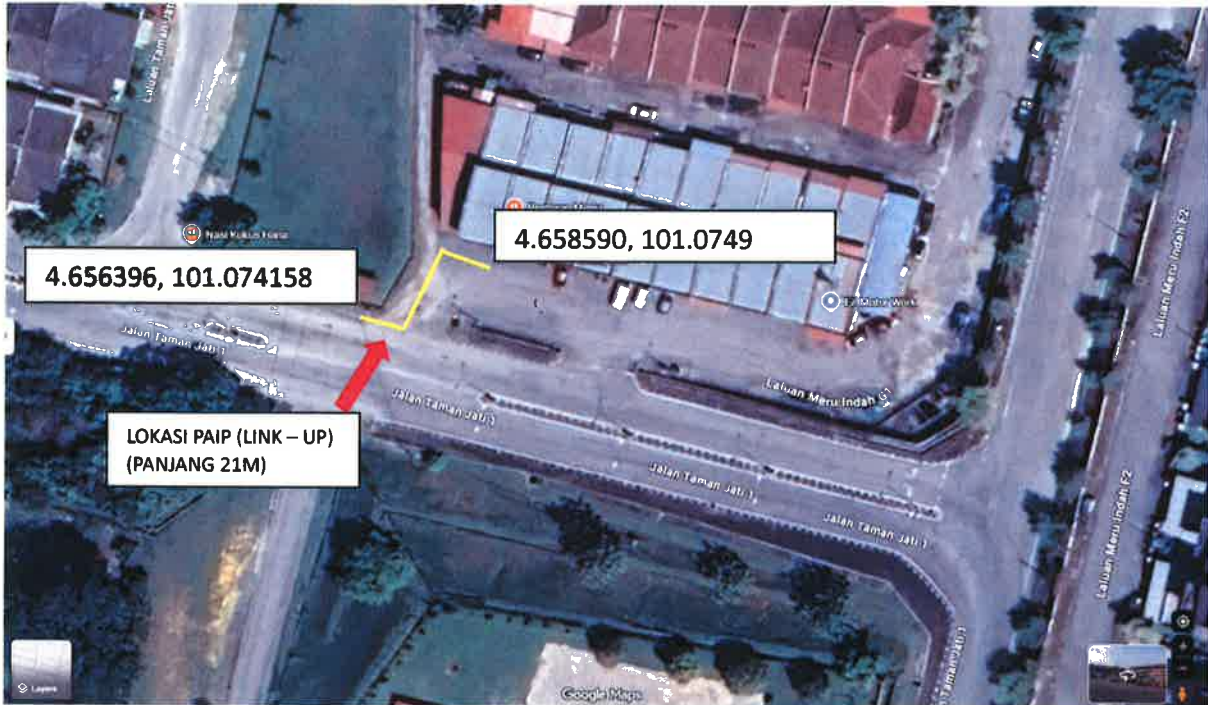
CADANGAN PEMASANGAN PAIP (LINK UP) DN100