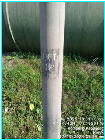
Tiang sedia ada