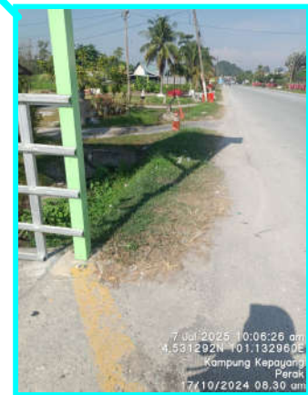
Cadangan Tiang TNB (Baru)

Koordinat: 4.531292N, 101.132960E POINT B