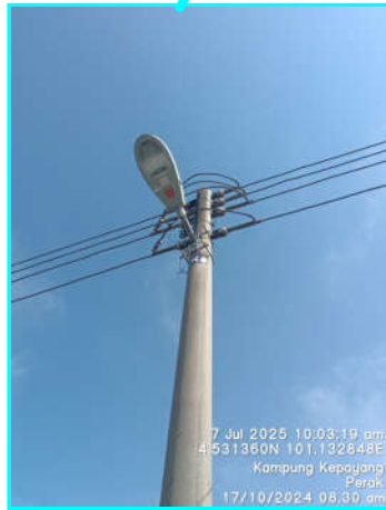
Tiang sedia ada

Koordinat: 4.531342N, 101.1329817E POINT A