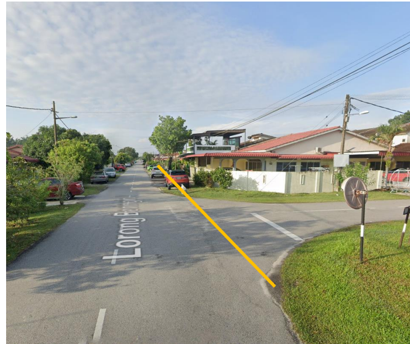
GAMBAR 6 : KAWASAN KERJA YANG MELIBATKAN KOREKAN SECARA TERBUKA LORONG BERINGIN 10