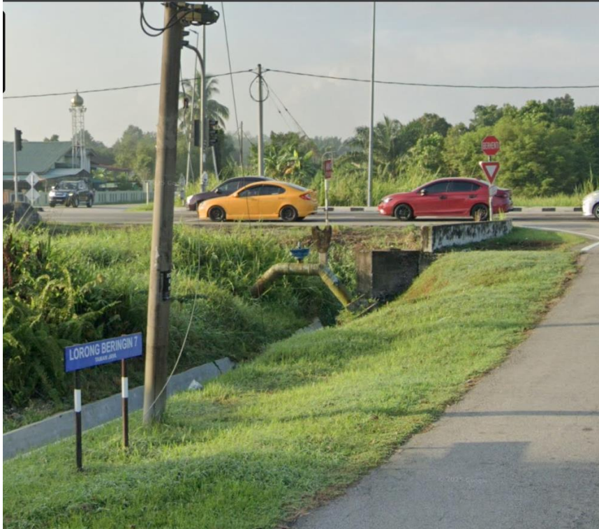
GAMBAR 1: TITIK MULA KERJA LORONG BERINGIN 7