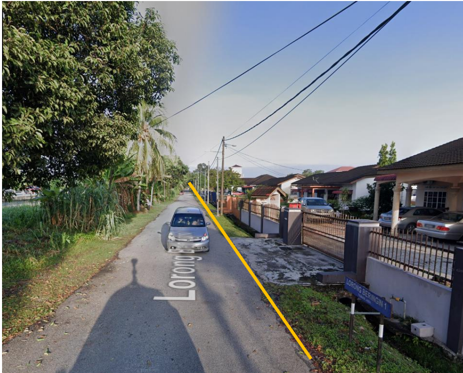
GAMBAR 3 : KAWASAN KERJA YANG MELIBATKAN KOREKAN SECARA TERBUKA LORONG BERINGIN 1