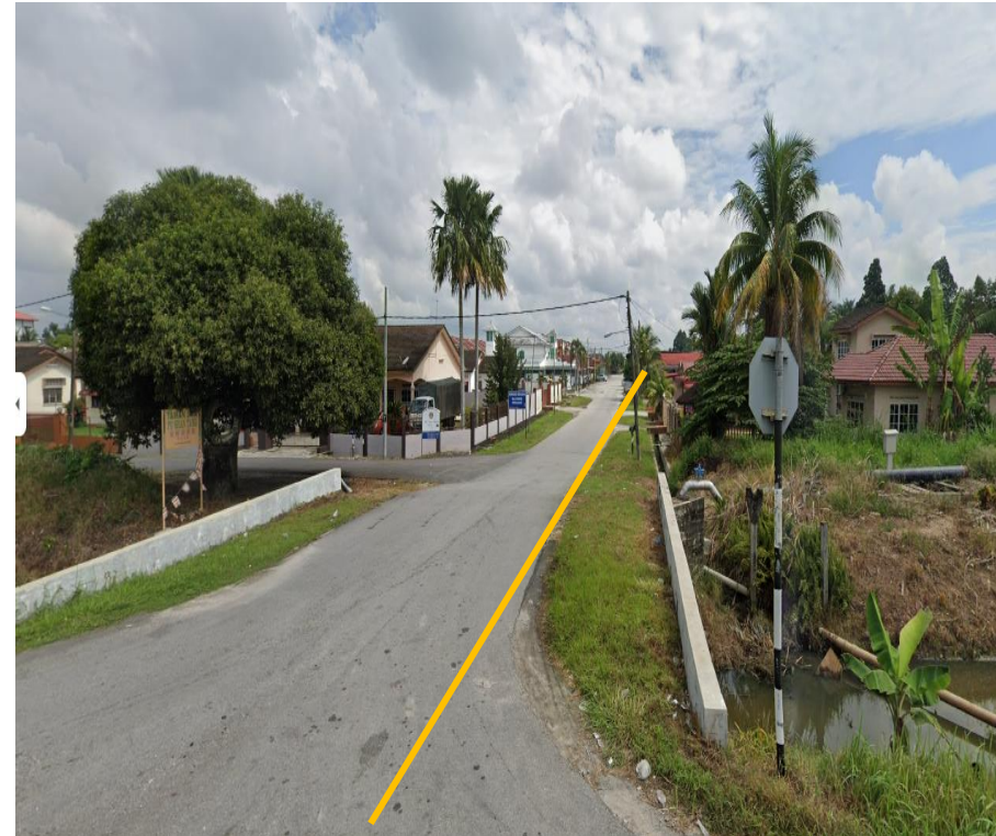
GAMBAR 2 : KAWASAN KERJA YANG MELIBATKAN KOREKAN SECARA TERBUKA LORONG BERINGIN 7