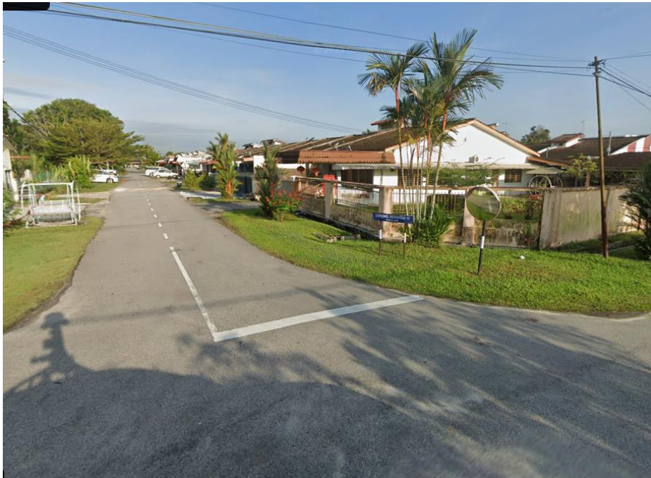
GAMBAR 5 : KAWASAN KERJA YANG MELIBATKAN KOREKAN SECARA TERBUKA LORONG BERINGIN 10