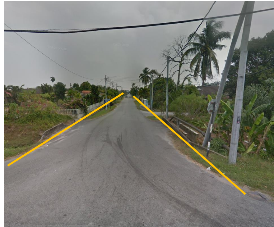
GAMBAR 4 : KAWASAN KERJA YANG MELIBATKAN KOREKAN SECARA TERBUKA JALAN JELUTONG