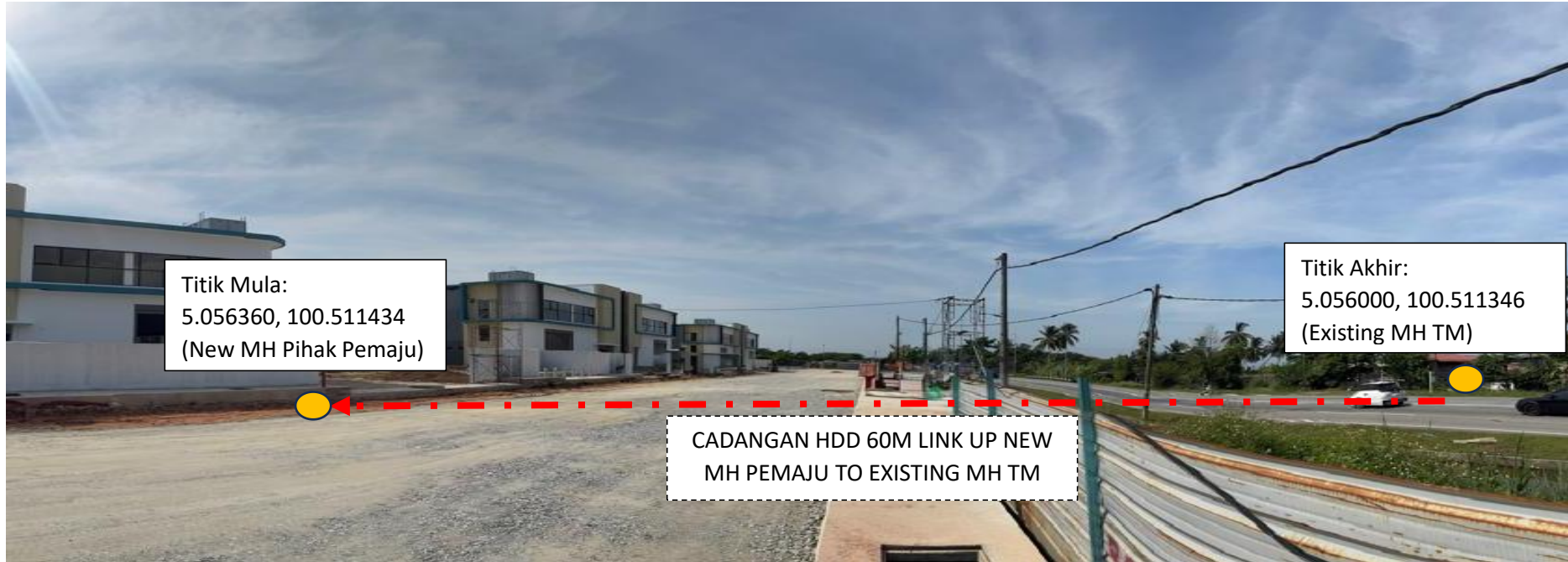
PANDANGAN DARI SEBELAH TEPI KAWASAN (SEBERANG JALAN)