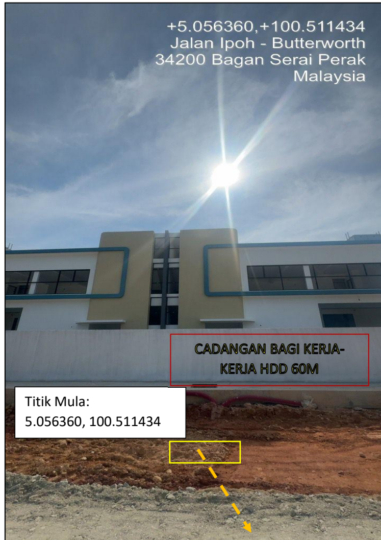
GAMBAR 1 : TITIK MULA LOKASI BAGI MELAKUKAN KERJA-KERJA HDD MH BARU PIHAK PEMAJU