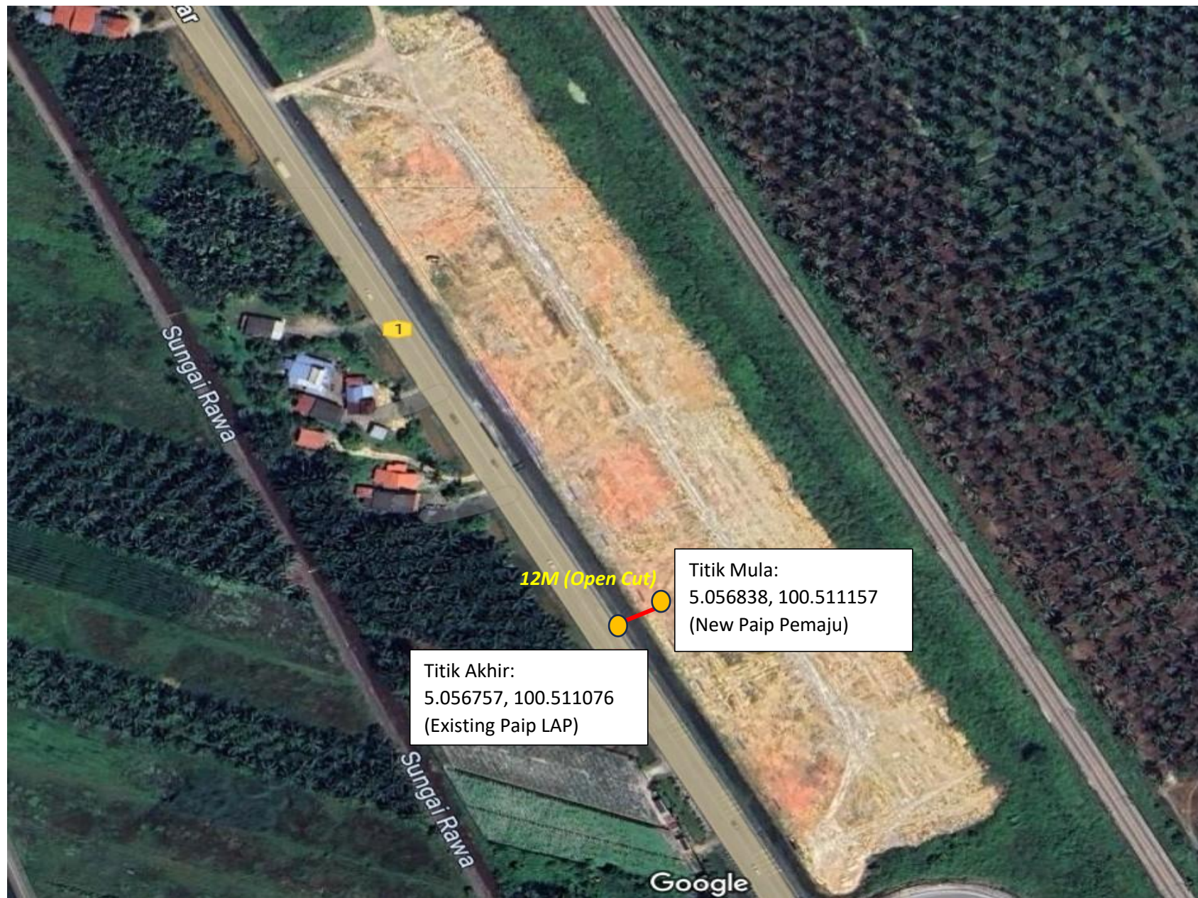
CADANGAN LALUAN KABEL SECARA OPEN CUT SEPANJANG 12M