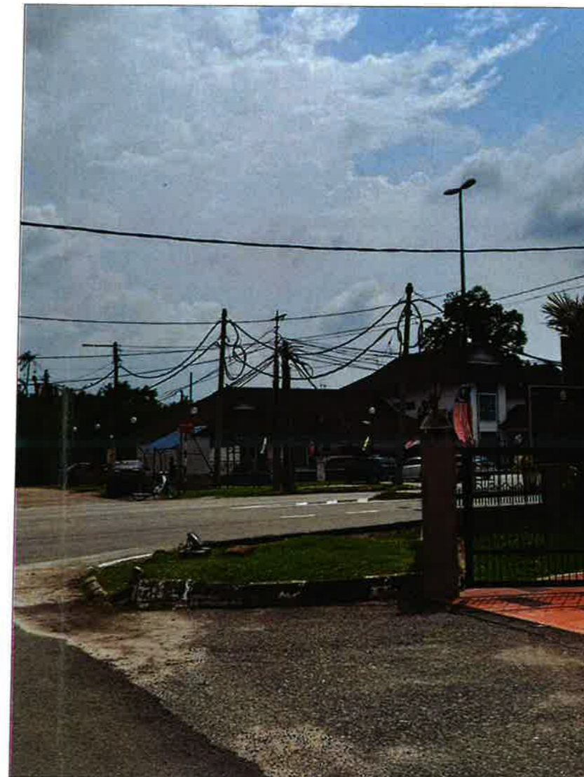
LOCATION PLAN 2

COORDINATE 44.500982756557387, 100.78032200917579