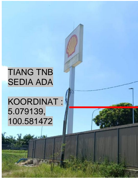
TIANG TNB SEDIA ADA