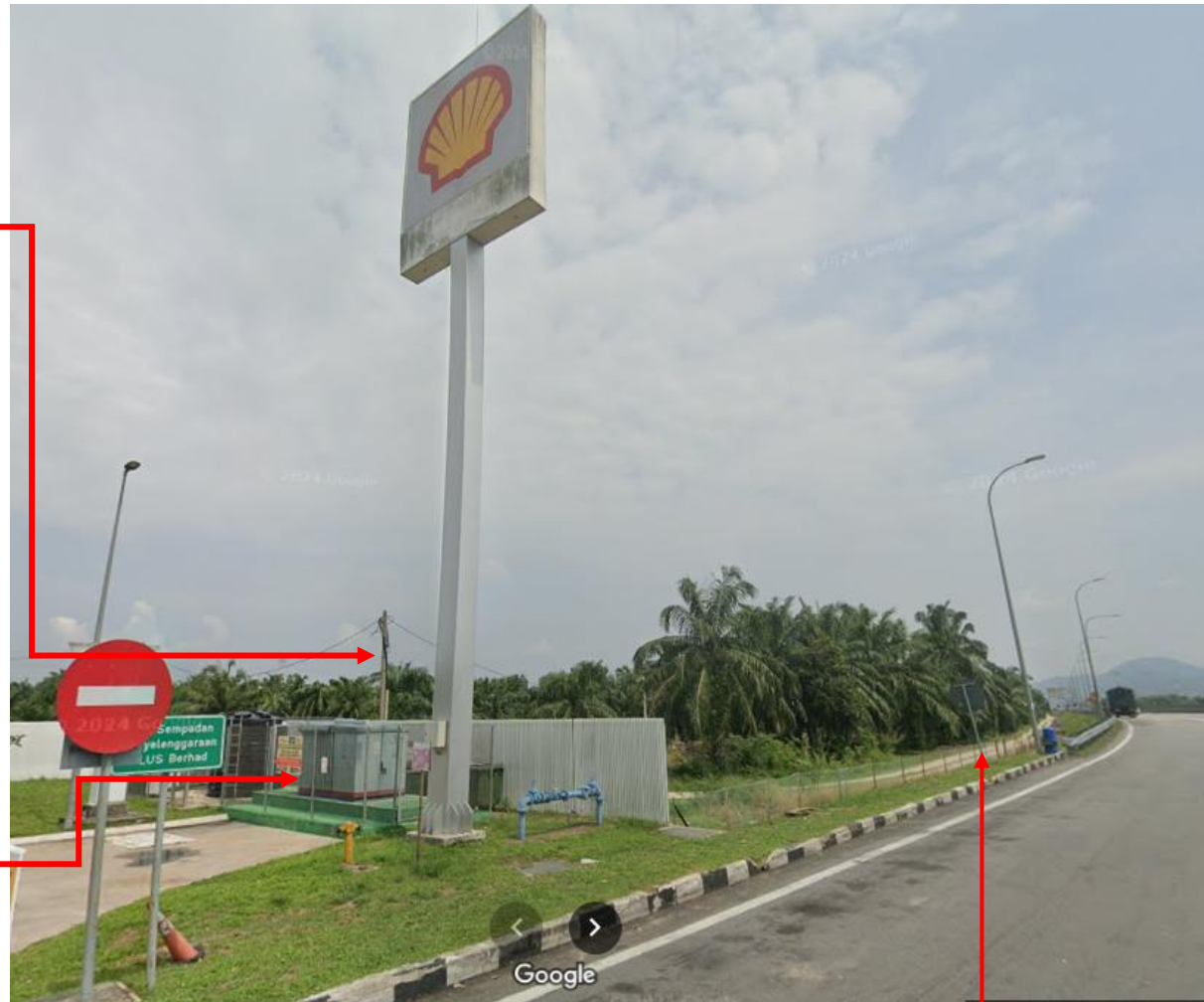
JALAN RIZAB YANG DI POHON