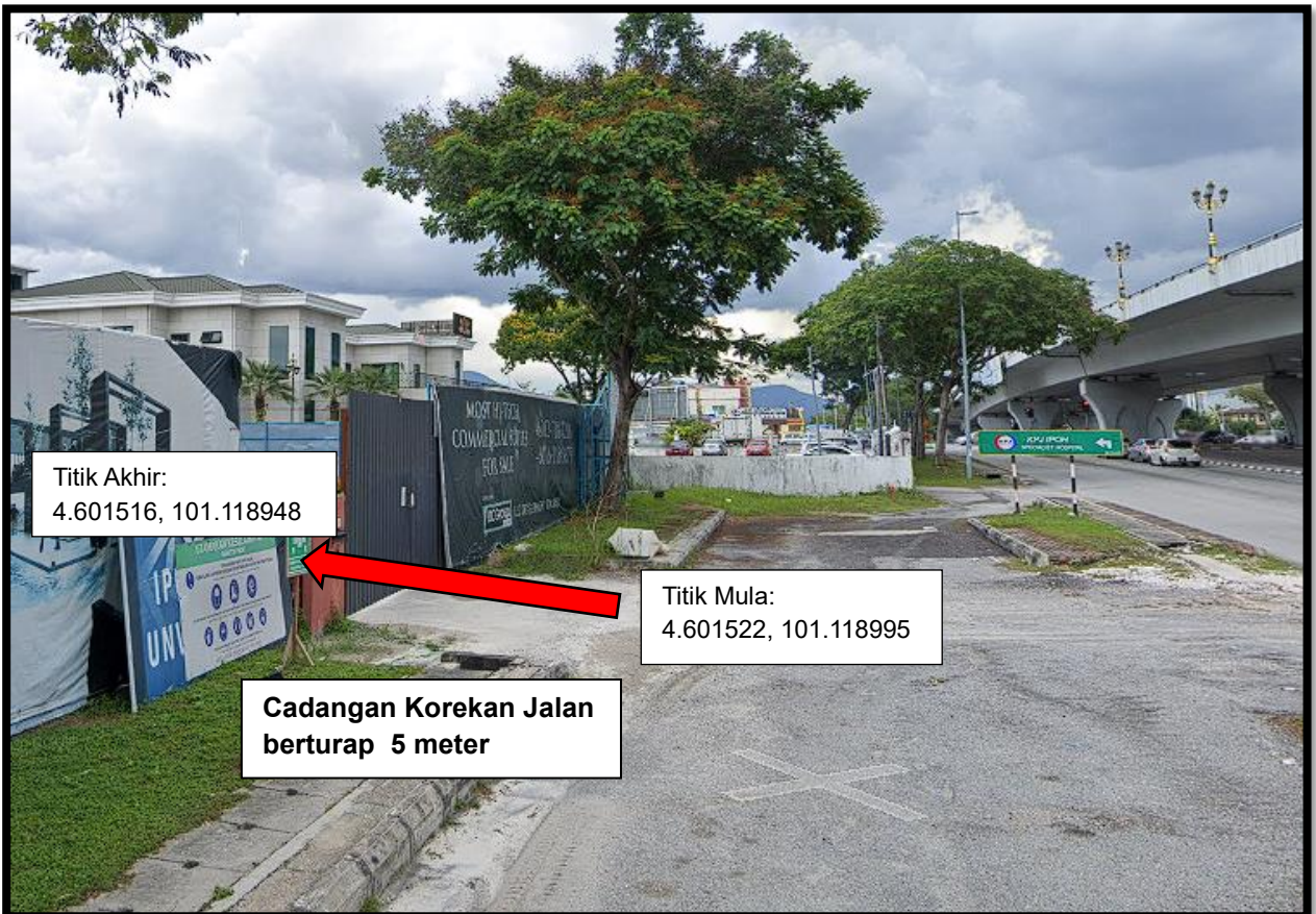
PHOTO : KAWASAN PEMASANGAN KABEL