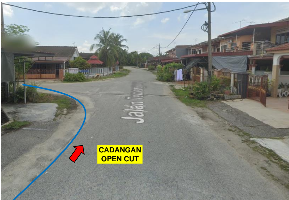
GAMBAR 6: KAWASAN KERJA MELIBATKAN PEMOTONGAN JALAN (OPEN CUT)