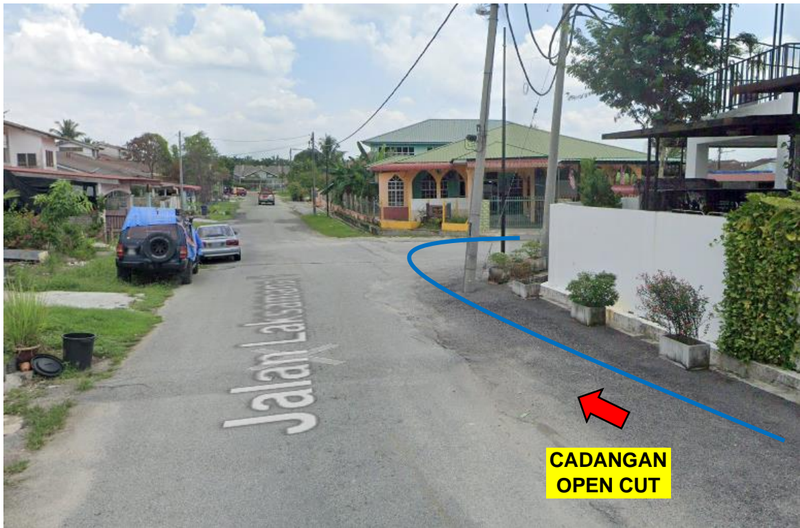
GAMBAR 5: KAWASAN KERJA MELIBATKAN PEMOTONGAN JALAN (OPEN CUT)