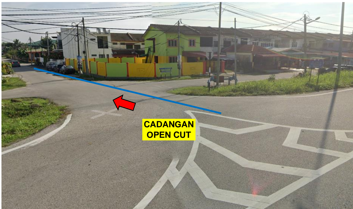
GAMBAR 4: KAWASAN KERJA MELIBATKAN PEMOTONGAN JALAN (OPEN CUT)