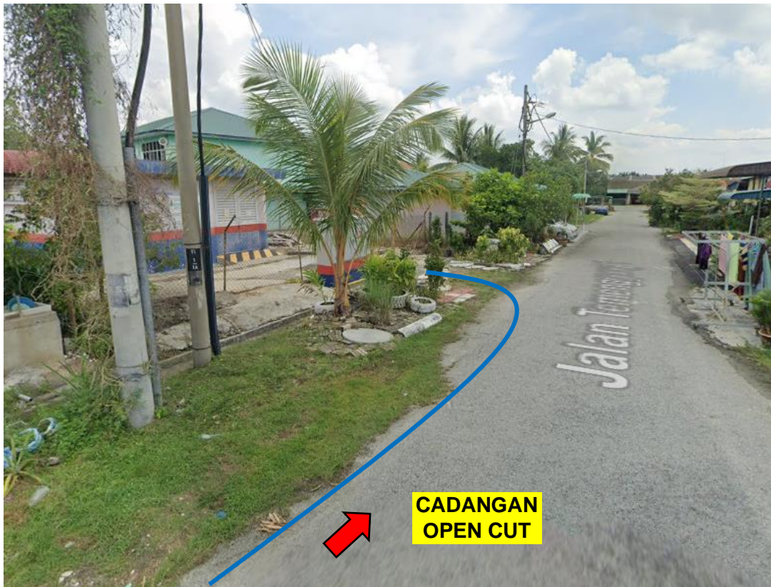
GAMBAR 7: KAWASAN KERJA MELIBATKAN PEMOTONGAN JALAN (OPEN CUT)