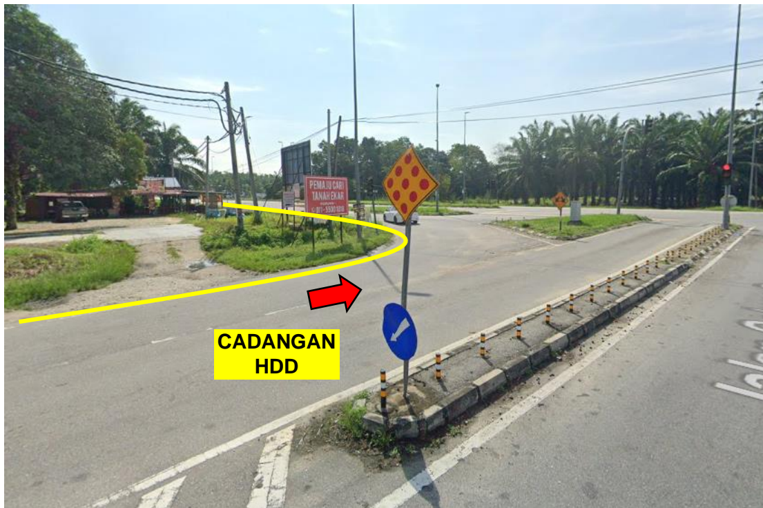
GAMBAR 2: KAWASAN KERJA MELIBATKAN 'HORIZONTAL DIRECTIONAL DRILLING'