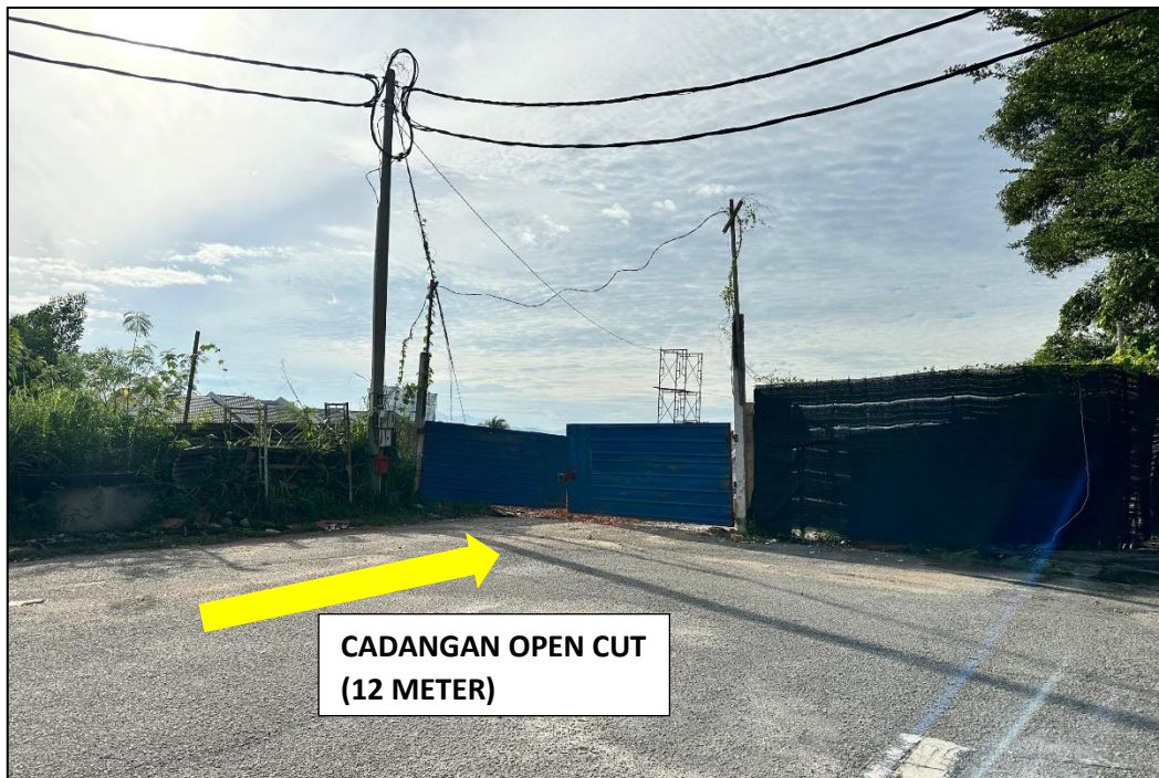
GAMBAR 4: KAWASAN KERJA MELIBATKAN OPEN CUT (CHEMOR IMPIAN 12)