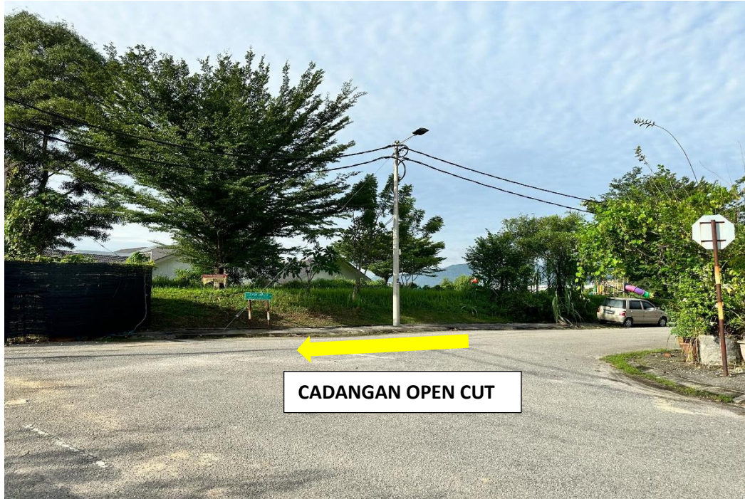
GAMBAR 3: KAWASAN KERJA MELIBATKAN OPEN CUT (CHEMOR IMPIAN 13)