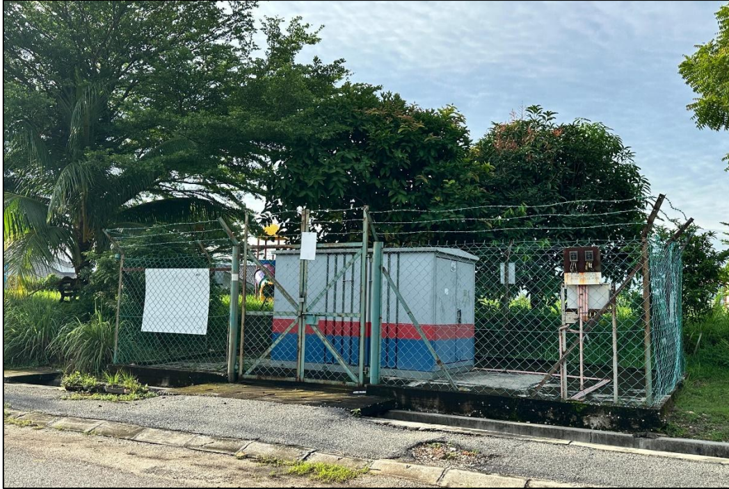
GAMBAR 1: PENCAWANG SEDIA ADA (PENCAWANG PDT CHEMOR IMPIAN)