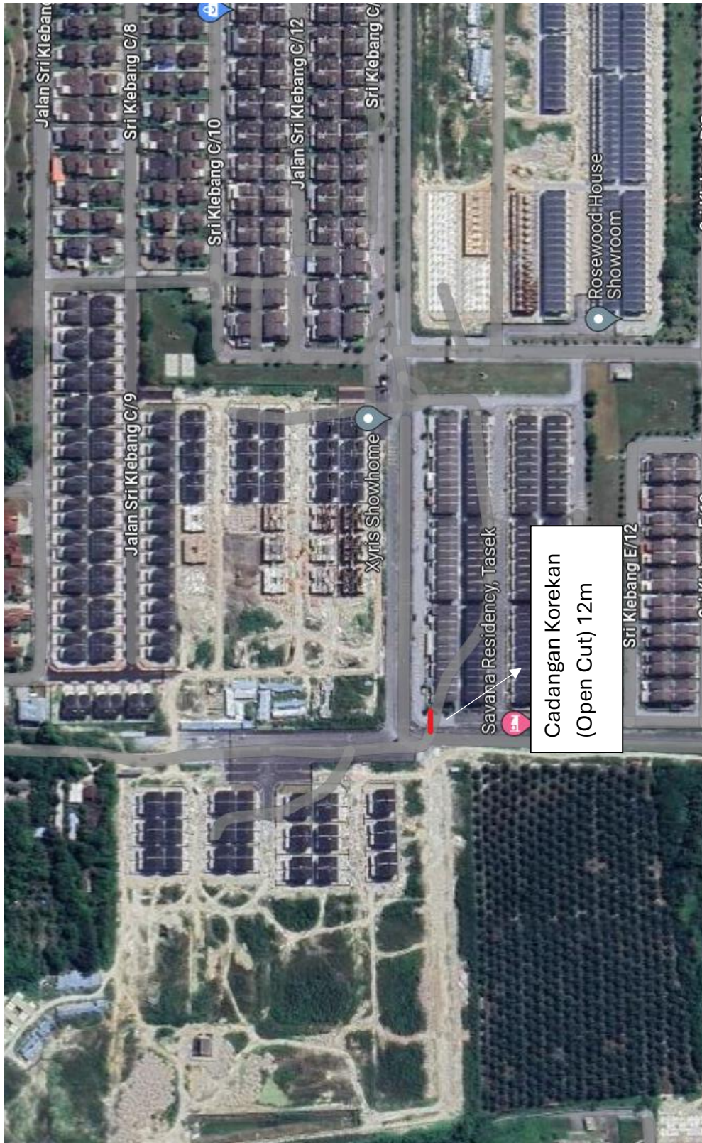
GAMBAR 2: PETA LOKASI