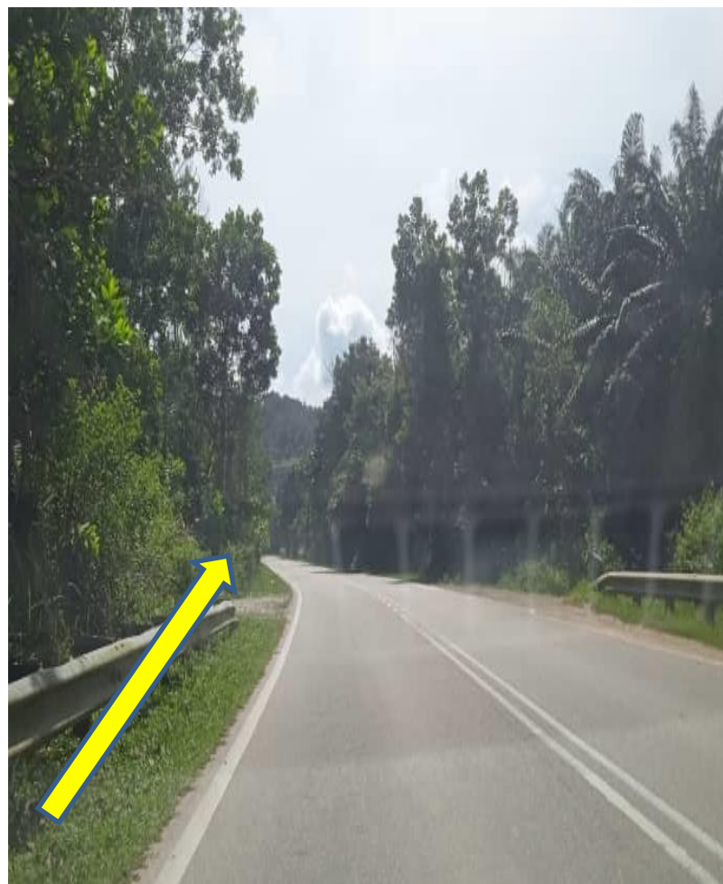
CADANGAN OPEN CUT ATAS TANAH