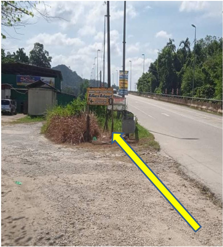
CADANGAN KOREKAN ATAS TANAH