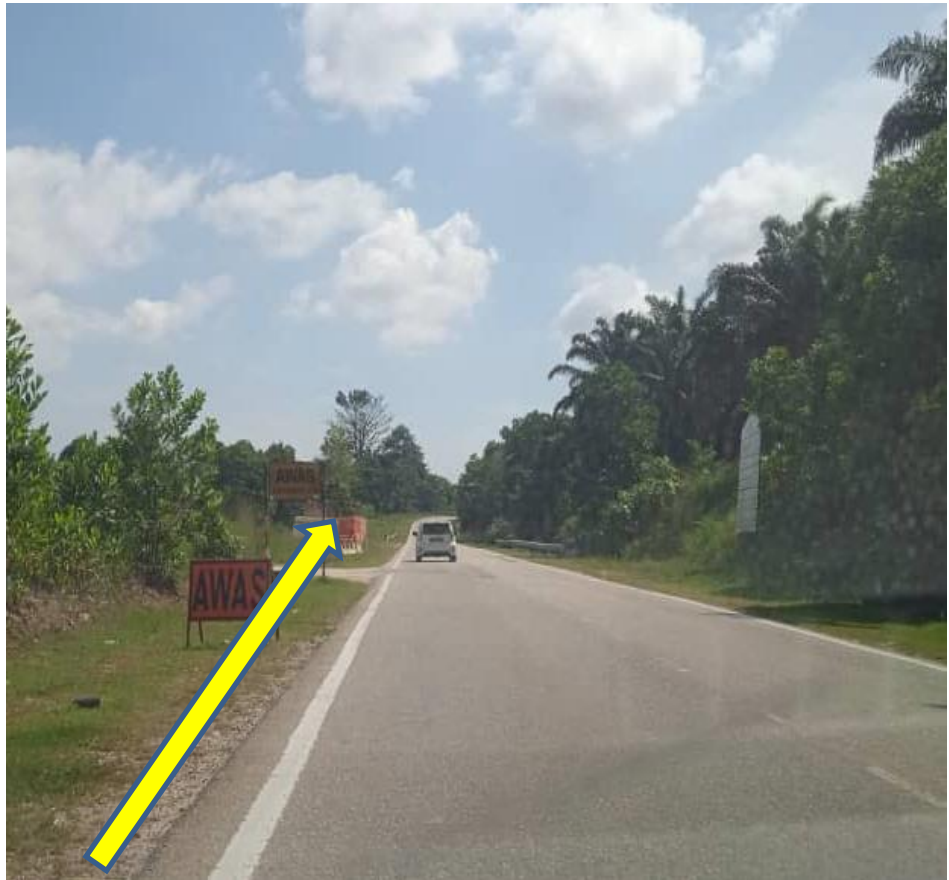
CADANGAN OPEN CUT ATAS TANAH