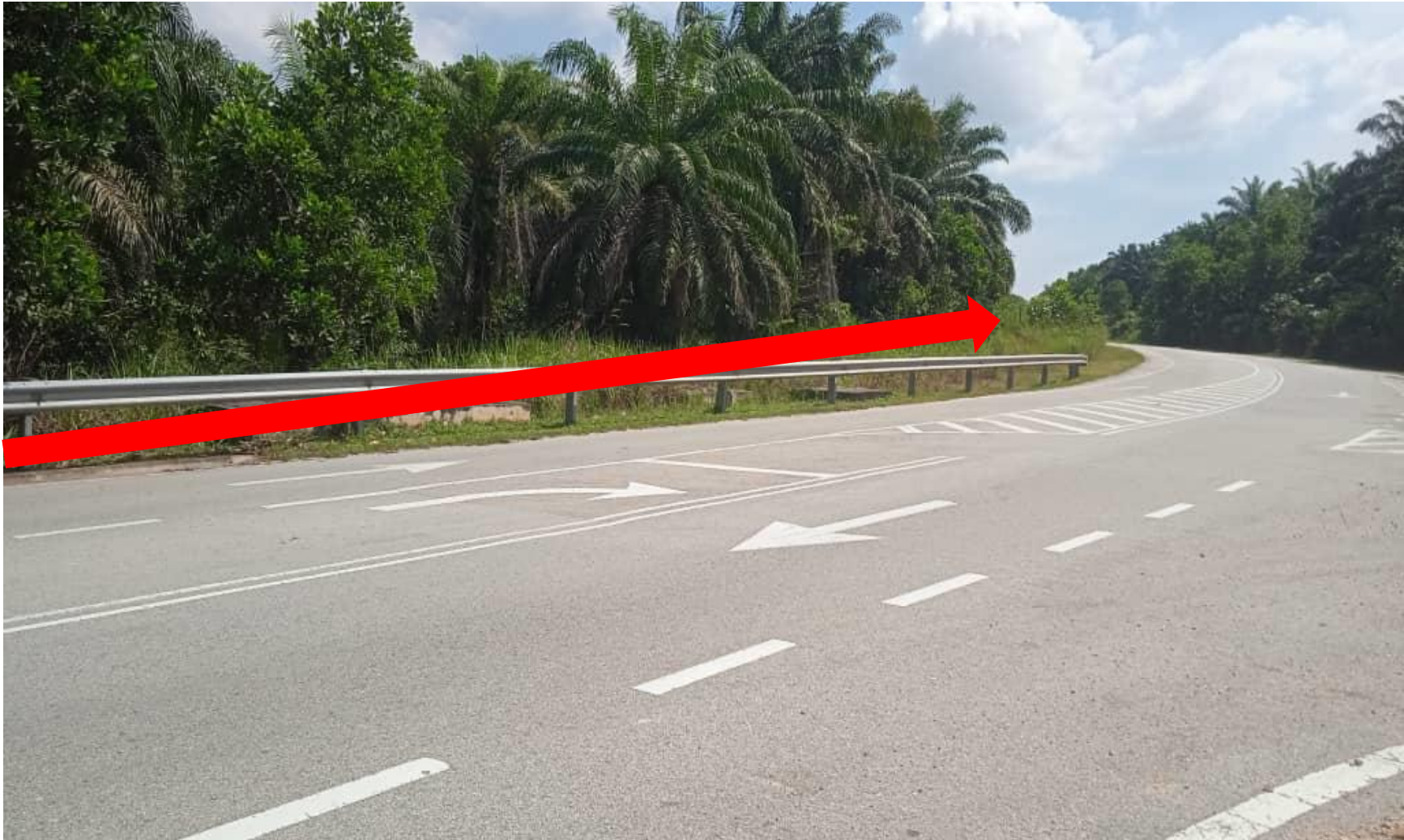
HDD-HORIZONTAL DIRECTIONAL DRILLING (162 METER)