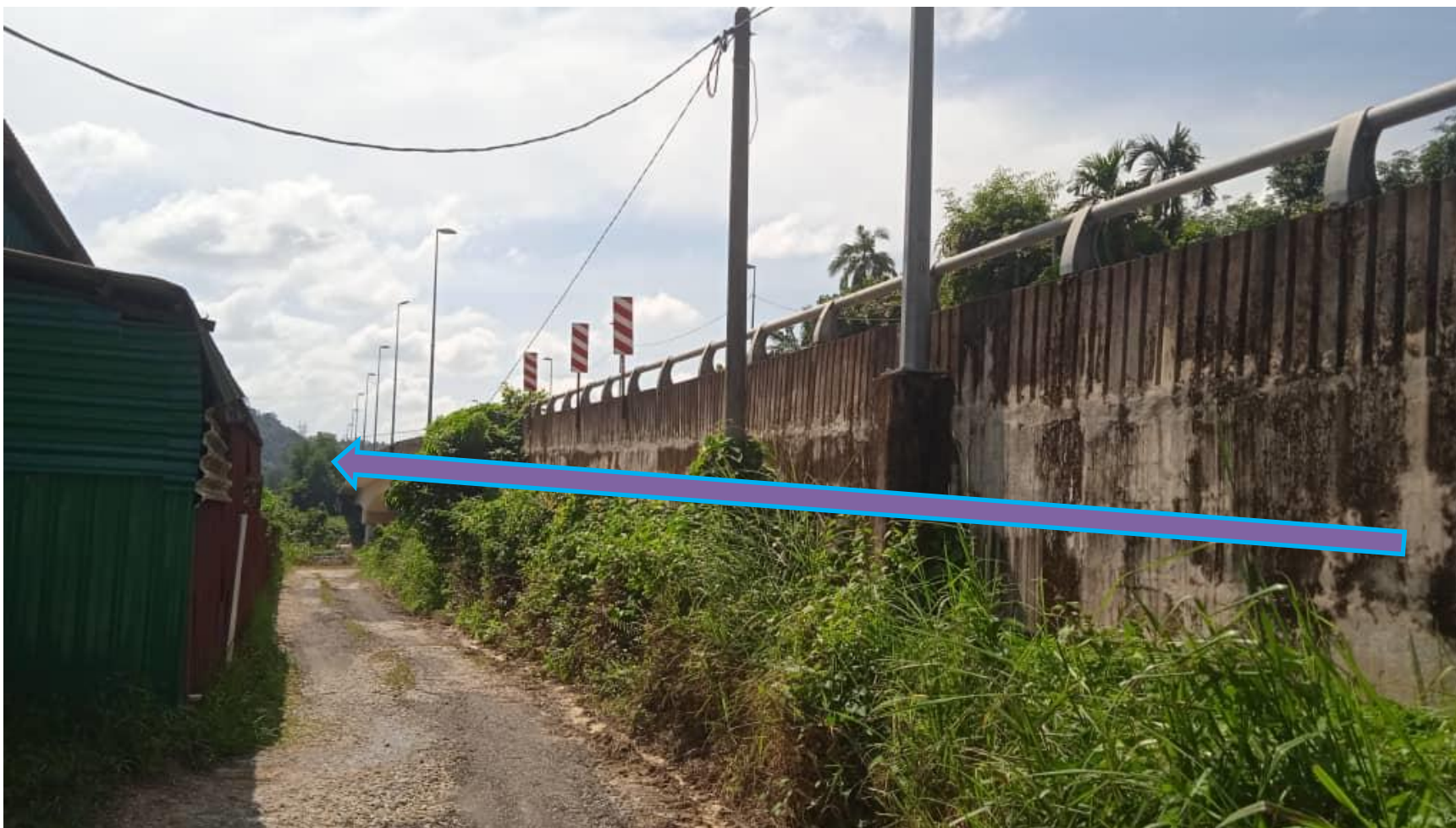
RENTANGAN KABEL TNB DI TEPI JAMBATAN BESERTA L-BRAKET DAN PAIP (300 METER)