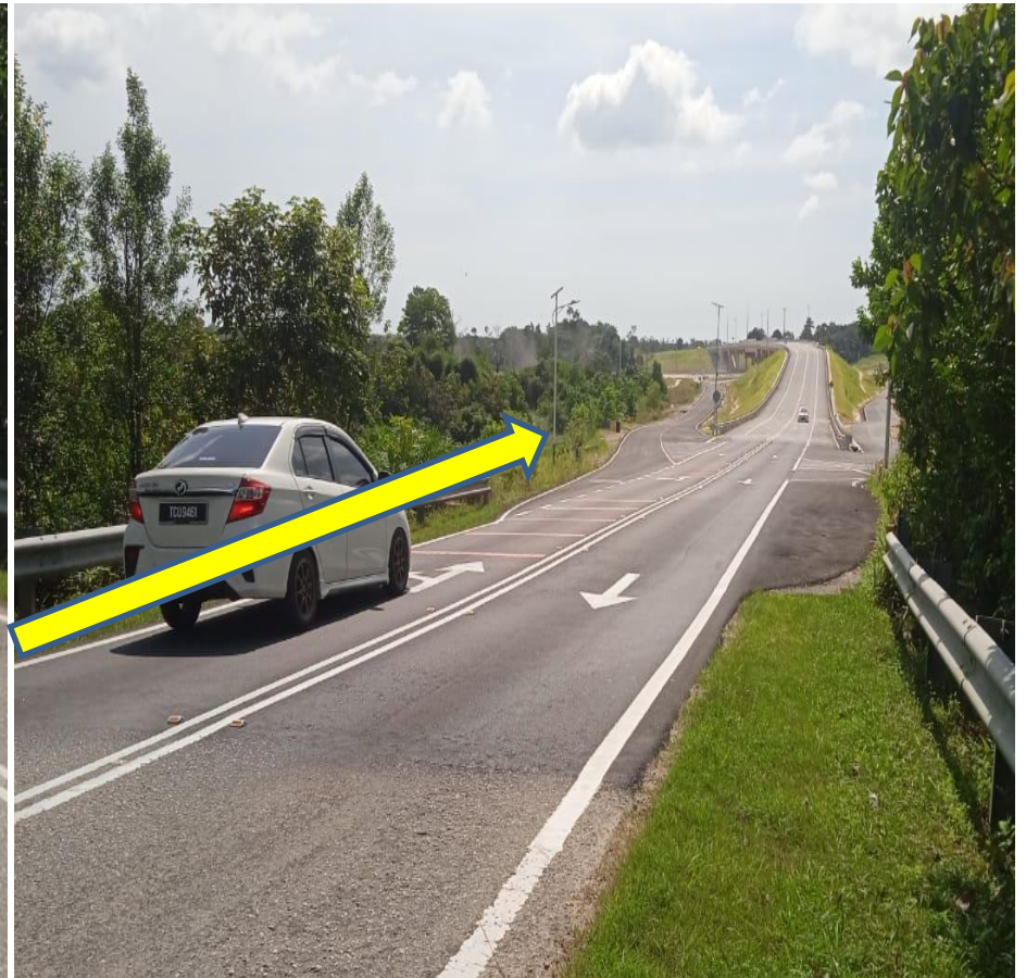
CADANGAN OPEN CUT ATAS TANAH