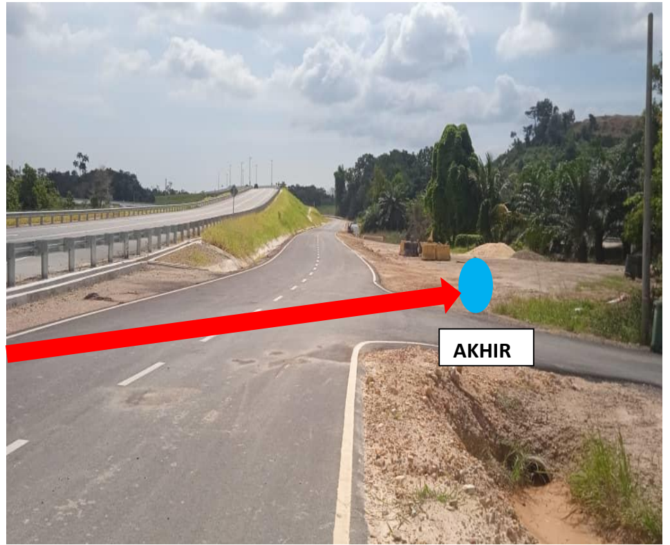
HDD-HORIZONTAL DIRECTIONAL DRILLING (70 METER)