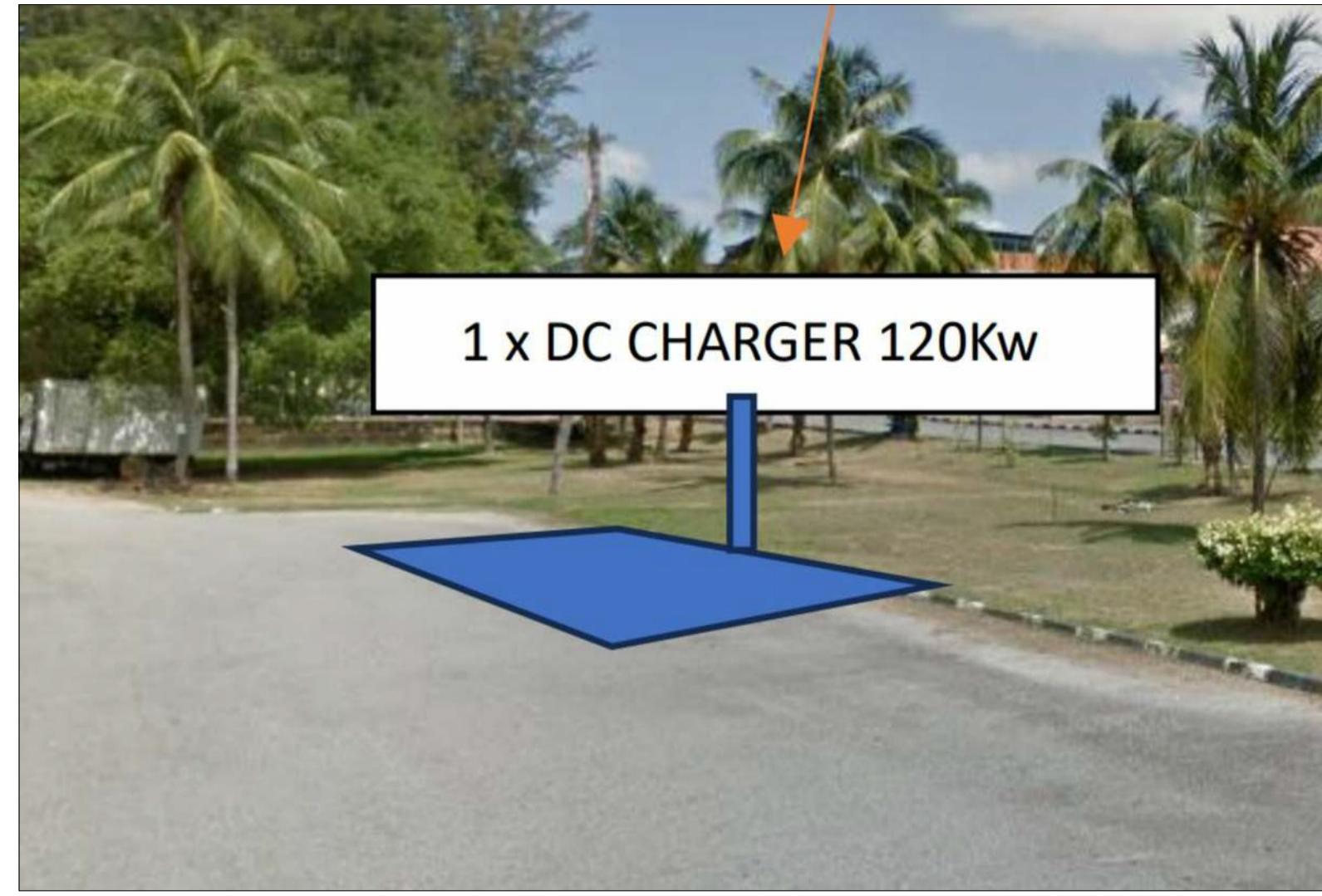
PARKING AWAM PANTAI BATU BURUK